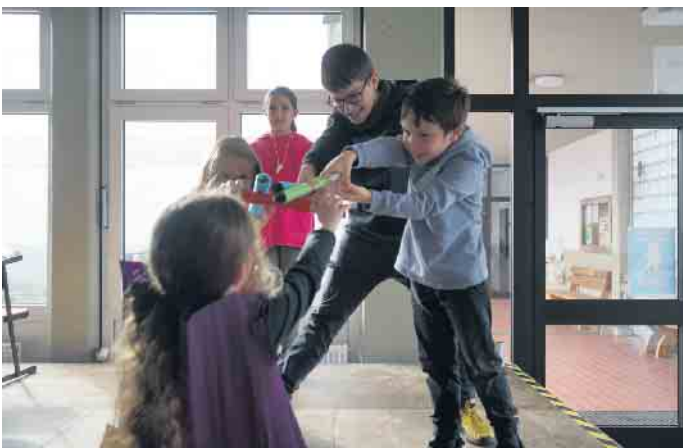
Mit Laserschwertern kämpften die Kinder gegen Märchenfiguren.