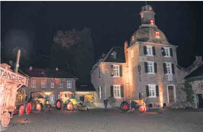
Effektiv beleuchtet war eine Ausstellung alter Landmaschinen auf dem Hof von Gut Richardshoven