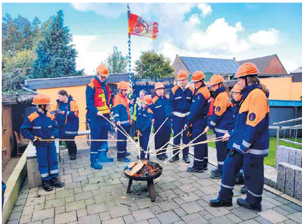
Pause zwischen den Einsätzen des Jugendfeuerwehrtages

Glücklicherweise brennt es jedoch nicht wirklich, der Einsatz für die Jugendfeuerwehrgruppen aus Heppendorf und Grouven ist nur simuliert und Teil des stadtweiten Jugendfeuerwehrtages. Auch die weiteren Jugendgruppen haben am letzten Samstag im September ihre Gerätehäuser für einen ganzen Tag besetzt. Sie verbringen Zeit auf der Wache, lernen und spielen gemeinsam, haben Dienstsport und bereiten das Essen vor. Und zwischendurch gibt es von den Betreuern organisierte, simulierte Einsatzszenarien. Nach einer Explosion auf einem Bauernhof werden gleich mehrere Menschen und Tiere von den Gruppen aus Giesendorf und Berrendorf-Wüllenrath gerettet. Auf dem Heckelsberg suchen die Jugendfeuerwehren aus Oberembt und Tollhausen eine verwirrte Person. In Niederembt wird nach einem Verkehrsunfall ein Auto mit speziellen Geräten geöffnet, und in Elsdorf ein Kellerbrand gelöscht. Über eine Übungs-Leitstelle werden diese Einsätze ko-