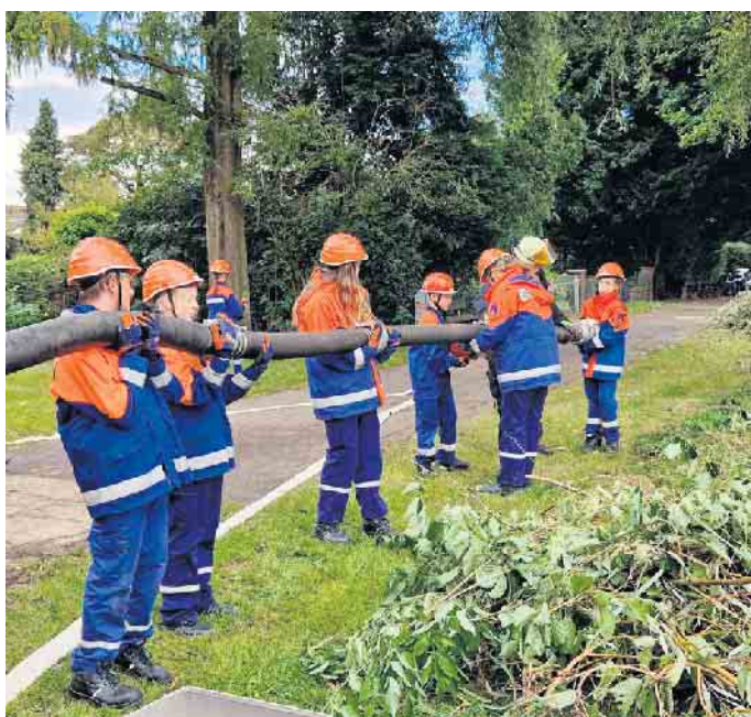
Die Wasserversorgung wird von den Jugendlichen hergestellt

Übrigens: mitmachen kann man in der Jugendfeuerwehr ab 10 Jahren, und in der aktiven Einsatzabteilung dann ab 18. Mehr Infos gibt es unter www.stadtfeuerwehr-elsdorf.de