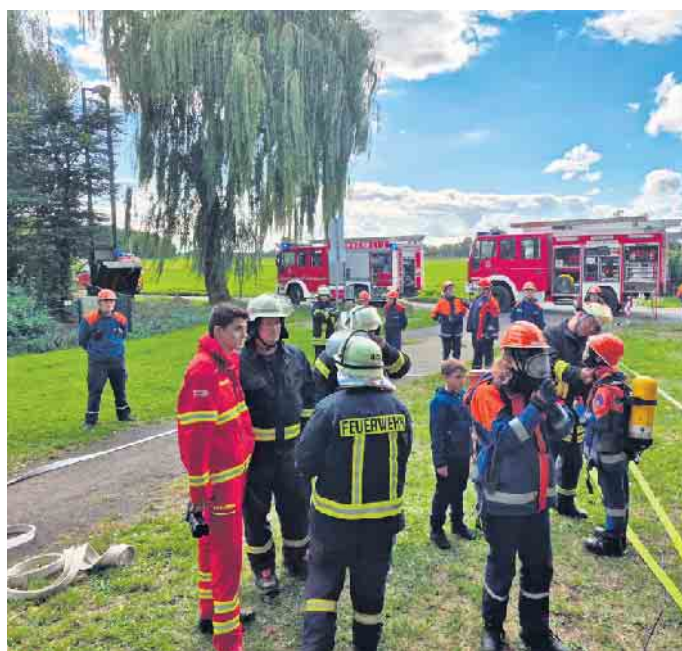
Einsatz am Grouvener Weiher