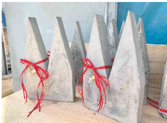
Der Dom darf nicht fehlen

Wir laden ein zum großen Wohltätigkeits- und Traditionsbasar der Bastelgruppe „et kütt wie et