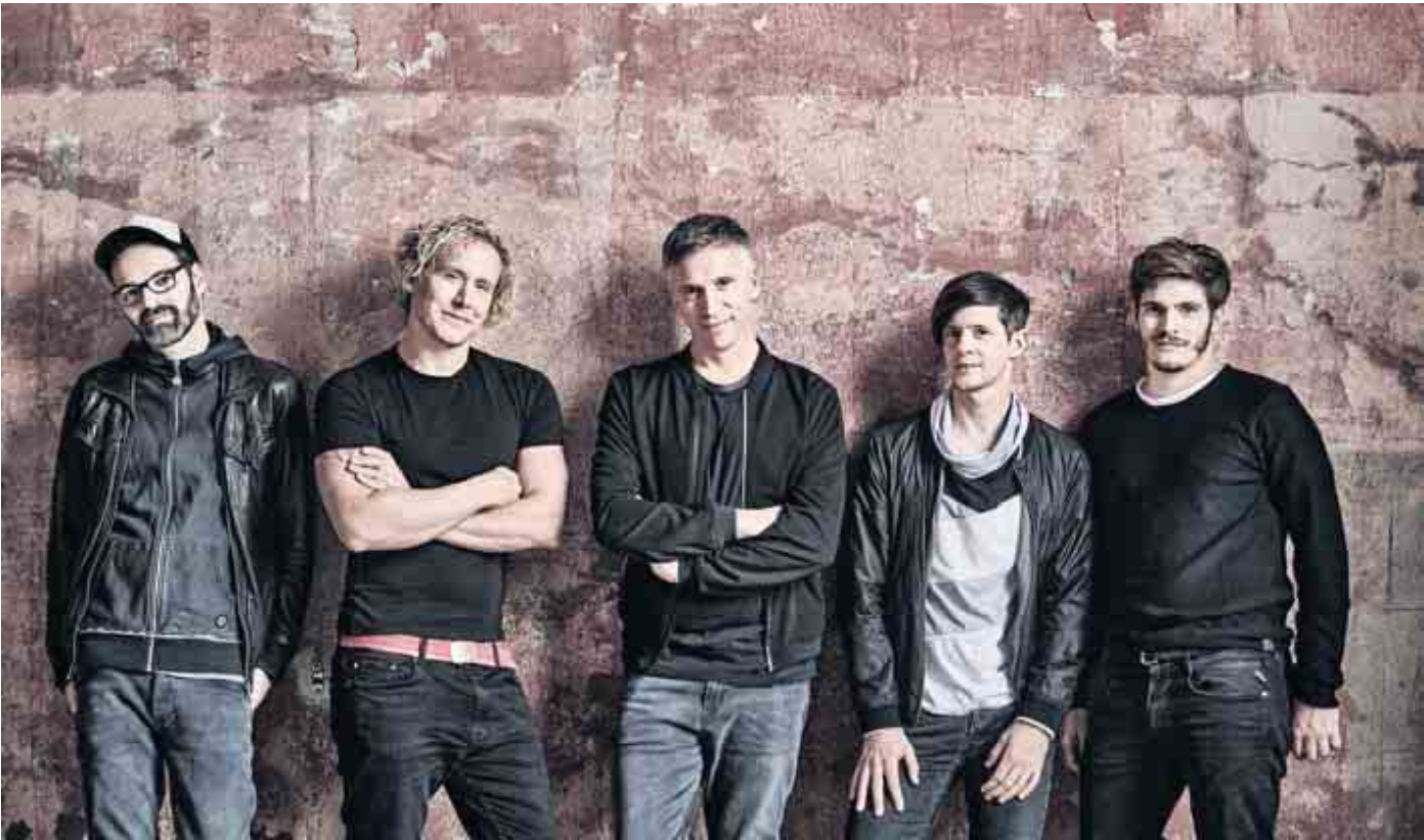
Die fünf Jungs von Kasalla sorgen bei der Großen Kostümsitzung für Kölsche Töne.

Bei der Großen Kostümsitzung lockt wieder ein hochkarätiges Programm