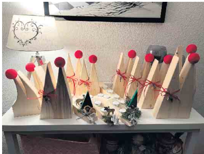
Tolle Sachen aus Holz

kütt“ e.V., wir freuen uns über Euer Kommen und heißen Euch alle herzlich Willkommen.