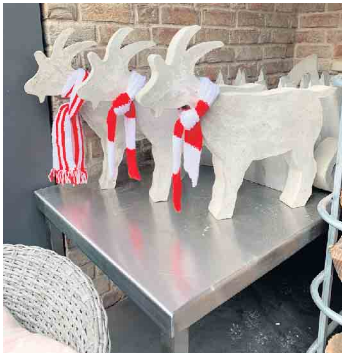
Tolle Sachen aus Beton

von der Bastelgruppe „et ütt wie et kütt“ e.V.