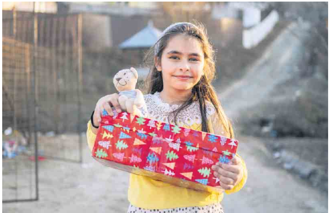
Ein Mädchen aus Rumänien freut sich über ihr Geschenkpaket.

Von Süßigkeiten wird abgeraten , da diese in Nicht-EU-Ländern nicht erlaubt sind. Aus Kartons, die in Nicht-EU-Länder verschickt werden, werden die Süßigkeiten entfernt und umgepackt. Süßigkeiten müssen bis mindestens März des Folgejahres haltbar sein. Bis zur offiziellen Abgabewoche