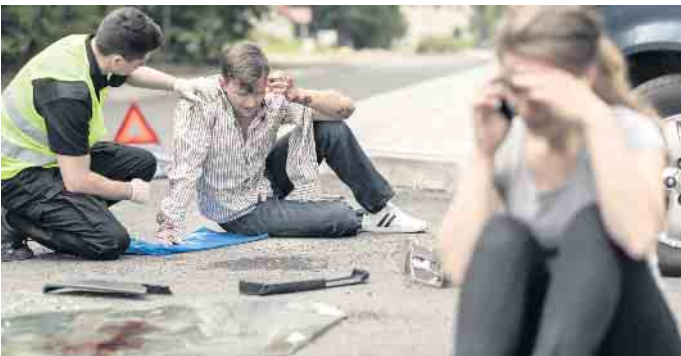
Jeder Mensch in Deutschland ist dazu verpflichtet, im Rahmen seiner Möglichkeiten Maßnahmen zur Rettung und Versorgung von Unfallopfern zu ergreifen.

Erste Hilfe, Rettungsgasse, Warndreieck: Was Verkehrsteilnehmer wissen sollten