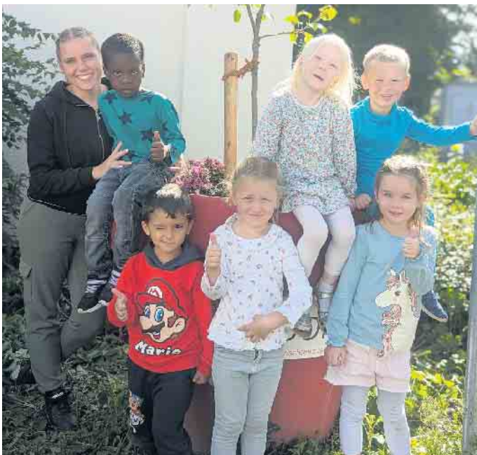
In 15 großen Blumentöpfen, wie hier auf dem Heppendorfer Dorfplatz, wurden dank eines Kita-Projekts neue Obstbäume eingepflanzt.

Neue Obstbäume: Klimaschutzpreis-Projekt geht in die Umsetzung