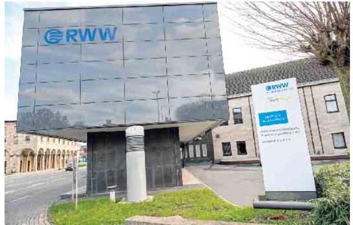
Der Hauptsitz der RWW (Rheinisch-Westfälische Wasserwerksgesellschaft) in Mülheim an der Ruhr