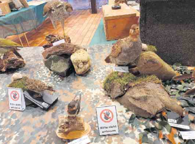
Heimische Vogelarten

„Gemeinsam informieren“ ist der Leitgedanke der Ausstellung, die die Initiative „NACHHALTIG - Heute für Morgen!“ in Zusammenarbeit mit der Ev. Kirchengemeinde Sindorf am Samstag, 27. und Sonntag, 28. September , jeweils in der Zeit von 10 bis 16 Uhr zum Thema „Biologische Vielfalt“ im Evangelischen Gemeindezentrum Sindorf, Augsburg Str. 23, 50170 Kerpen, gestaltet. Die Veranstaltung startet in Kooperation mit dem NABU Rhein-Erft, Ortsgruppe Kerpen, den Tierfreunden Rhein-Erft, dem