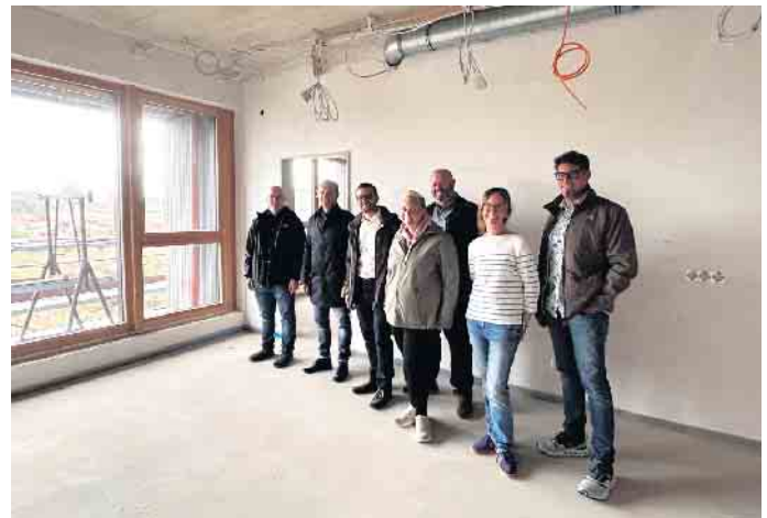
Vertreter/innen von Verwaltung, Bauträger und Elternbeirat besichtigten die Baustelle und erhielten bereits einen Eindruck von den großzügigen Räumlichkeiten.