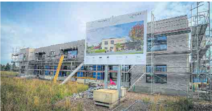
Der Baufortschritt der Kita Elsbären in Heppendorf liegt gut im Zeitplan.

Mitten im grünen Neubaugebiet „Am Roßfließ“ in Elsdorf-Heppendorf wächst nicht nur ein neues Wohnviertel, sondern auch ein zentraler Ort für Kinder und Familien: Die Kita „Elsbären“. Der moderne Neubau, der künftig bis zu 100 Kindern Platz bieten wird, liegt voll im Zeitplan - und macht bereits heute Lust auf das, was kommt. Insgesamt entstehen fünf Gruppenräume, davon einer speziell für Kinder unter drei Jahren mit separatem Gruppenbereich und eigenem Außenspielplatz. Neben den Gruppenräumen sind ein Schlafbereich, ein Spielflur sowie ein Multifunktionsraum vorgesehen, in dem zukünftig kleine Feste gefeiert werden können. Ein besonderes High-