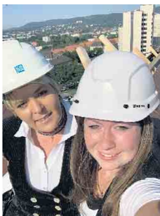
Klimaschutz, keine reine Männersache; es gibt auch Frauen im Dachdeckerhandwerk.

Einer der Gründe sind unzureichende Renovierungsraten. Angestrebt werden müsse mindestens eine Verdoppelung der derzeitigen Rate, die aktuell bei 1 % liegt. Besser noch wäre nach Meinung der Klimaexperten eine Rate von 3,5 %. Hier kommt das Dachdeckerhandwerk ins Spiel: Sie führen geeignete Maßnahmen wie Wärmedämmung an Wänden, am Dach oder an der oberen Geschossdecke aus, durch die schon viel Energie eingespart werden kann. Dachdecker und Dachdeckerinnen sind wichtige Berater, wenn es darum geht, welche Maßnahmen sinnvoll sind, aber auch, welche Fördergelder infrage kommen. Zum Beispiel lassen sich durch Kredite bei der KfW oder der Nutzung von Steuerermäßigungen für energetische Sanierungen auch im privaten Wohnungsbau deutliche Einspareffekte erzielen. „Dachdecker sind daher