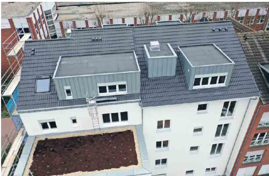
Dachdecker lassen Dächer auch ergünen.

Im Bereich Gebäudesektor liegt Deutschland im Vergleich mit den zwanzig wichtigsten Industrie- und Schwellenländern bei der Energieeffizienz im Neubau vorne. Die weniger gute Nachricht ist die schleppende energetische Sanierung bei älteren Gebäuden.