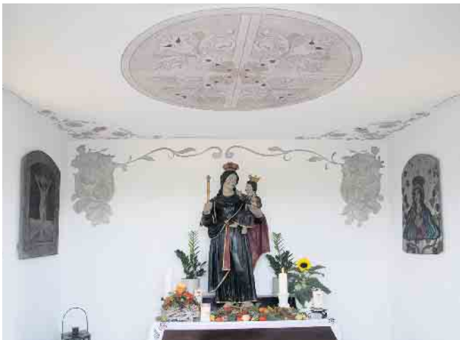
Das Innere der Kapelle wurde neu hergerichtet