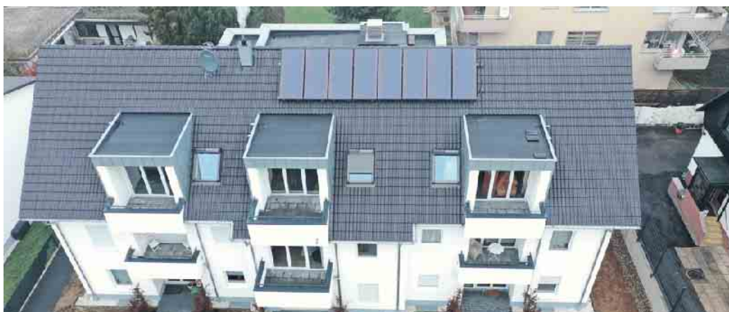
Das Dachdeckerhandwerk, der richtige Ansprechpartner für die Solaranlage auf dem Dach.