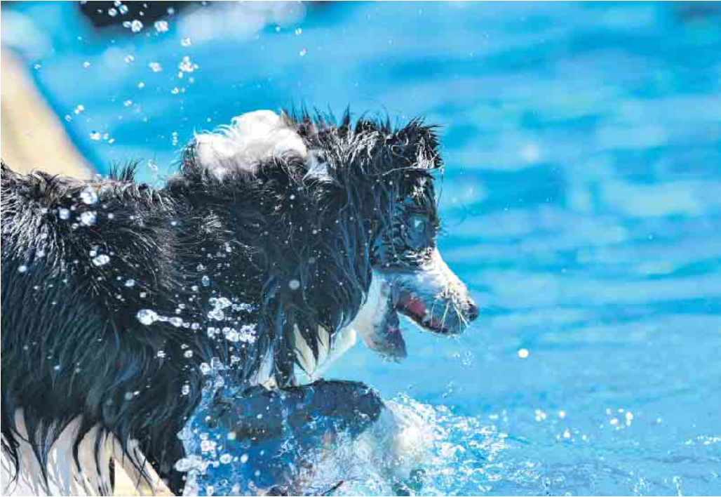
Glücklicher Vierbeiner beim Hundeschwimmen 2021