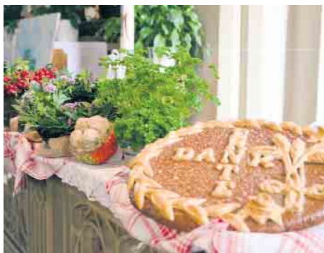
Erntedank in Niederrembt

ten zum Apfelfest ein mit Spielen und Leckereien rund um das Thema Apfel und auch der Kindergarten hält Unterhaltung für Kinder bereit. (mos)