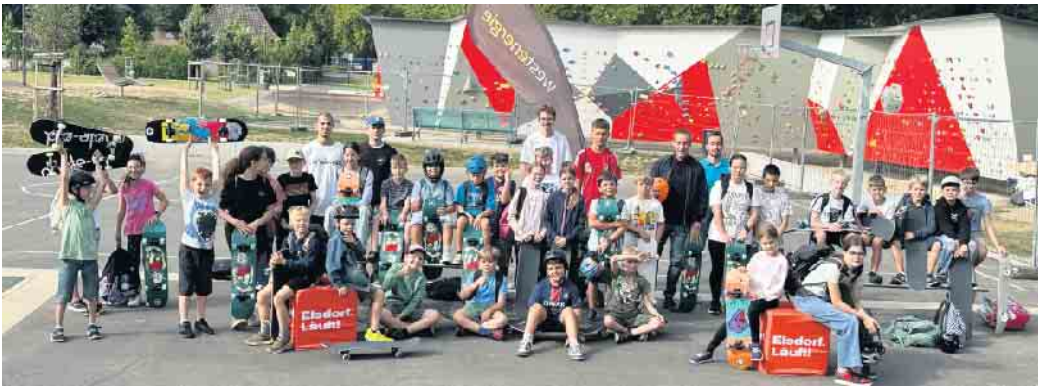
Sichtlich viel Spaß hatten die Kinder und Jugendlichen beim Westenergie-Skateboard-Workshop.