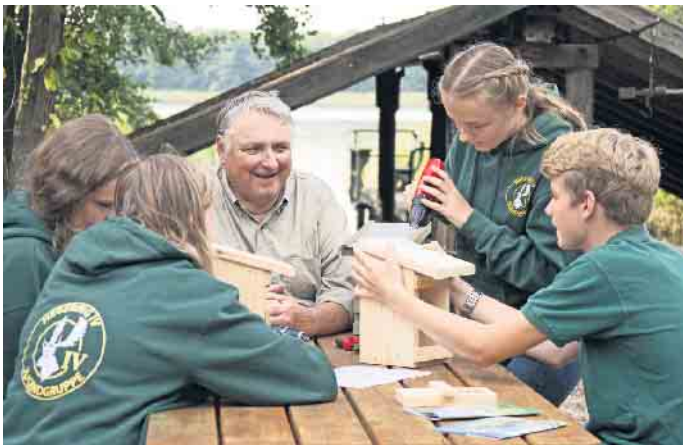
Aus unbehandeltem Holz lässt sich ein neuer Nistkasten ganz leicht selberbauen.

mindestens zwei Meter hoch hängt und das Einflugloch möglichst nach Osten oder Südosten zeigt, um vor der Witterung geschützt zu sein. Im Frühling ziehen dann neue geflügelte Mieter sicher gerne ein. (DJD).