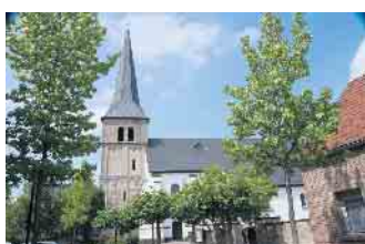
Der Kirchturm der Pfarrkirche Mariä Geburt ist 800 Jahre alt.

800-Jahr-Feier des Kirchturms - Fotoausstellung zur Historie der Pfarrkirche