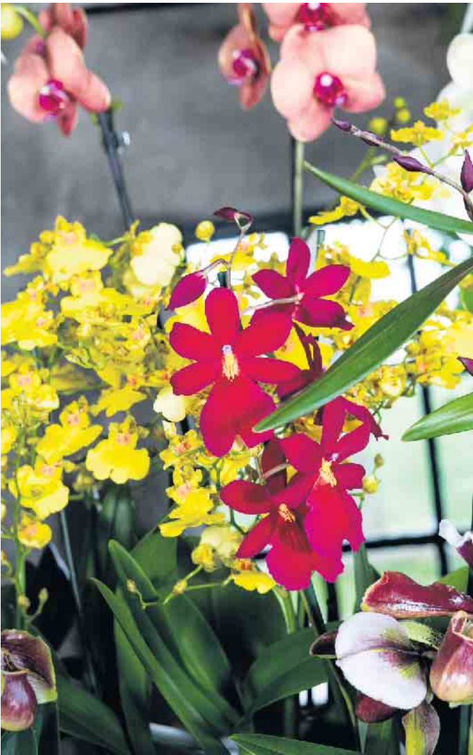
Am 4. September ist der Internationale Tag der Orchidee! Vielfalt und Langlebigkeit zeichnen diese Topfpflanzen aus.

füllt. Wer sich einen Überblick über das Sortiment und die verschiedenen Verwendungsmöglichkeiten verschaffen möchte, findet jede Menge Anregungen auf www.orchidsinfo.eu , das ist eine Kooperation niederländischer Orchideenzüchter und Gärtner, die ihr Handwerk bestens verstehen. Vollmundig haben sie für die exotische Pflanze, die so pflegeleicht ist, den Slogan „Schönheit, die bleibt“ gewählt, um ihre Langlebigkeit zu unterstreichen. GPP