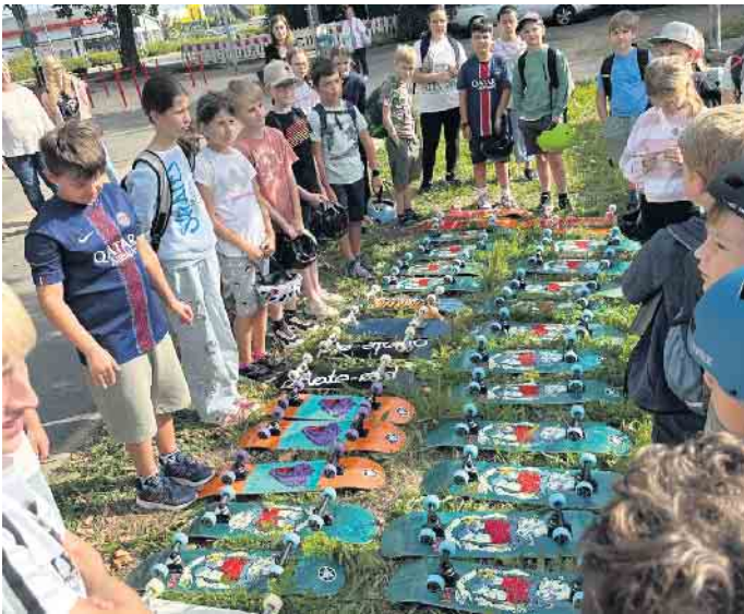
Jedes Kind hat nicht nur viel über Skateboards gelernt, sondern auch ein eigenes Skateboard als Geschenk von Westenergie erhalten.

chael Kesternich. So käme es auch, dass sich jedes Jahr mehr Kommunen für die Durchführung eines Workshops interessieren. Westenergie und die Initiative skate-aid bieten in den Sommer- und Herbstferien zum neunten Mal gemeinsame Skateboard-Workshops an. Gedacht ist das Programm für bis zu 40 Kinder und Jugendliche zwischen acht und 16 Jahren. In den zweitägigen Workshops lernen sie technische Grundlagen des Skateboardfahrens, wie zum Beispiel Fußstellung, Lenken, Beschleunigen und Bremsen, aber auch fachliche Basics: Welche Boardgröße ist für wen geeignet? Welche Auswirkungen haben weiche Rollen auf die Geschwindigkeit? Welchen Unterschied macht es, wenn das Board harte oder weiche Lenkummis hat? Ein Team um den Skateboard-Pionier und skate-aid Gründer Titus Dittmann leitet die Workshops. Sein pädagogischer Ansatz: Skaten eignet sich sowohl für die sportliche Entwicklung als auch für die Persönlichkeitsbildung. Titus Dittmann betont: „Skateboarden verbindet. Es führt die verschiedensten Menschen zusammen. Gleichzeitig schafft es Freiräume und ermöglicht