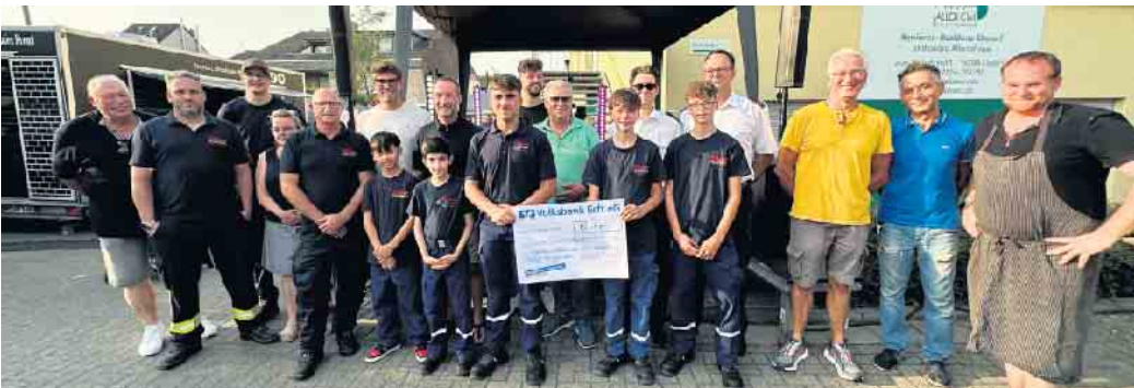
Die Gastronomen und Veranstalter des Feierabend-Marktes überreichten einen Spenden-Scheck an den Nachwuchs der Freiwilligen Feuerwehr Elsdorf.

„Seit dem ersten Termin waren alle Märkte hervorragend besucht, so dass wir das Format mit einer