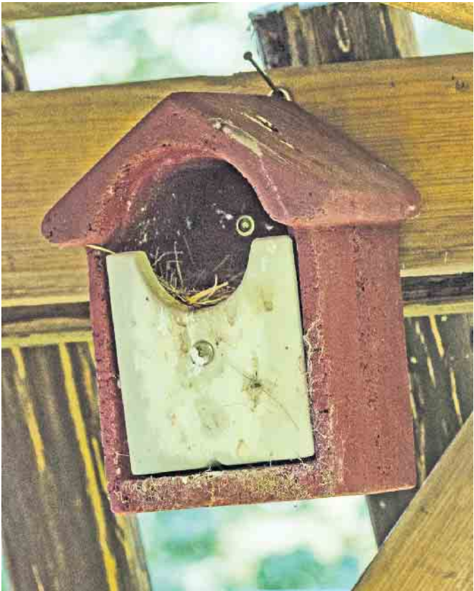
Sauber und gut geschützt vor Witterung und Feinden sollte dieVogelbehausung sein.