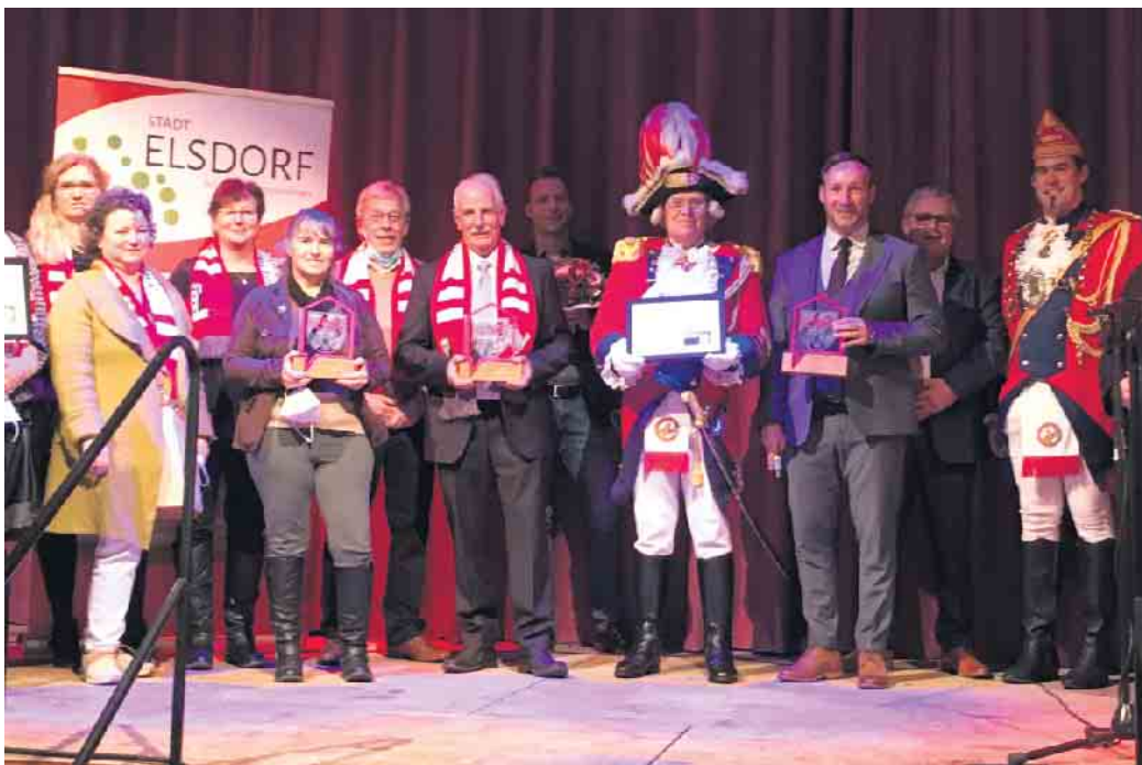
Die Gewinner des letzten Heimatpreises

„Ab sofort können natürliche Personen, Vereine und Interessengruppen, die sich im Wege von Projekten und Initiativen in besonderem Maße um die Förderung der