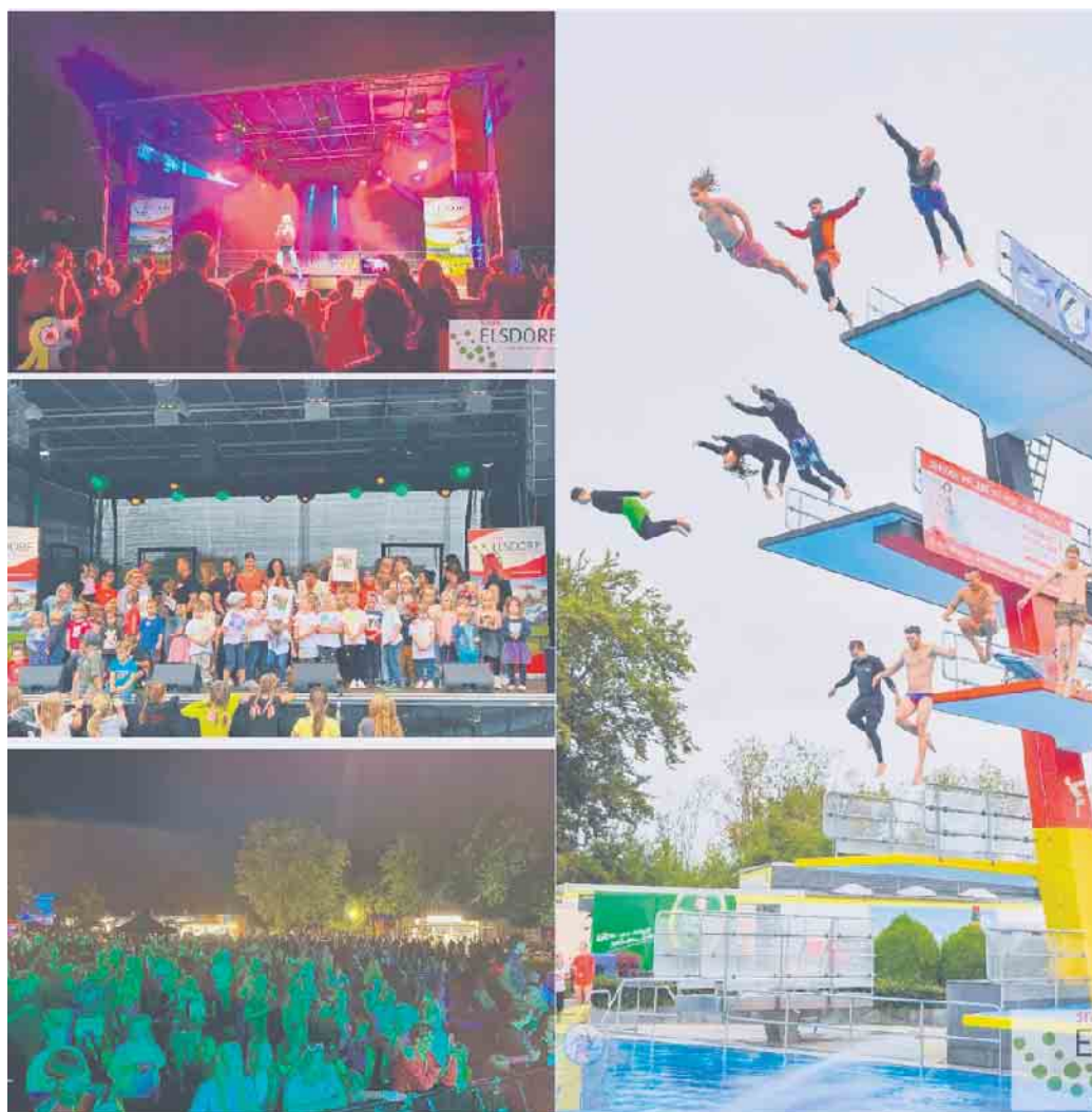
Rock around the Pool_2022