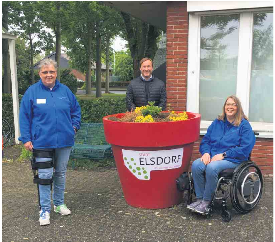
Der Inklusionsbeirat freut sich auf Dich!

Dann komm am 22. September um 19 Uhr ins Rathaus der Stadt Elsdorf (1.OG, kleines Sitzungszimmer) und werde Teil des Inklusionsbeirates der Stadt Elsdorf. Schau, ob unsere Tätigkeiten etwas für dich sind und bring gerne bereits Anregungen und Wünsche mit, wie du dir Inklusion vorstellst. Unser Tatort ist das Elsdorfer Stadtgebiet; das versuchen wir allen Menschen gerecht zu machen. Ob groß, klein, ob mit oder ohne Handicap ist uns dabei völlig egal. Wir wollen, dass sich wirklich jeder in unserer Stadt wohlfühlt. Barrieren müssen frühzeitig vermieden oder beseitigt werden. Durch einige Veranstaltungen