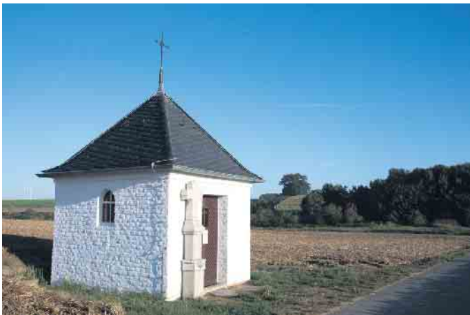
Die Marien-Kapelle in Frankeshoven erstrahlt in neuem Glanz

Oberembt auf den Weg zu Fuß zur Kapelle in einer Prozession zu Ehren der Mutter Gottes. Die Kapelle soll nun neu eingesegnet werden. (mos)