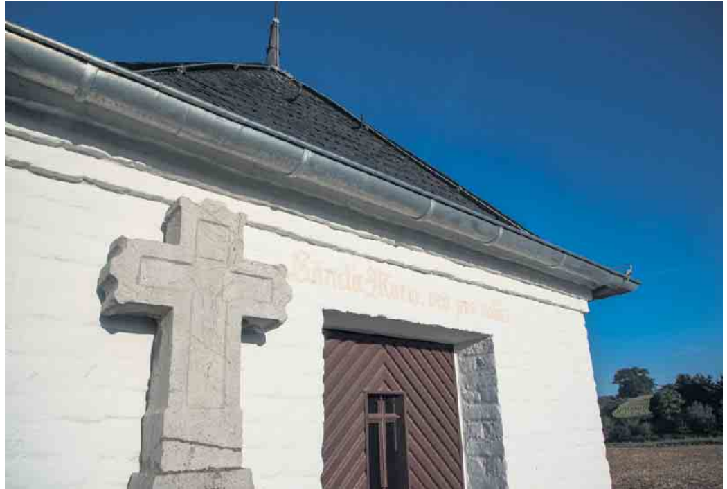
Die Inschrift über der Tür verweist auf die Heilige Maria

Etwas außerhalb von Frankeshoven am Wegesrand steht eine kleine Wegkapelle. Über der Tür liest man die Inschrift „Sancta Maria ora pro nobis“. Im schön ausgekleideten Innenraum steht eine Madonnenfigur, die durch das kleine Fenster in der Tür betrachtet werden kann, das Dach zierte ein kunstgeschmiedetes eisernes Kreuz. Die Denkmalliste des Erftkreises verzeichnet an dieser Stelle eine schon um 1800 errichtete kleine, baufällige Kapelle. Sie wurde 1958 durch einen Neubau unter Verwendung von altem Material ersetzt. Neben dem Eingang findet sich ein steinernes Kreuz, das sicher viel älteren Ursprungs ist, seine Inschrift ist nicht mehr lesbar. Noch vor einigen Jahren war die Kapelle von hohen Bäumen umgeben, die jedoch einem Sturm zum Opfer fielen. Eine Renovierung und Sanierung der Kapelle war notwendig geworden, da sich Schäden am Dach und Feuchtigkeit in einer Wand eingestellt hatten. Die Arbeiten sind inzwischen abgeschlossen. Einmal jährlich machten sich die Mitglieder der Kirchengemeinde St. Simon und Judas Thaddäus