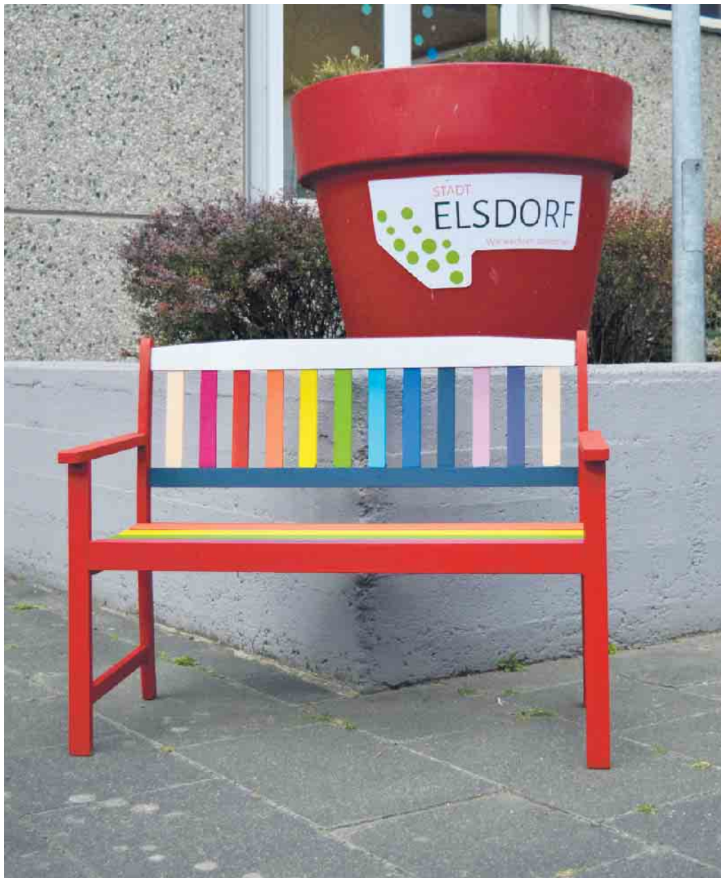
Eine Freundschaftsbank für die Eulenschule

Bei einer einmaligen Aktion soll es nicht bleiben, denn beide wollen sich für eine Ausweitung des Konzeptes einsetzen. „Unser Ziel ist es, dass am Ende auf