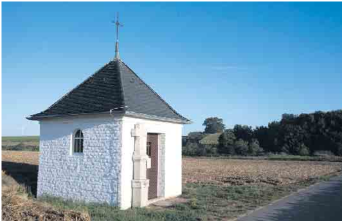
Die Marien-Kapelle in Frankeshoven erstrahlt in neuem Glanz