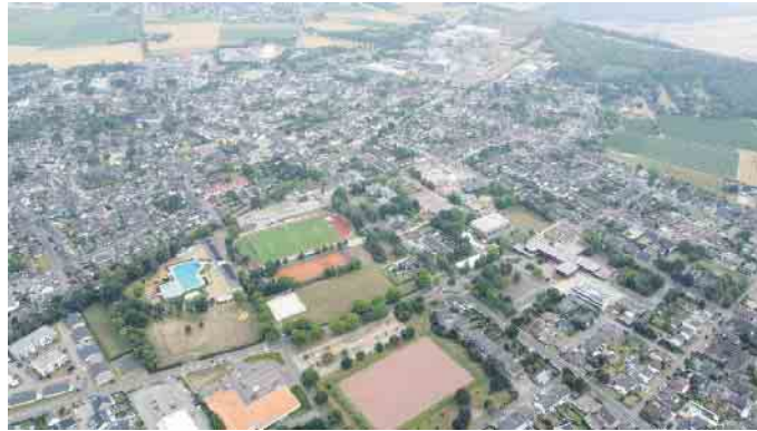
Die Projekte umfassen zwei Ortsteile und das Elsdorfer Zentrum

Für welche Projekte können nun die Planungen beginnen? So soll das Geschäftszentrum an der Köln-Aachener Straße räumlich besser an das REWE-Center angebunden werden. Mit einer effektiven Wegeführung, ansehnlich gestalteten Plätzen und Flächen