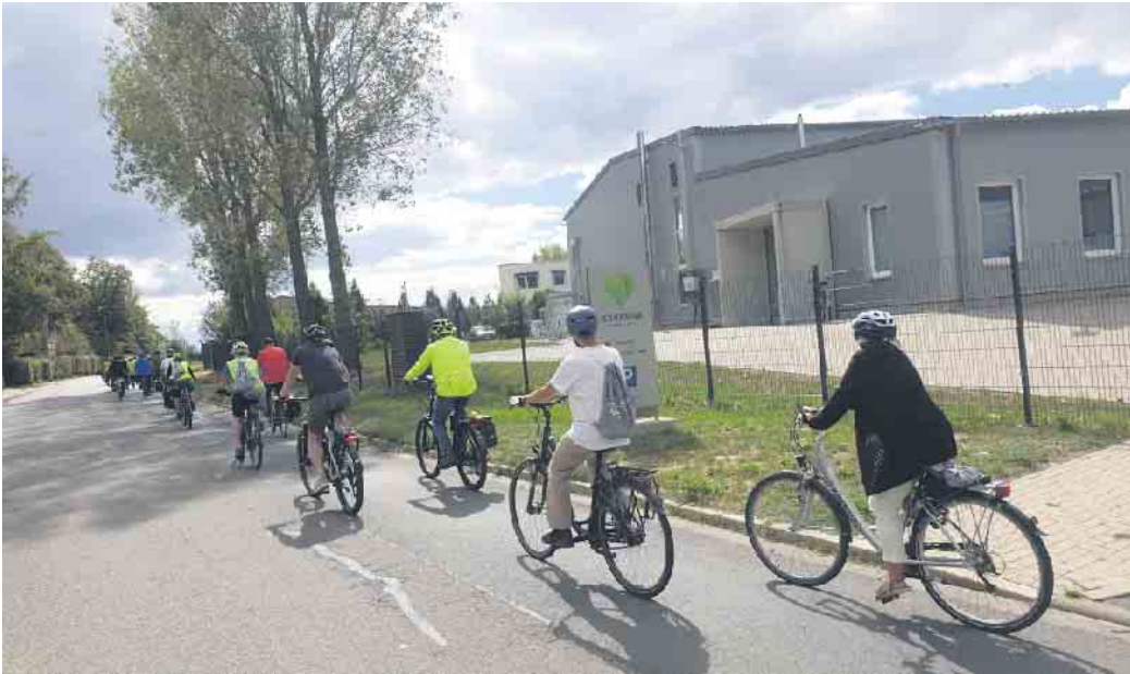
Bei der letzten Fahrradtour fanden sich viele Interessierte ein

Startpunkt der Tour ist um 12 Uhr das Forum :terra nova (Nordrandweg, am Kreisverkehr Richtung Berrendorf, 50189 Elsdorf). Von da aus werden drei Haltepunkte angesteuert, an denen das Team Strukturwandel, das beteiligte Planungsbüro must Städtebau sowie der Tagebaumfeldverbund NEULAND HAMBACH über verschiedene Themen informieren: Direkt zu Beginn geht es um den Masterplan Zukunftsterrassen Elsdorf, der die städtebauliche Entwicklung des insgesamt acht Kilometer langen Tagebaurandbereiches in den nächsten Jahrzehnten wegweisend aufzeigt. Auch die Entwicklungsgesellschaft NEULAND HAMBACH GmbH wird hier über aktuelle Planungen informieren und einen Einblick in den sich derzeit in der Erarbeitung befindlichen Rahmenplan geben. Dann geht es knapp 5 km über