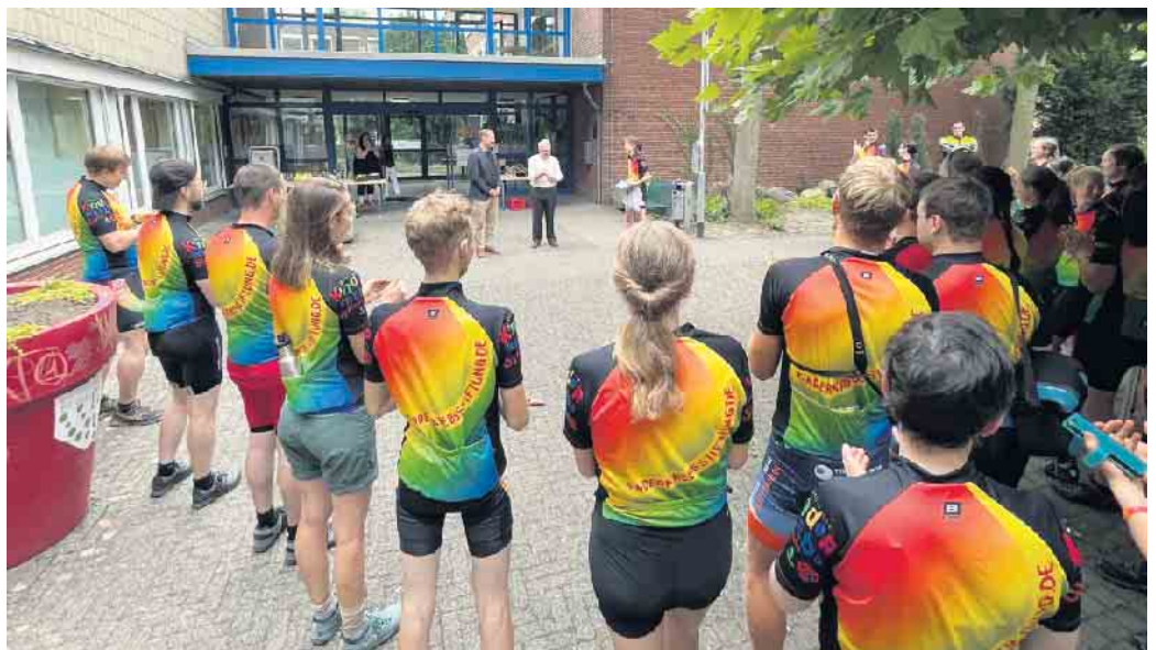
Die Regenbogenfahrer der Deutschen Kinderkrebsstiftung machten Mitte August Station in Elsdorf.

40 Radfahrer in regenbogenfarbenen Leibchen fuhren am Vorplatz des Rathauses ein. Selbst aktiv sein, anderen Krebskranken Mut machen, die Dinge in die Hand nehmen und der Öffentlichkeit zeigen, dass eine Krebserkrankung im Kindes- und Jugendalter überwindbar ist, ist die Intention der Regenbogenfahrt und ihrer Teilnehmer. Seit 1993 machen sich jährlich im August junge Leute aus ganz Deutschland, welche selbst im Kindes- oder Jugendalter eine Krebserkrankung überwunden haben, als Regenbogenfahrer auf den Weg. „Wir besuchen Kliniken und Elterngruppen für krebskranke Kinder und Jugendliche. Mit der Tour wollen wir den Kindern sowie ihren Familien Mut machen und ein hoffnungsvolles Beispiel geben. Neben