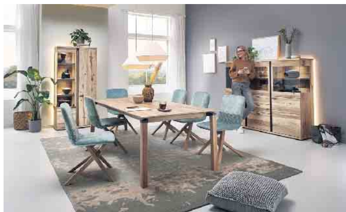
Zeitlos schöne Qualitätsmöbel bereiten ihren Besitzern lange Freude.

Es kommt vor, dass man sich an seiner Einrichtung „satt gesehen“