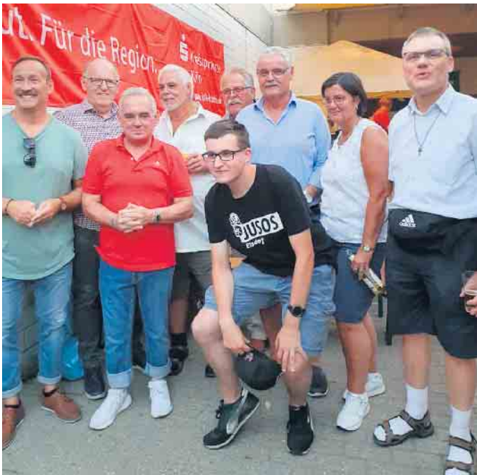
In gemütlicher Runde.

Zum Dorfplatzfest in Esch herrschte eitel Sonnenschein. Zahlreiche Besucher konnte die Dorfgemeinschaft Esch nach zweijähriger pandemiebedingter Pause auf dem Schulhof der Erich-Kästner-Schule begrüßen. Dieses Fest hat mittlerweile Tradition und hat uns sehr gefehlt, lässt die Dorfgemeinschaft wissen. Die Cocktailbar erfreute sich großer Beliebtheit. Hier wurden die Cocktails noch von Hand zubereitet. Da nahm man doch gerne eine kleine Wartezeit in Kauf. Auch vor dem Grill gab es zeitweise eine Warteschlange. Hier wurden neben