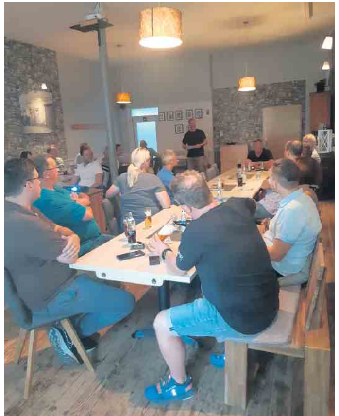
Der Elsdorfer Unternehmer Stammtisch besteht seit 2016 als offenes Netzwerk für alle Interessierten.

stehen hierbei im Fokus. Alle Kriterien und Vergabegrundsätze werden ab September unter www.wirtschaft-elsdorf.de veröffentlicht, so dass alle Interessierten vollumfänglich einen Einblick erhalten können. Desweiteren informierte die Stadtverwaltung über den derzeitigen Glasfaserausbau sowie eine für Frühjahr 2023 geplante Leistungsmesse in Elsdorf. Ebenso referierte ein Experte zur Grundsteuerreform und wesentlichen Aspekten für Unternehmer. Der Elsdorfer Unternehmer Stammtisch ist ein offenes Netzwerk. Interessierten Unternehmer/innen steht die Wirtschaftsförderung der Stadt Elsdorf ( wirtschaftsfoerderung@elsdorf.de oder 02274 709 243) für weitere Fragen zur Verfügung.