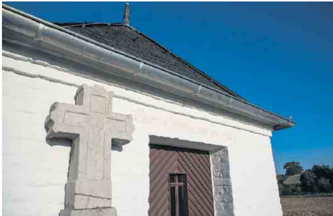
Die Inschrift über der Tür verweist auf die Heilige Maria