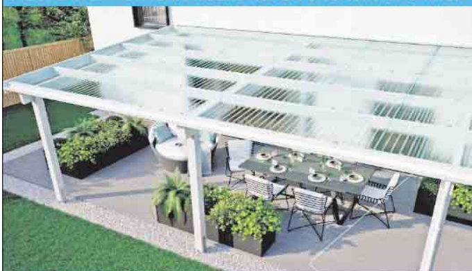
LICHTPLATTEN AUS PC + PMMA + PVC