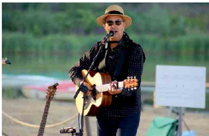
Beim ersten Strandkultur-Konzert des Jahres stand der Eifeltoubadour auf der Bühne unter Palmen

Gladbacher Straße 37-39 • 50189 Elsdorf Telefon 02274 / 905673 • Fax 02274 / 905674