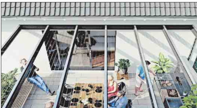
STEGPLATTEN FÜR TERRASSENDÄCHER UND WINTERGÄRTEN

Ein Rundgang vor Reiseantritt durch Wohnung oder Haus ist ebenfalls sinnvoll, um aus Sicherheitsgründen Steckdosenleisten abzuschalten und von nicht genutzten Geräten die Netzstecker zu ziehen. Verbraucherzentrale Nordrhein-Westfalen e.V.