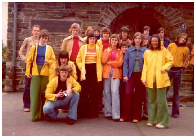
Bei der Abschlussfahrt 1975 nach Ahrweiler