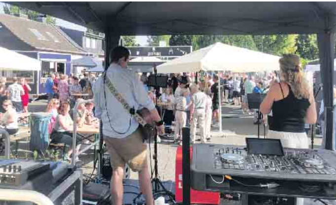
Am 14. August lädt die Stadt Elsdorf zum nächsten Feierabend-Markt in der Stadtmitte ein.