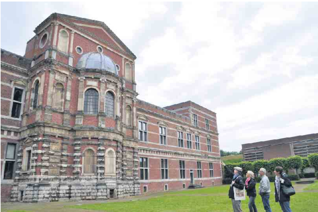
Zitadelle Jülich.

Architektonisches Schmuckstück der Anlage ist die restaurierte Ostfassade des herzoglichen Schlosses. Die zentrale Schlosskapelle ist ein beliebter Veranstaltungsort mit toller Akustik. Im historischen Schlosskeller entfalten Ausstellungen in drei wichtigen Epochen der Geschichte: Die Zeit der Römer, die Jülich vor über 2000 Jahren gegründet haben, die Renaissance, in der Schloss und Festung gebaut wurden und die Romantik, das 19. Jahrhundert in