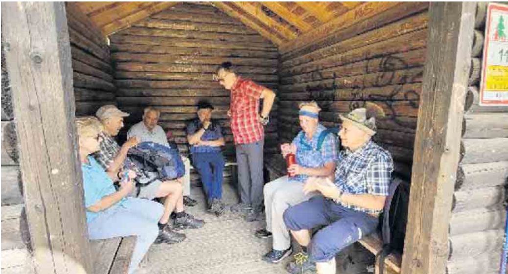
21. Juli: Rund um die Kalltalsperre