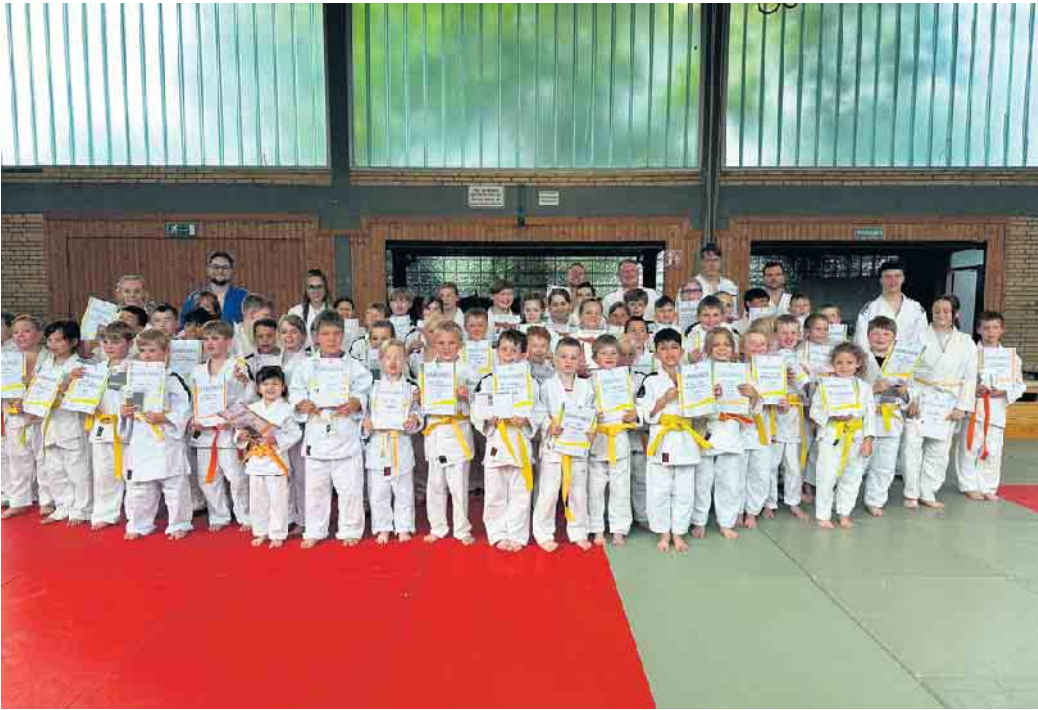
Alle jungen Judokas haben erfolgreich ihre Prüfung abgelegt

Beim Abschlusstraining am Freitag, 5. Juli, stand für unsere Judokas eine letzte große Herausforderung an: die Gürtelprüfung zur nächsthöheren Graduierung. Egal, ob groß oder klein, Kinder- oder Erwachsenen-gruppe - alle Trainingsgruppen und insgesamt 62 Judoka hatten sich an diesem Tage um 16.30 Uhr versammelt, um eine erfolgreiche Prüfung zu absolvieren. Von der Prüfung zum weiß-gelben bis hin zum grünen Gürtel war alles vertreten. Die anfängliche Nervosität verschwand geschwind, als die Judomatte betreten wurde und das Aufwärmen und Wiederholen begann. Bei insgesamt fünf unterschiedlichen Prüfungskommissionen durften die Judoka ihr Können unter Beweis stellen. Dank einer langen und intensiven Vorbereitungszeit stellte jedoch das Prüfungsprogramm keinerlei