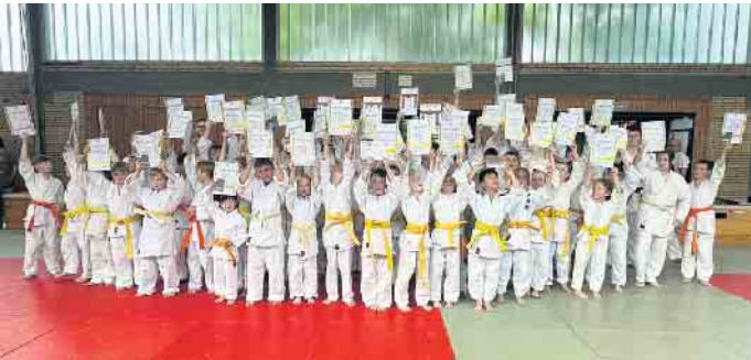
Alle jungen Judokas mit ihren Urkunden

Abdouni bestanden alle Teilnehmer, sodass am Ende die Urkunde für den neuen Gürtel überreicht, der Judopass zurückgegeben und der neue Gürtel mit neuer Gürtelfarbe angezogen werden konnte. Die Trainer der Judoabteilung der ASG Elsdorf sagen: Herzlichen Glückwunsch! Wir sind stolz, eine solch große Menge strahlender Gesichter in die wohlverdienten Ferien zu schicken und wünschen eine wohlverdiente Erholungs-pause!