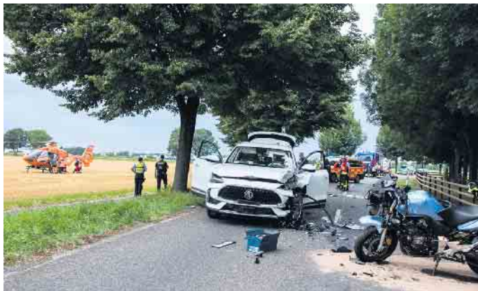
Beide Fahrzeuge wurden beim Zusammenprall erheblich beschädigt

Motoradfahrer mit Rettungshubschrauber in Klinik gebracht