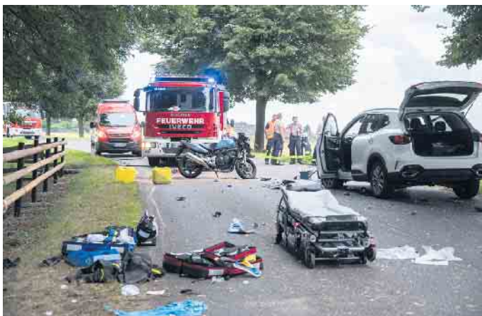
Der Motorradfahrer wurde am Unfallort erstversorgt und dann mit dem Rettungshubschrauber in eine Klinik gebracht

Am vergangenen Samstagabend gegen 18.30 Uhr prallte ein aus Richtung Grouven kommender Motorradfahrer auf dem Brockendorfer Weg in Höhe Gut Brockendorf mit einem PKW zusammen, der aus Richtung der