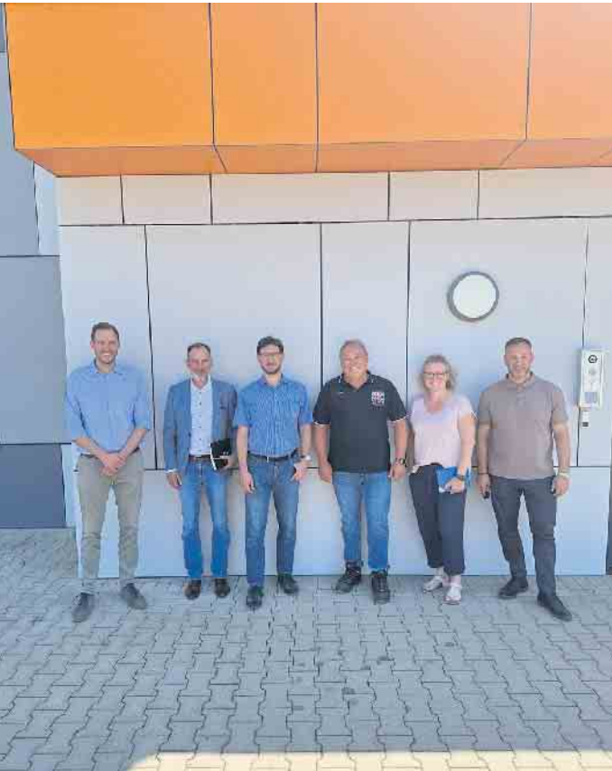
Seit vier Jahren ist der Thyssengas-Standort in Elsdorf in Betrieb - zum Unternehmensbesuch waren Vertreter aus dem Rathaus vor Ort..

Elsdorf: Thyssengas-Standort liefert täglich wichtigen Beitrag zur Versorgungssicherheit der Region