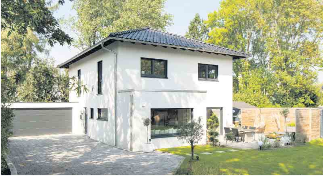
Die hohe Energieeffizienz moderner Holz-Fertighäuser hilft der Umwelt und spart Energiekosten.

In Deutschland werden immer mehr Häuser in Fertigbauweise errichtet. Bundesweit ist fast je-