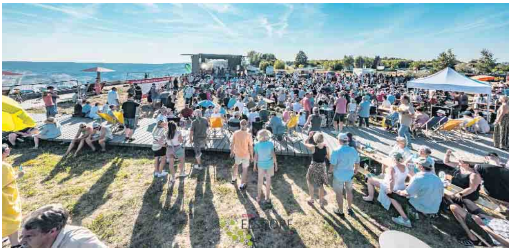
Konzertfotografie