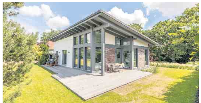
Fertighäuser werden nach den individuellen Wünschen und Bedürfnissen des Bauherrn geplant - vom kompakten Bungalow bis hin zur großen Stadtvilla.

50189 Elsdorf Oststraße 16-18 02274 - 81 998 www.mathar-wetzel.de