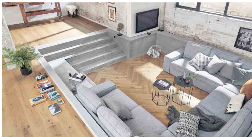
Ein Parkettboden ist auch 2022 moderner denn je.

Gesund, langlebig, nachhaltig - die Vorteile von Holzfußböden machen deutlich, wie sehr es sich lohnt, auch im Jahr 2022 auf das Naturprodukt zu setzen. „Entscheidet man sich für einen Parkettboden, sind einem nicht nur die vielen ästhetischen Vorteile von echtem Holz sicher“, betont Schmid abschließend. „Mit der Wahl für Parkett tut man sowohl etwas für sein persönliches Wohlbefinden als auch nachhaltig etwas für die Umwelt. Was könnte noch moderner sein?“ (vdp/fs)