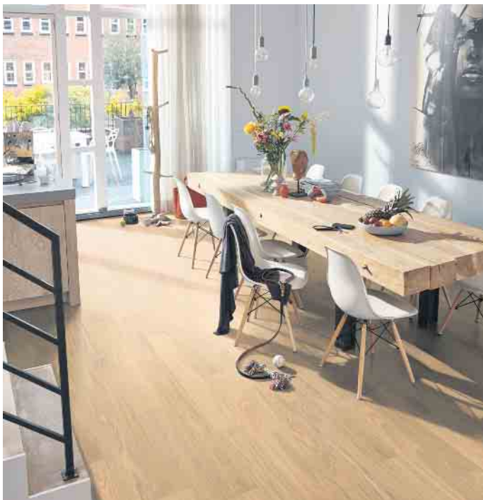
Formschön, nachhaltig und gesund - für Parkett spricht vieles.