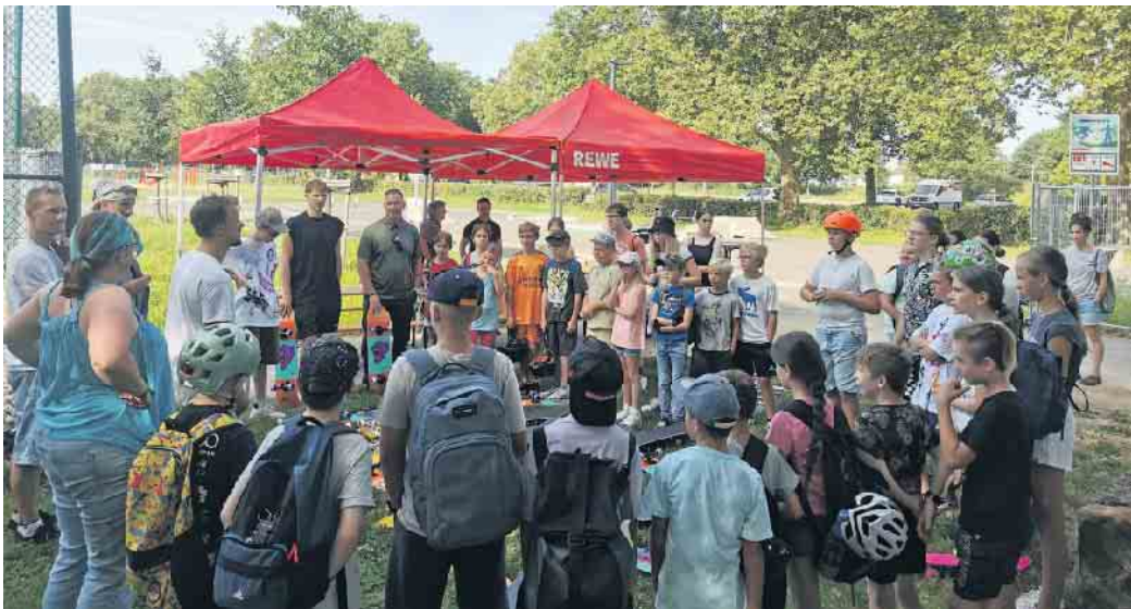
Skate-Profis vermitteln den Kindern und Jugendlichen altersgerecht technischen Grundlagen des Skateboardfahrens.