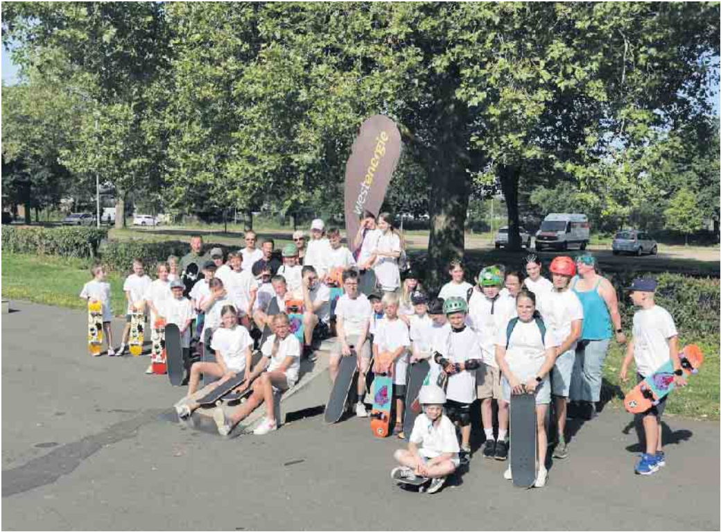
Bereits im Vorjahr sorgte der Workshop für spannende Ferientage in Elsdorf.

Der Westenergie Skateboardworkshop unterstützt die Bewegungsförderung nachhaltig, denn alle Teilnehmenden dürfen nach den zwei Tagen das zur Verfügung gestellte Board behalten und damit weiter an dem Gelernten arbeiten. Eine super Erinnerung, die gleichzeitig dazu motiviert, den Sport weiter zu verfolgen. Der Workshop findet an der Skateranlage im Sport- & Bewegungspark an der Ohndorfer Straße statt. Die Teilnahme ist für alle kostenfrei, die Verpflegung der angehenden Skater*innen, die Boards, die notwendige Schutzausrüstung und auch eine