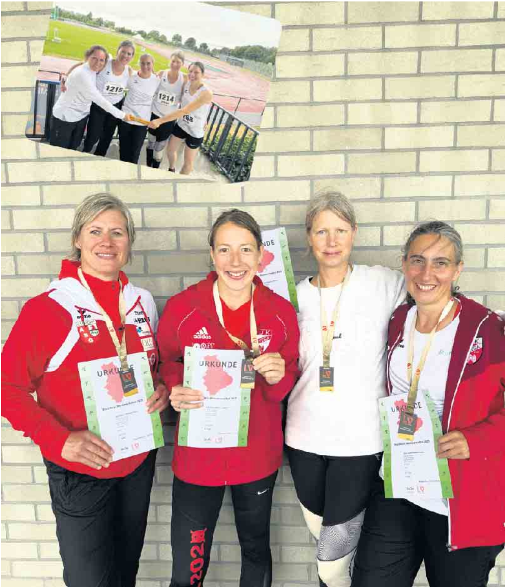
Staffel der StG Elsdorf - Novesia Neuss.

Trotz starker Konkurrenz und widriger Witterungsbedingungen - mit Windböen, Regen und Wasser im Diskusring - bewiesen die Elsdorferinnen Nervenstärke und Teamgeist. Die enge sportliche Freundschaft mit den Neusser Staffelpartnerinnen trug ebenfalls zum erfolgreichen Auftritt bei. Insgesamt gingen sieben Medaillen an die ASG Elsdorf , darunter zwei Titel - eine Bilanz, die sich sehen lassen kann.