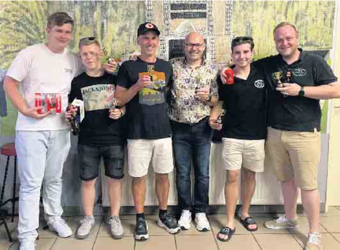
Die Bierpong Sieger „Keine Namen“ (Mitte) vor „Holdes Grün“ (rechts) und Team „Gaffel“ (links)

Schützenfest in Giesendorf mit abwechslungsreichem Programm