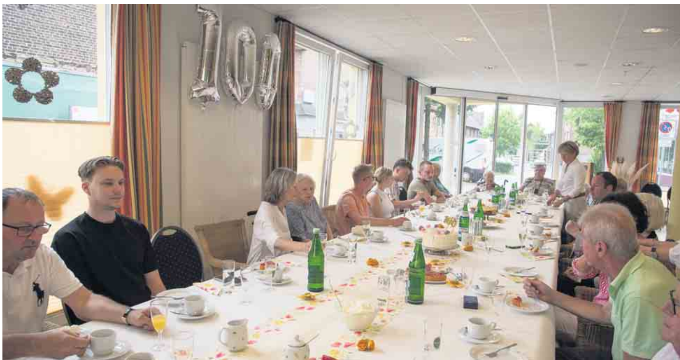
Zahlreiche Gäste fanden sich an einer großen Geburtstags-Kaffeetafel ein

Hobby, viele Priestergewänder hat sie bestickt in ihrer Zeit im Müt- terverein. Friedfertig sein und mit niemandem Krach anfangen, das sei ihre Devise gewesen, viele schöne Erinnerungen an ihre Zeit in Berrendorf genießt sie jetzt. (mos)