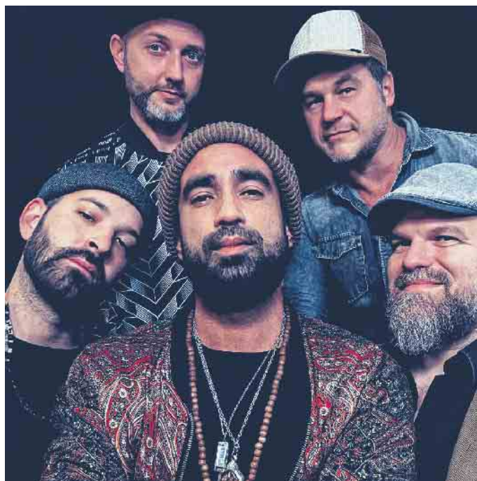
Die Bob Marley Tribute-Band „Marley's Ghost“ eröffnet am 13. Juli die sechswöchige Konzertreihe.