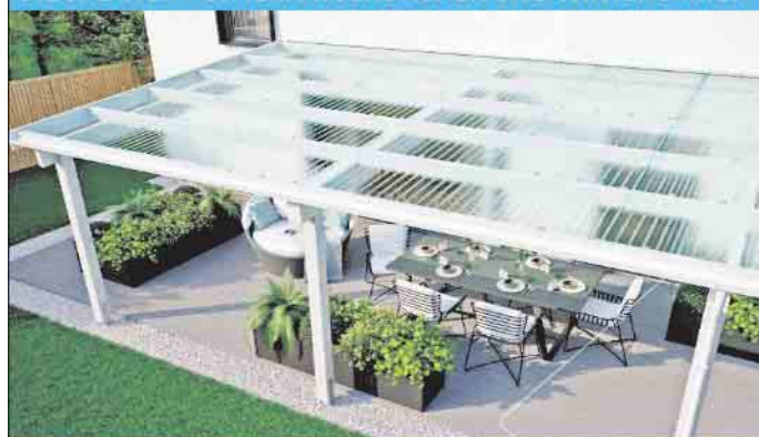
LICHTPLATTEN AUS PC + PMMA + PVC