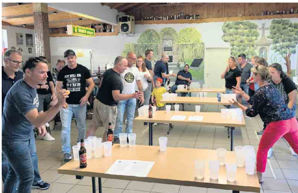
Am 4. Juli wird in Giesendorf Bierpong gespielt.

Haben Sie Anteil am Dorfleben in Giesendorf und kommen Sie vorbei, die Schützen freuen sich über Ihren Besuch!