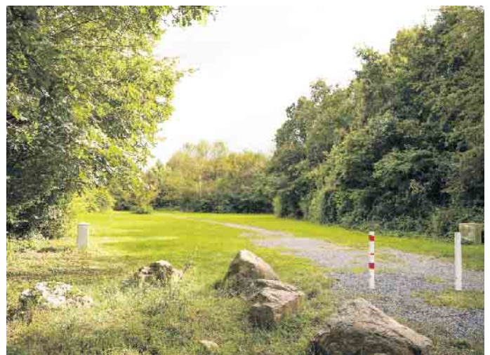
Der gut frequentierte und beliebte Bereich an der sog. „Kaninhütte“ in Elsdorf soll zukünftig u.a. mit verbesserter Wegeführung und Aufenthaltsqualität aufgewertet werden.

Konkret setzt sich die Verwaltung aktuell für eine Förderung zur Aufwertung der sog. „Kaninhütte“ (am Ortsausgang Köln-Aachener Straße) ein. Elsdorf setzt auf einen pragmatischen Umgang mit Klimathemen - mit klaren Zielen und realistischen Schritten für eine nachhaltige und lebenswerte Stadt.