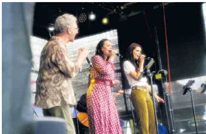
Am 27. Juli steht älterer und auch moderner deutscher Schlager im Mittelpunkt des musikalischen Geschehens am Forum:terra nova.

Weitere Informationen finden Sie im „Musik mit Aussicht“-Programmheft unter www.elsdorf.de sowie in der Elsdorf-App.