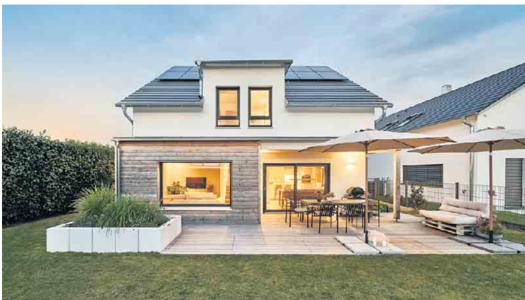
Die Terrasse ist ein erweiterter Wohnbereich für schöne Sommertage und laue Sommernächte.

Mit Weitblick bei der Terrassenplanung entsteht ein erweiterter Wohnraum, der zu den Lebensgewohnheiten passt. Die Vorteile des Fertighausbaus kommen hier voll zum Tragen.