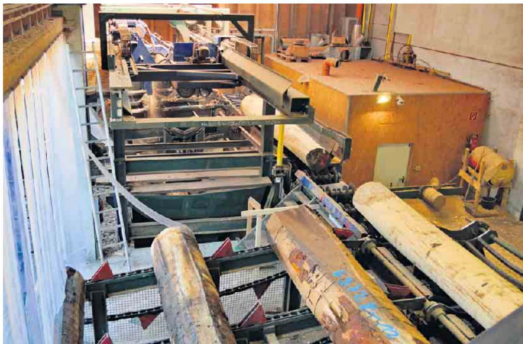
Furnierbäume bei der Verarbeitung.

Zülpich. Mit Furnier lassen sich kreative und individuelle Projekte aller Art verwirklichen. Die Basis dafür bilden speziell ausgesuchte Bäume, die mit viel Know-how zu dem edlen und natürlichen Material verarbeitet werden. Nur sehr wenige der gut 40.000 auf der Erde vorkommenden Holzarten lassen sich zu hochwertigem Furnier verarbeiten. „Rund 140 Arten kommen für die Herstellung in Frage und innerhalb dieser Arten gibt es nur wenige Exemplare, die mit innerer Schönheit punkten und sich damit für die Produktion von Furnieren eignen“, so der Forstwirt und Vorsitzende der Initiative Furnier + Natur (IFN), Axel Groh. Notwendig ist unter anderem ein ebenermäßiger Wuchs und der Stamm muss für eine perfekte Verarbeitung möglichst rund und kerzengerade sein. „Auch ein gleichmäßiges