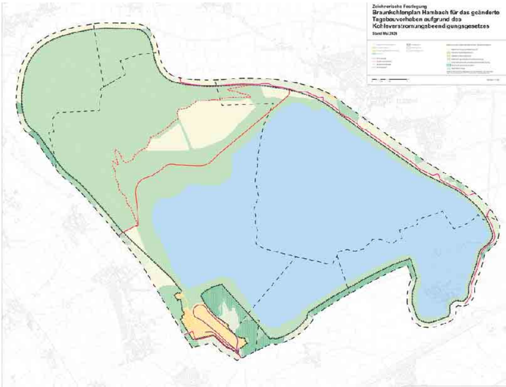
Der formale Rahmen für die Entwicklung der Tagebaufolgelandschaft Hambach mit Blick auf den vorgezogenen Kohleausstieg wurde geschaffen.

Aufgrund des um acht Jahre vorgezogenen Kohleausstiegs musste das Braunkohlenplanänderungsverfahren für den Tagebau Hambach erheblich verkürzt werden. „Ein Planverfahren kann normalerweise zehn Jahre oder länger dauern. Dass wir jetzt innerhalb von nur drei Jahren einen neuen Braunkohlenplan vorlegen konnten, zeigt, dass alle Akteure vor Ort sehr ernsthaft den vorgezogenen Kohleausstieg ermöglichen haben. Viele unserer im Rahmenplan Hambach beschriebenen Ziele, wie die frühzeitige Inwertsetzung des Sees oder ökologische Vorrangzonen in den oberen Uferbereichen, wurden nahezu wörtlich übernommen. Auch unsere Vorschläge für die Entwicklung von Nutzungsschwerpunkten sowie für die See- und Wasserzugänge sind in den Erläuterungskarten zum zeichnerischen Entwurf des neuen Braunkohlenplans enthalten“, erläutert Boris Linden, Geschäftsführer der NEULAND HAMBACH GmbH. Der Braunkohlenausschuss hat außerdem die Bildung einer Koordinierungsgruppe beschlossen, um die Umsetzung der im Braunkohlenplan und im Rahmenplan der Neuland Hambach angelegten Projekte in den weiteren Plan- und Zulassungsverfahren zu begleiten und deren Fortschritt zu überwachen. In dem heutigen Be-