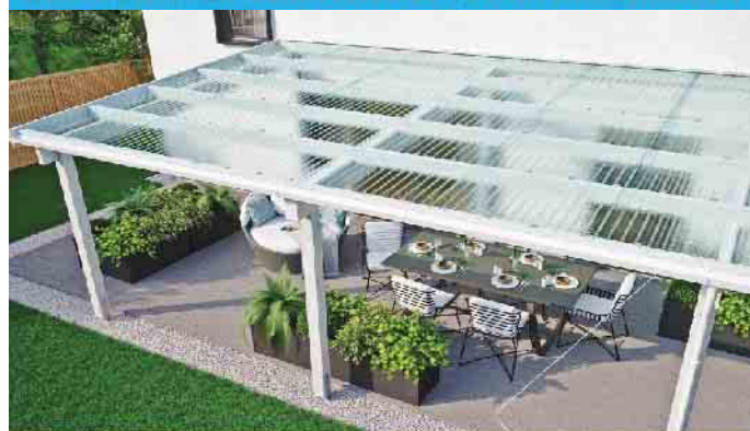
LICHTPLATTEN AUS PC + PMMA + PVC