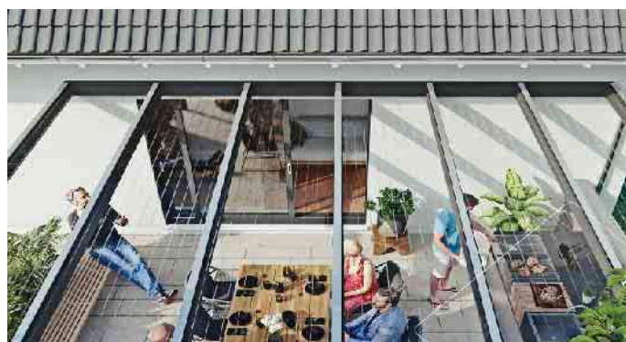
STEGPLATTEN FÜR TERRASSENDÄCHER UND WINTERGÄRTEN

Einhebelmischer am Waschtisch oder in der Dusche eignen sich gut zum Energiesparen, da hier die gewünschte Temperatur zügiger eingestellt werden kann als mit Zweigriffarmaturen.