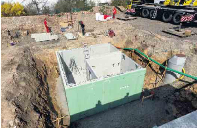
6,50 mal 6,50 Meter Baugrube reichen für einen kompakten Teilkeller meist schon aus.