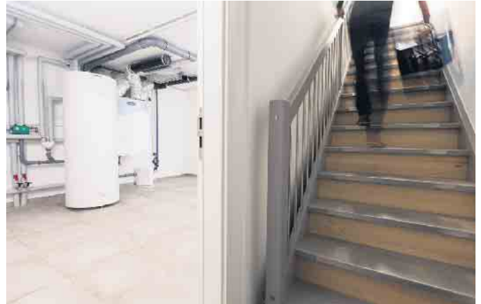
Ein kleiner Keller kann die oberen Stockwerke gut und effizient entlasten.

Heizungsanlage, Sicherungskasten, Warmwasserspeicher, Automations- und Lüftungssystem - diese und weitere technische Anlagen im Haus nehmen heute schnell zehn Quadratmeter und mehr ein. Das ist Fläche, die vor dem Hausbau irgendwo im Grundriss mit