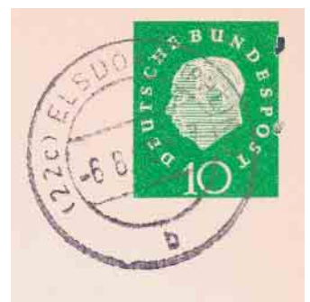
Eine Briefmarke mit Poststempel aus dem Jahr 1960

Auf Dauer erwies sich das System als zu grobmaschig. Die Bundespost schuf deshalb die ortsbezogene vierstellige Postleitzahl und setzte sie am 23. März 1962 in Dienst. Elsdorf erhielt die Zahl 5153, allerdings