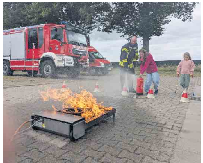
Feuerlöschen übten die Kinder an der Feuerwache