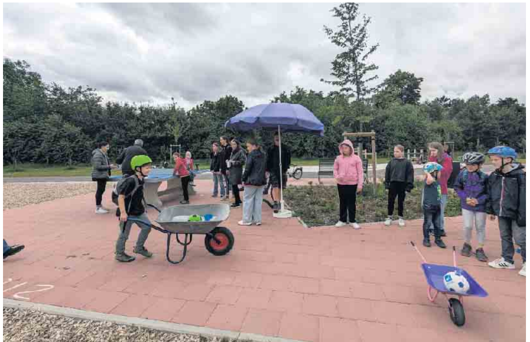
Schubkarrenparcours auf dem Generationenpark

Die Bücherei wurde besucht, Eierlauf war gefragt, Tiere in einem Vorgarten mussten gezählt und