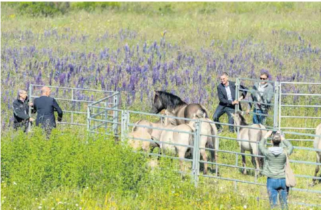
Sieben Konikpferde erweitern nun die Artenvielfalt auf der Sophienhöhe.

Die sogenannten Koniks (polnisch für „kleines Pferd“) sind die Hauptakteure eines Pilotprojekts der Stiftung FREE Nature, des Verbands Neuland Hambach und der Forschungsstelle Rekultivierung. Zur Herde gehören aktuell ein Hengst, drei Stuten, zwei Jährlinge und ein Fohlen. Die robuste Rasse ist fast mit dem bekannten Dülmener Wildpferd identisch. Die Tiere sind bis zur Schulter maximal 1,45 Meter hoch, haben ein