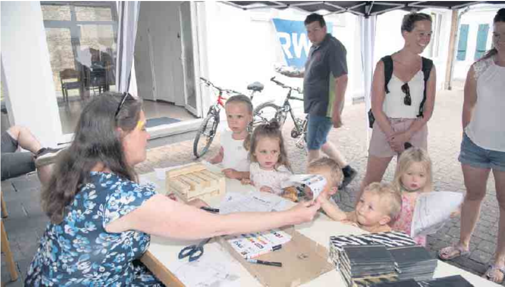
Verdiente Belohnung: Buntstifte, Malbücher, und eine Urkunde