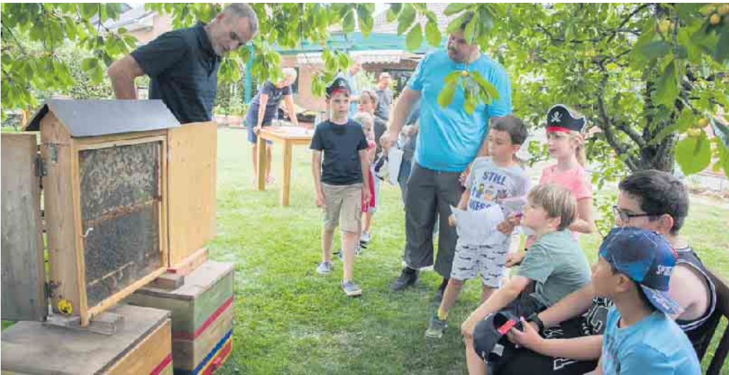
Interessiert schauten die Kinder auf den gläsernen Bienenstock und beantworteten hinterher Fragen hierzu