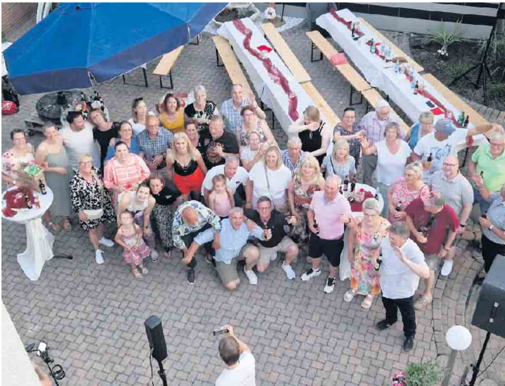
Alle Anwesenden sorgten für beste Stimmung

Nur eines störte die Anwesenden bei Temperaturen über 30 Grad: „Baden verboten“ beim Seefest.