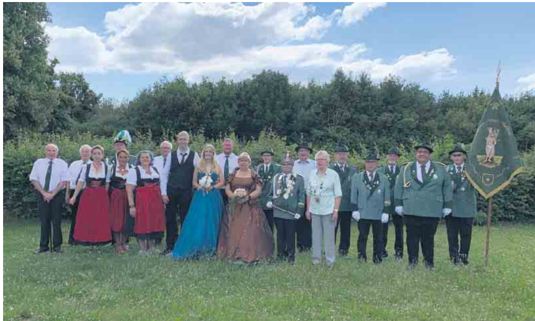
Die Schützen aus Giesendorf freuen sich auf ihr Schützenfest

Im Anschluss erfolgt eine Kranzniederlegung am Ehrenmal, und um 19:30 Uhr beginnt für alle der Fest- und Königsball im Schützenhaus mit DJ Tom Stroh.