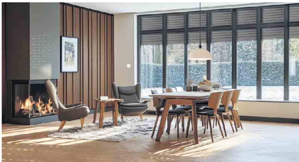
Trend 1: Große bodengebundene Fenster lassen viel Tageslicht herein. Und sparen im Winter viel Heizenergie.

Dieser Trend hält seit Jahren an: Neue Fenster werden immer größer - und vereinen Hebe-Schiebetüren sowie bodengebundene Fenster und Türen. VFF-Geschäftsführer Frank Lange erklärt: „Der Trend zu größeren Fensterflächen spiegelt den Wunsch der Menschen nach Helligkeit, Weite und Ausblick wider. Wir halten uns heutzutage viel mehr in Innenräumen auf als früher. Dementsprechend möchten die Menschen möglichst viel Tageslicht in ihre eigenen vier Wände holen. Das erzeugt ein Gefühl von Offenheit und Verbindung zur Außenwelt.“ Möglich macht dies der technische Fortschritt: Moderne Fenster sind energetisch hoch effizient, so dass selbst über größere Glasflächen nur unwesentlich an Wärme verloren geht. Scheint die Sonne darauf, erwärmen diese Fenster sogar an kalten Tagen den Innenraum - ein Beitrag zur Energie- und Kostenersparnis. Für den Sommer sind Sonnenschutzverglasungen, Markisen, Rollläden oder Außenjalousien bei großen Fenstern aber besonders wichtig. Sie