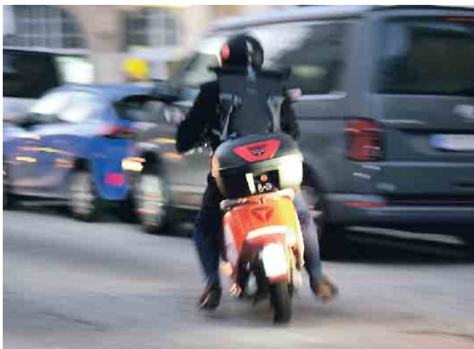
Kurvenfahren sollte man auf den Roller schon können.

Verstopfte Straße, stehende S-Bahn, und die U-Bahn kommt nicht. Da kann ein Roller helfen. Das passende Fahrzeug ist schnell gefunden: Wo der nächste Scooter steht, weiß das Handy; gebucht und bezahlt wird auch damit.