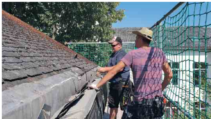
Verklammerung und Befestigung der Dachziegel bzw. -platten werden beim DachCheck geprüft.

Der Zentralverband des Deutschen Dachdeckerhandwerks (ZVDH) rät daher allen Hausbesitzern und Hausverwaltungen, nach dem Winter das Dach und seine Bauteile überprüfen zu lassen. Nur so können mögliche Schäden rechtzeitig behoben werden. Im Rahmen eines DachChecks wird das gesamte Dach einer gründlichen Sichtprüfung unterzogen. Dabei erkennen erfahrene Dachdecker-Innungsbetriebe Schwachstellen bereits durch eine