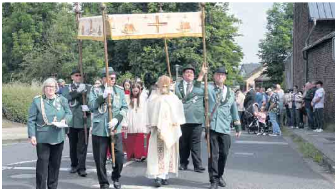
Zahlreiche Gläubige reihten sich hinter dem Allerheiligsten ein bei der Prozession durch den Ort.