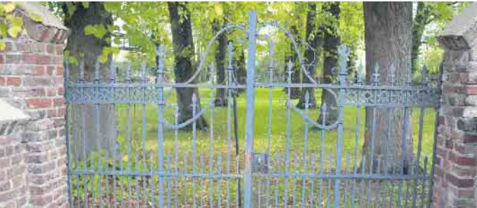
Das Tor des Elsdorfer Judenfriedhofes

Eine Geschichte des Jüdischen Friedhofes in Elsdorf