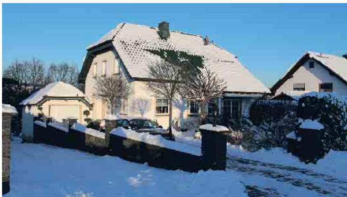
Dächer werden durch vielfältige Witterungen und Temperaturunterschiede beansprucht. Ein regelmäßiger Check sorgt für Sicherheit.

Vor der Montage einer Photovoltaikanlagen müssen Hausbesitzer den Zustand ihres Daches prüfen lassen. Aber auch Dächer ohne weitere Aufbauten sollten regelmäßig gecheckt werden. Dächer werden durch starke Temperaturunterschiede, Stürme und heftige Regen- und Hagelschauer stark beansprucht. Dabei können unbemerkt Schäden entstehen, durch die sich im schlimmsten Fall beim nächsten Sturm Ziegel, Dachsteine oder Schiefer vom Dach lösen. Eigentümer haften für Schäden, die Passanten oder parkenden Fahrzeugen durch herunterfallende Bauteile zugefügt werden. Wichtig zu wissen: Versicherungen übernehmen diese Schäden nur, wenn eine regelmäßige Dachwartung durch einen Fachbetrieb belegt werden