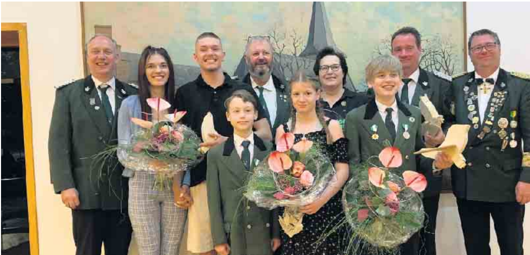
Gruppenbild aller neuen Heppendorfer Majestäten