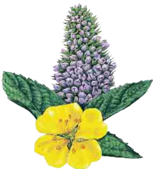
Blutwurz und Minze.

Seniorenbeirat der Stadt Elsdorf Gladbacher Str. 111, 50189 Elsdorf Friedhelm Vieth, Tel. 0174 / 541 74 84 seniorenbeirat@elsdorf.de