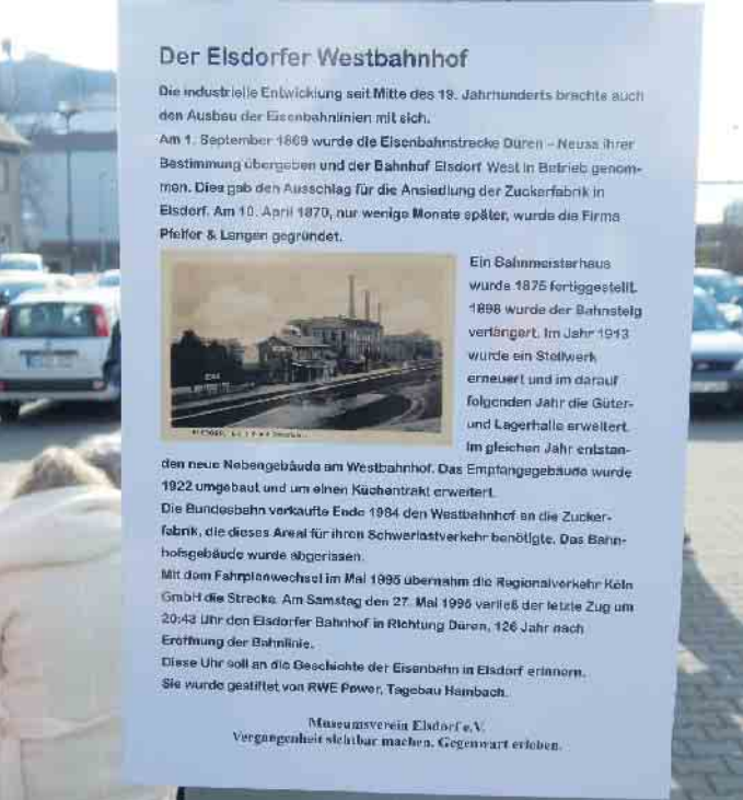
Eine Informationstafel am Mast der Bahnhofsuhr erinnert an die 126-jährige Eisenbahngeschichte in Elsdorf.