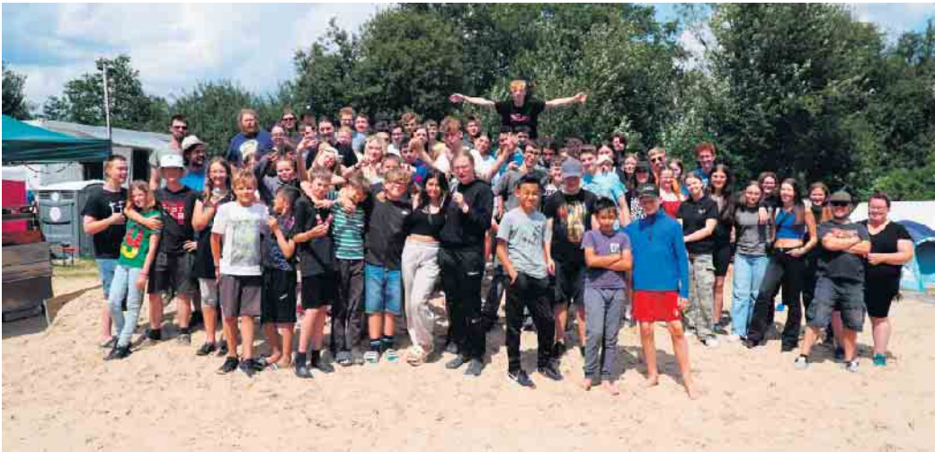
Ab dem 7. Juli öffnet die Offene Zeltstadt - seit 40 Jahren beliebt und erfolgreich - für fünf Wochen ihre Tore.

Vom 7. Juli bis zum 9. August findet zum 40. Mal die Zeltstadt in Bergheim/Paffendorf statt. Die Zeltstadt bietet ein vielfältiges Programm aus Musik, Kunst, Sport, Spiel und Spaß, das von den Teilnehmer*innen selbst mitgestaltet werden kann. Mit insgesamt fünf Projekten für jedes Alter wird ein abwechslungsreiches Programm in den Sommerferien geboten. Alle Infos sowie die Anmeldung finden sich auf www.woanders.org/zeltstadt . Ganz herzlich lädt die Zeltstadt auch zum „Tag des offenen Platztes“ am 7. Juli ab 18 Uhr ein. Die Teilnahme ist ohne Anmeldung und kostenfrei möglich. Freuen Sie sich auf stimmungsvolle Livemusik, gekühlte Getränke und leckeres Grillgut. Es werden verschiedene Programmpunkte angeboten, um einen Einblick in das bunte Treiben auf dem Platz zu ermöglichen. Die Projekte der Zeltstadt 2024: