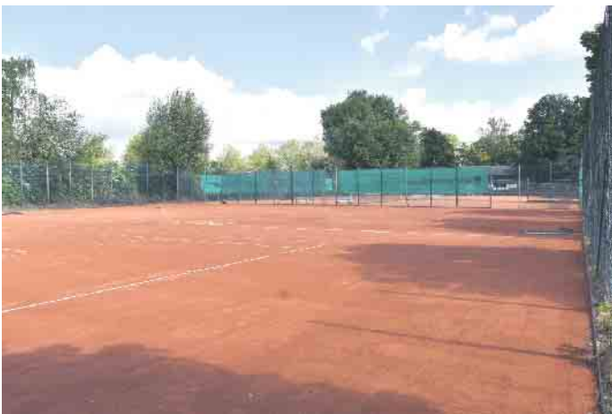
Das Areal des vierten Platzes und der Ballwand wurde zwischenzeitlich abgetragen, so dass auf der gleichen Fläche pünktlich zum Start der Sommersaison zwei neue Plätze entstanden sind.

Neben den Kursprogrammen erfährt aber auch die Tennisabteilung des Vereins eine wichtige Erweiterung. Bislang verfügte die Tennisanlage über vier Plätze ohne Flutlichtbeleuchtung. Das Areal des vierten Platzes und der Ballwand wurde zwischenzeitlich abgetragen, so dass auf der gleichen Fläche pünktlich zum Start der Sommersaison zwei neue Plätze entstanden sind und somit die Kapazität der Anlage auf fünf Tennisplätze wächst. Während der Sommerferien werden die ersten beiden Plätze mit einer neuen Flutlichtanlage ausgestattet, so dass auch Spiele zu späteren Stunden möglich sein werden. Aufgrund schon jetzt wachsender Mitglie-