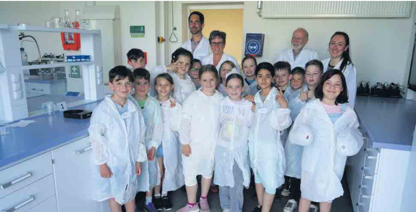
Im Schülerlabor des Elsdorfer „Pfeifer&Langen“-Werks gab es für die Drittklässler der „Eine-Welt-Schule“ viel zu entdecken.

Elsdorf: Im Schülerlabor von Pfeifer & Langen gab es viel zu entdecken