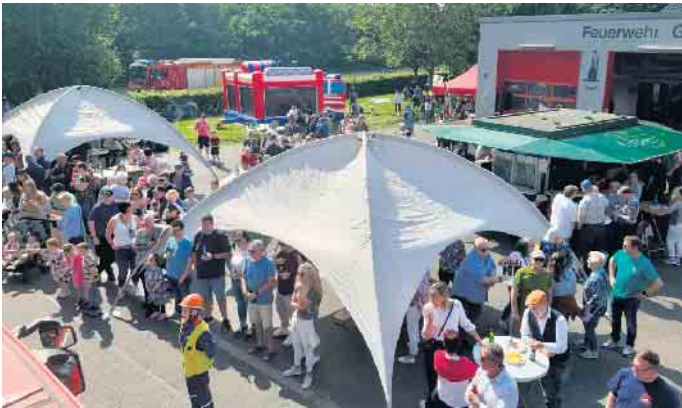
Viele Angebote rund um das Gerätehaus Giesendorf

Am 29. Mai - Vatertag bzw. Christi Himmelfahrt - lädt die Feuerwehr Giesendorf ab 11 Uhr wieder herzlich ein zum Tag der offenen Tür rund um das Gerätehaus in der Etzweilerstraße 98. Ob als Zwischenstopp bei der Vattertags-Tour oder als Ausflugsziel für die ganze Familie - wie immer gibt es viele Angebote und kulinarische Spezialitäten zu entdecken. Um 12 Uhr öffnet der Grill mit dem beliebten Gyros, und ab 14 Uhr gibt es eine große Cafeteria. Für kühle Getränke ist ebenfalls gesorgt, zum Beispiel kann man am Stand von Winzer Thielen-Schunk die aktuellen Weine probieren. Die Aufgaben der Freiwilligen Feuerwehr werden am Infostand vorgestellt und Fahrzeuge und Technik präsentiert. Auch das Thema Brandschutz wird den Besuchern näher gebracht. In diesem Jahr ist sogar eine Überraschung bei