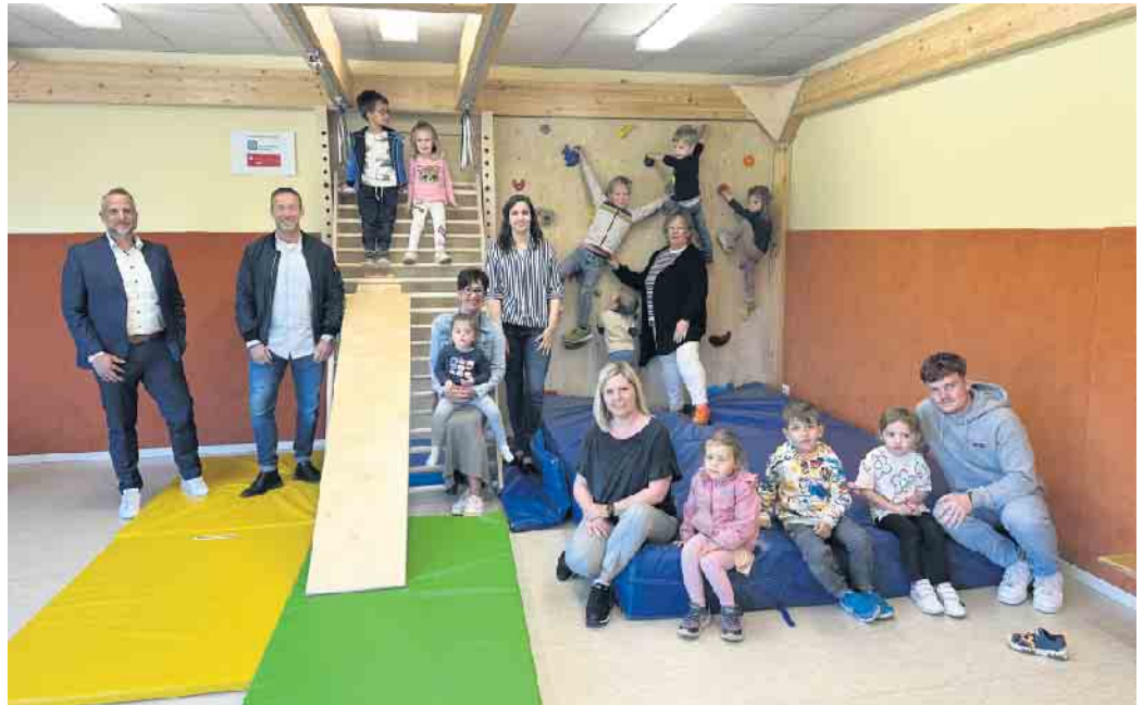
Das Motorikzentrum im Familienzentrum Haus der kleinen und großen Leute wurde erweitert.