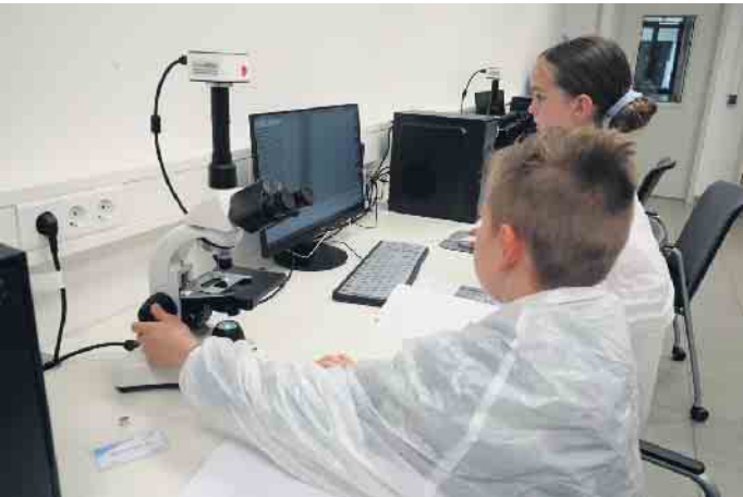
Interessiert und neugierig nutzen die kleinen Forscher das Labor im Pfeifer&Langen-Werk.

Wie sieht ein Zuckerkristall eigentlich aus nächster Nähe aus? Gibt es Lebewesen im Wasser aus der Blumenvase? Schülerinnen und Schüler der Eine-Welt-Schule können diese Fragen nun beantworten. Im Schülerlabor des Elsdorfer „Pfeifer & Langen“-Werks haben sie in Eigenregie nach Antworten gesucht. Zunächst stand für die 16 Kinder aus der dritten Klasse Digitalmikroskopie auf dem Programm. Mit einem Mikroskop untersuchten sie vielfach vergrößerte Zuckerkristalle. „Zuckerkristalle und