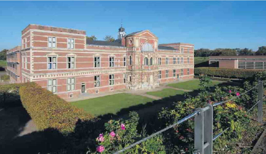
Ostfassade des herzoglichen Schlosses

Von 11 bis 17 Uhr im Museum Zitadelle Jülich