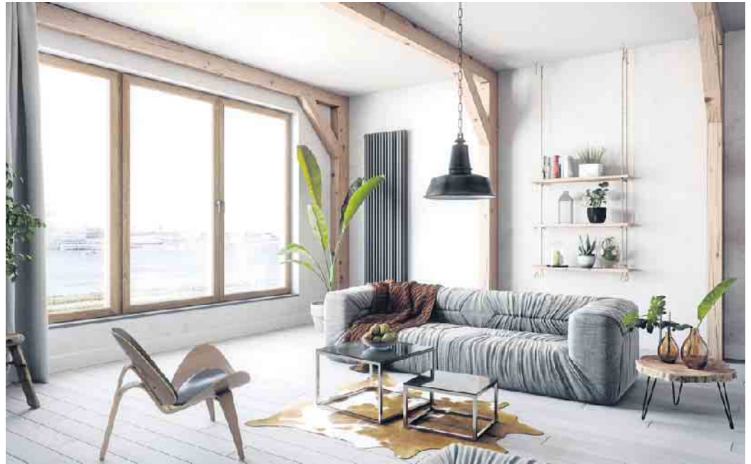
Eine energetisch optimierte Gebäudehülle mit Wärmedämmglas reduziert den Heizbedarf und auch die sommerliche Kühllast jedes Gebäudes.

Wer plant, sein Gebäude mit einer Wärmepumpe und Fotovoltaik nachhaltig mit Wärme, Kühlung und Strom zu versorgen, denkt umweltbewusst und wirtschaftlich. Vor der Wahl der passenden Wärmepumpe sollte jedoch die Dämmung der Gebäudehülle überprüft und optimiert werden, insbesondere durch den Austausch technischer veralteter Isolierverglasungen gegen modernes Wärmedämmglas. Dieser ist eine wirtschaftliche Alternative zum Tausch der kompletten Fenster, falls die Rahmen und Profile noch gut erhalten sind. „So wird der Energie- und Heizwärmebedarf insgesamt verringert und anschließend kann eine Wärmepumpe gewählt werden, die exakt auf den winterlichen Wärme- und sommerlichen Kühlbedarf des Gebäudes abgestimmt ist“, erläutert Jochen Grönegras, Hauptgeschäftsführer des Bundesverbandes Flachglas e.V. (BF). Erst dämmen, dann die richtige Wärmepumpe wählen - diesen Ratschlag gibt der Bundesverband Flachglas Sanieren für mehr Nachhaltigkeit und Effizienz. Denn eine energetisch optimierte Gebäudehülle reduziert den Heizbedarf und auch die sommerliche Kühllast jedes Gebäudes.