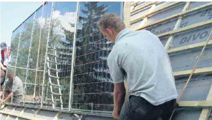
Photovoltaik: Dachdecker wissen, was zu tun ist. Redaktion Harald Friedrich/akz-o

Arbeitsschutz und Arbeitssicherheit Bei Arbeiten auf Dächern besteht auch immer die Gefahr abzustürzen. Dachdecker und Dachdeckerinnen wissen um die Gefahr: Sie führen eine Gefährdungsanalyse durch, sichern sich vor Absturz und gehen keine Risiken ein. Arbeitsschutzmaßnahmen sind daher unerlässlich. Übrigens: Auch Auftraggebende können haftbar gemacht werden. Es häufen sich Fälle, wo Baustellen wegen Nichtbeachtung von Arbeitsschutzmaßnahmen stillgelegt werden. Das kostet Nerven, Zeit und Geld. Dachdeckerfachbetriebe haben die Erfahrung und Routine, all die genannten Punkte umzusetzen. Sie beraten, führen alle Arbeiten fachgerecht durch und bauen in Kooperation mit Betrieben aus dem Elektro-Handwerk sichere und nachhaltige Anlagen ein. Auch kennen sie sich mit den aktuellen Förderprogrammen aus. (akz-o)