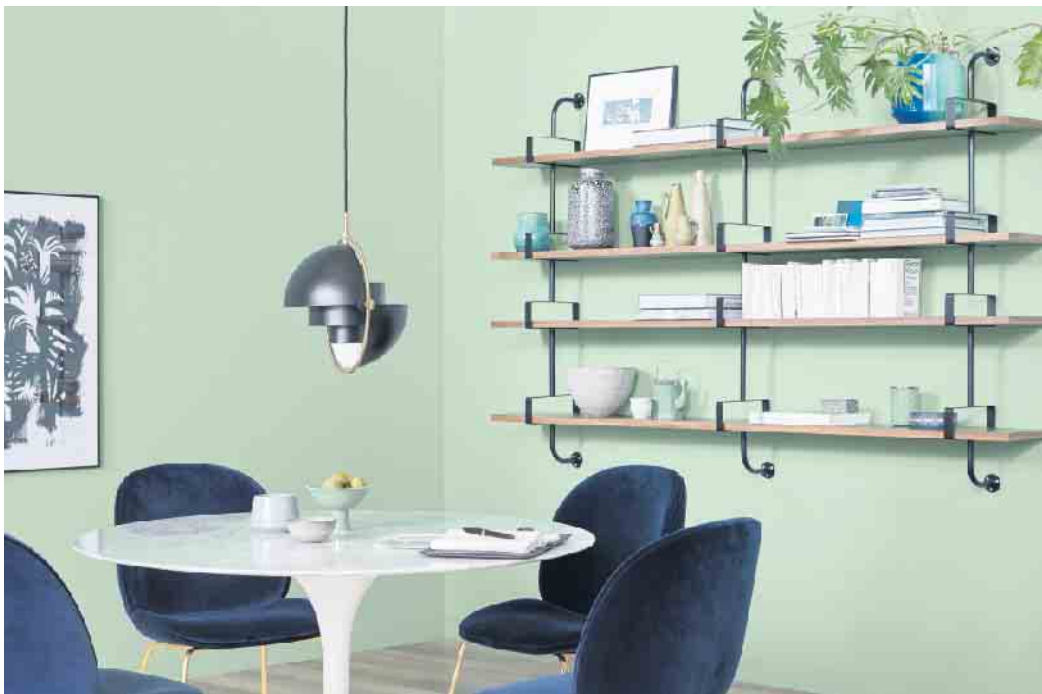
Mehr Mut zur Farbe: Das kreative Kombinieren von Wandfarben, Bödenbelägen und Möbeln verleiht dem eigenen Zuhause mehr Ambiente.

Wer hingegen kräftige Farbakzente setzen will, ist mit den „fruchtigen“ Tönen Amarena,