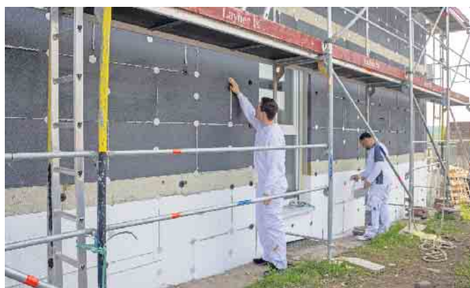
Angesichts hoher Energiepreise amortisiert sich das energetische Sanieren noch schneller.

finanziell ein Gewinn. Dieses Fazit zur Wirkung einer energetischen Modernisierung zieht das Forschungsinstitut für Wärmeschutz e. V. München (FIW) in einer aktuellen Studie aus dem Jahr 2022. Die Kohlendioxid-Emissionen, die etwa bei der Herstellung von grauem EPS, einem gängigen Dämmmaterial, entstehen, haben sich in der Nutzung bereits nach fünf bis acht Monaten amortisiert. Ebenso ist die Herstellungenergie innerhalb weniger Monate wieder eingespart. Zu diesem Schluss kommen die Wissenschaftler nach der Auswertung aktueller Umweltproduktdeklarationen der Dämmstoffe. „Da eine moderne Dämmung buchstäblich ein Hausleben lang hält, fällt die energetische, ökologische und ökonomische