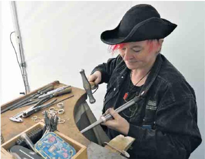
Der Schlossplatz wird am 3. und 4. Juni zur bunten Oase aus Kunsthandwerk aus Frauenhand.

Kulturelle Großveranstaltung lockt am 3./4. Juni auf den Jülicher Schlossplatz