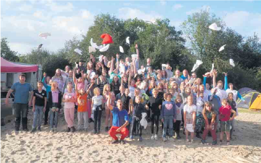
Die offene Zeltstadt lädt vom 25. Juni bis 29. Juli zu einem vielfältigen Programm ein.

- KidZ für kinder von 7 - 12 Jahren (26. Juni - 1. Juli & 3. bis 8. Juli)