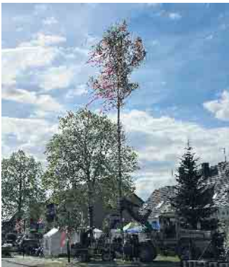
In Giesendorf wird wieder ein großer Maibaum am Dorfplatz aufgestellt

Am 30. April wird auf dem Dorfplatz in Giesendorf wieder der Mai begrüßt. Am Nachmittag schmücken die Kinder aus dem Dorf den großen Maibaum mit bunten Bändern, bevor dieser mit vereinten Kräften aufgestellt wird. Die Maifreunde aus Giesendorf laden alle Bewohner des Ortes und alle Freunde herzlich zu ein paar geselligen Stunden ein, um gemeinsam diese Tradition zu unterstützen. Das Fest am Abend beginnt mit kühlen Getränken um 18 Uhr, ab 19 Uhr gibt es Spezialitäten vom Grill.