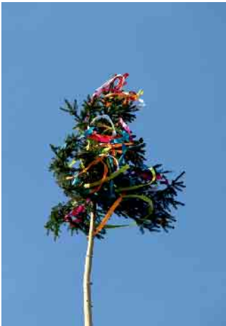
Eure Dorfgemeinschaft Esch Der Vorstand

Liebe Escher und Freunde der Dorfgemeinschaft, am 4. Mai findet unser Maifest, ab 19 Uhr, auf dem Schulhof der Escher Grundschule, statt. Für Getränke, Speisen vom Grill, Reibekuchen und musikalische Unterhaltung ist gesorgt. Natürlich gibt es auch wieder eine Pittermännche Verlosung. Also lasst uns wieder gemeinsam feiern und ein paar schöne Stunden erleben. Wir uns auf euch.