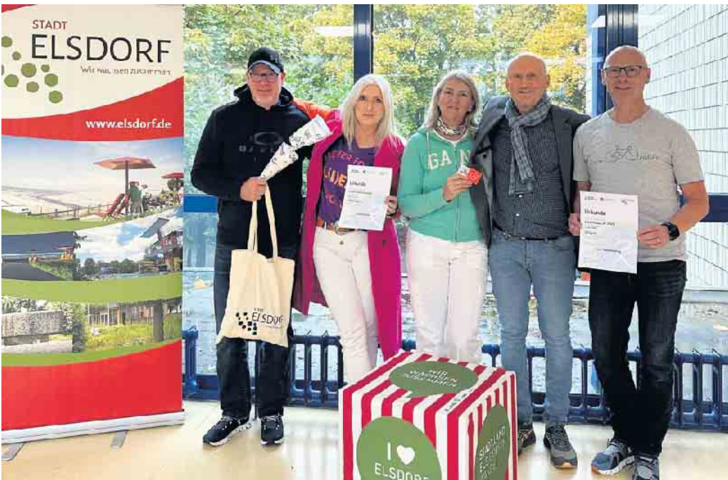
Im vergangenen Jahr gewann das Team „InkedRabbit“ den Preis für das beste Team