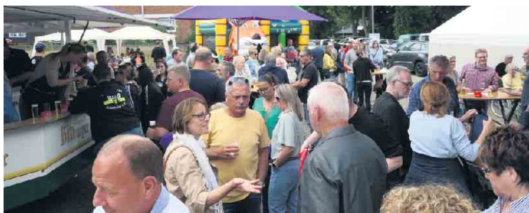
GKG Familienfest 2022