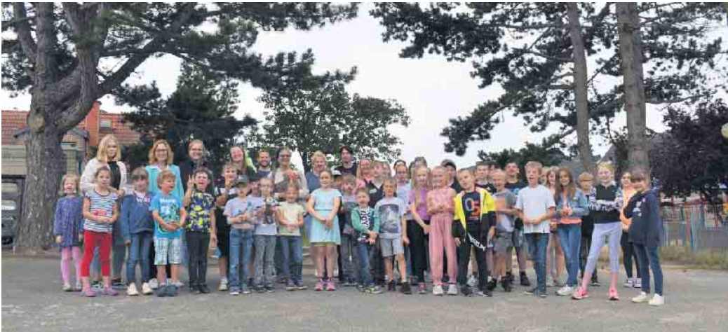
Auch in diesem Jahr können sich die jüngeren Elsdorfer*innen wieder auf tolle Sommerferien freuen

Der Anmeldestopp für die Sommerferienspiele der Stadt Elsdorf war ursprünglich der 28.4.2023. Das Jugendamt gibt den Elsdorfer Familien für die ersten drei Ferienwochen (26.06.-14.07.2023) die Möglichkeit sich bis zum 12.05.2023 anzumelden. Die Wochen 4-5 (17.0.-28.07.2023) sind bis auf 3 Plätze in der 5. Ferienwoche ausgebucht. In der 6. Woche kann noch bis zum 28.4. beim Spielcircus angemeldet werden. Infos und Anmeldung unter https://www.unserferienprogramm.de/elsdorf/index.php