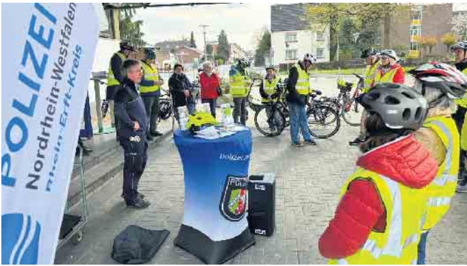
Pedelec-Kurs vor der Festhalle.