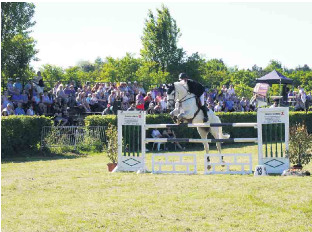
Viele Zuschauer lockt das traditionelle Jülicher Reitturnier jedes Jahr an die Rur

So hofft der ortsansässige Reitverein auch an dem Wochenende vom 12. Bis 14. Mai wieder auf großen Zulauf. Die Reitgemeinschaft ist auf jeden Fall schon voller Vorfreude auf das Rasenturnier. Das Programm ist für die zwei- und vierbeinigen Sportler wie immer breit gefächert. Der Freitagvormittag gehört ganz den jungen Pferden, die noch beweisen müssen, dass sie für den großen Spring-sport geeignet sind. Am Nachmittag gibt es dann mit einem L- und zwei M-Springen Prüfungen für fortgeschrittene Reiter. Der Samstag beginnt mit Einsteigerprüfungen der Klassen E und A. Anschließend folgt bereits eines der Höhepunkte des Turniers, die Mannschafts-