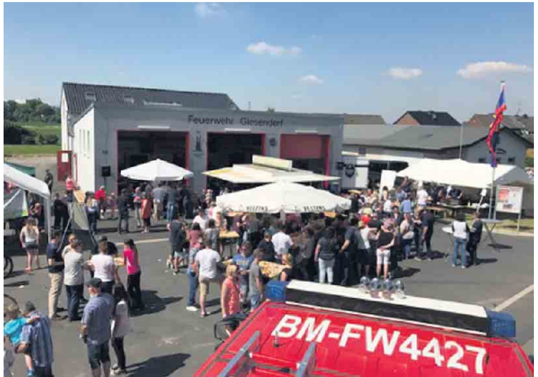
Buntes Treiben rund ums Giesendorfer Feuerwehrhaus

Beim Tag der offenen Tür der Feuerwehr Giesendorf am 18. Mai, dem gewohnten Termin an Christi Himmelfahrt bzw. Vatertag , werden rund um das Gerätehaus in der Etzweilerstraße 98 Fahrzeuge und Technik der Feuerwehr präsentiert. Auch das Thema Brandschutz wird den Besuchern näher gebracht, es gibt dabei Einiges zu entdecken. Angeboten wird Leckerer vom Grill und ab 14 Uhr eine Cafeteria. Für kühle Getränke ist ebenfalls gesorgt, zum Beispiel kann man am Stand von Winzer Thielen-Schunk die aktuellen Weine probieren. Auch die Jugendfeuerwehr stellt sich gegen 16 Uhr mit einer Schauübung vor und bietet vorher unter anderem mit einer Feuerwehr-Hüpfburg Unterhaltung für Kinder an. Übrigens: Bei der Feuerwehr kann jeder mitwirken! In der Stadt Elsdorf ist der komplette Einsatzdienst ehrenamtlich organisiert, und die Frauen und Männer in den acht Löschcheinheiten der Stadt bewältigen vielseitige Einsatzsituationen. Moderne Technik, gute Ausbildung und gelebter Zusammenhalt bieten den Rahmen für eine sinn-