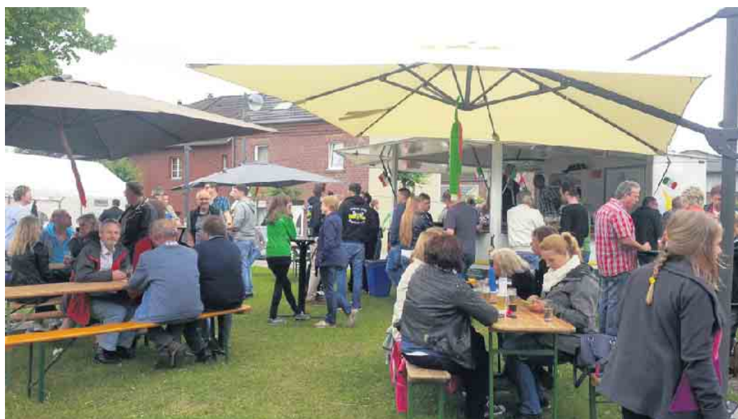
Bild der Vatertagsfete 2019

ern und viele von Euch in unserem schönen Dorf begrüßen zu dürfen.