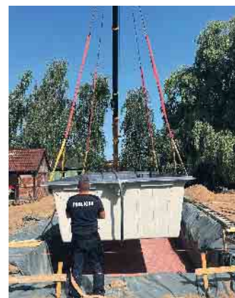
Ein Becken findet seinen Platz.

Mitarbeiter m/w/d auf Minijob-Basis gesucht, gerne Frührentner. Gartengestaltung Schmitz Kreuzau, Tel.: 0176 - 96006954