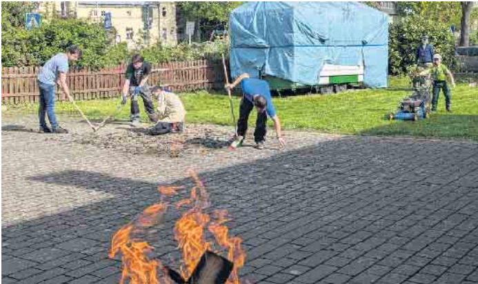
Vom Grill gab es im Anschluss Würstchen für die fleißigen Gärtner

dürfen. Von dem Preisgeld wurden Vogelhäuschen gebaut und auf dem Gelände der Pfarrkirche St. Mariä Geburt aufgehängt und insektenfreundliche Pflanze gekauft und gepflanzt. Eine Benjeshecke aus aufgestapeltem Totholz als Unterschlupf für Igel und Insekten wurde angelegt und soll erweitert werden, ein Kräuterbeet wurde angelegt. Den stillgelegten