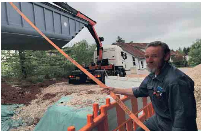
Volle Konzentration beim Poolbau.

badbranche findet man auf der Website des Bundesverbandes Schwimmbad & Wellness e.V. (bsw) unter www.bsw-web.de . (akz-o)