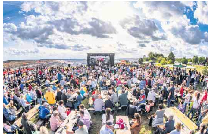
Die Sommer-Konzertreihe „Musik mit Aussicht“ am Forum:terra nova startet am 22. Juni.

Karten zu den Veranstaltungen gibt es im Rathaus, bei Foto Servos (Elsdorf), Kiosk am Dorfplatz (Berrendorf), Annis Backstübchen (Heppendorf), Kaffeebohne (Bedburg), Schreibwaren Wassenberg (Kaster) und online unter www.elsdorf.de/kultur