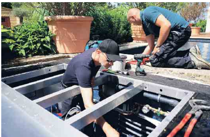
Arbeiten am Technischacht.