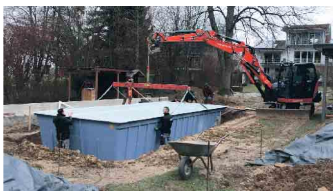
Teamwork auf der Baustelle.

Denn gesellschaftliche Entwicklungen stärken den Wirtschaftszweig. Dazu gehören das zu-