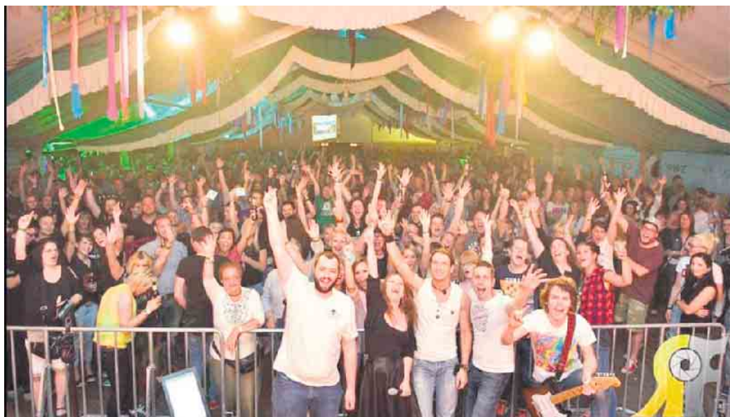
Das Maifest in Berrendorf-Wültenrath bildet das Highlight im Jahresprogramm der Maigesellschaft.

Eröffnet wird dieses am Freitag, 3. Mai, ab 18 Uhr von DJ Zasa mit „Shades of May - Das Neon Revival, eine Garantie für gute Stimmung und eine gelungene Party. Eintrittskarten können für einen Preis von 6 Euro beim Kiosk am Dorfplatz in Berrendorf, über Eventim light (Link dazu findet sich