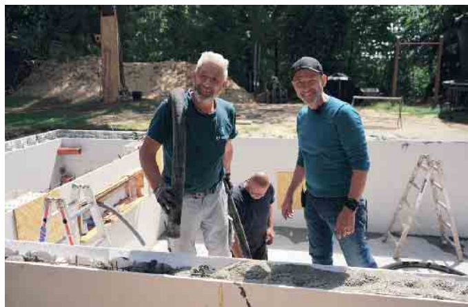
Gute Laune beim Poolbau.

Gibt es einen Beruf, in dem man Träume erfüllen kann? In dem individuelle Beratung genauso gefragt ist wie handwerkliches Können und ein Gespür für Ästhetik und Design? In dem man Werte schafft, die für andere den „Himmel auf Erden“ bedeuten? Schwimmbadbauer ist so ein Beruf - vor allem, wenn es um den Bau privater Pools geht.