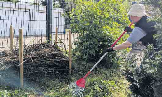
Eine Benjeshecke wurde angelegt