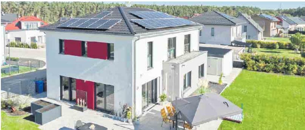
Beim Fertighausbau wird der Grundriss so wie das gesamte Haus individuell auf die Baufamilie zugeschnitten.

In einem klassischen Schlafzimmer sind gut zwölf Quadratmeter