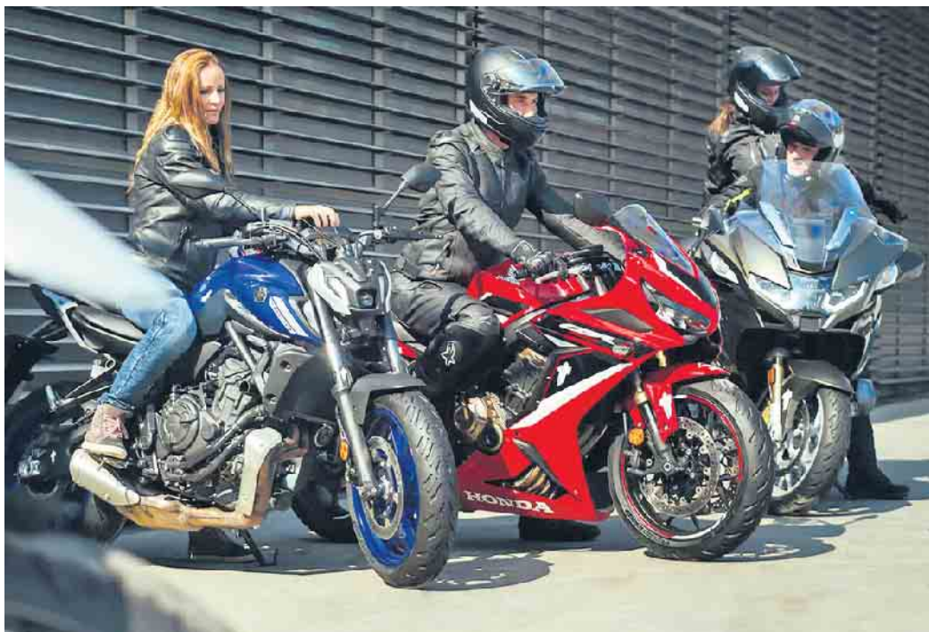
Die Freiheit auf zwei Rädern genießen - hochwertige und gut gepflegte Reifen sorgen dabei für ein sicheres Vergnügen.

Für Biker gibt es kaum Schöneres als eine Tagestour mit Freunden, bei der man besondere Augenblicke teilt. Gute Reifen verbinden dabei Fahrspaß mit Sicherheit und Komfort. Allgemein dürfen Reifen gefahren werden, bis die gesetzliche Verschleißgrenze von 1,6 Millimetern Profiltiefe erreicht ist oder Alterungsspuren sichtbar werden. Auf Nummer sicher gehen alle, die Motorradreifen nach fünf Jahren einmal jährlich von einem Fachmann prüfen lassen und die Reifen nach maximal sieben Jahren austauschen. Durch einen Wechsel profitieren Motorradfahrer gleichzeitig von aktuellen Weiterentwicklungen unter anderem bei der Profilgestaltung, den Rohmaterialien und dem Reifenaufbau. Mit verbesserten Ei-