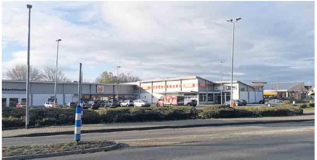
Die Discounter-Märkte an der Ohndorfer Straße werden modernisiert und erweitern ihr Sortiment.

Die im Discountermarkt freige-wordene Fläche nutzt der Norma um das eigene Angebot auszubauen und zu modernisieren.