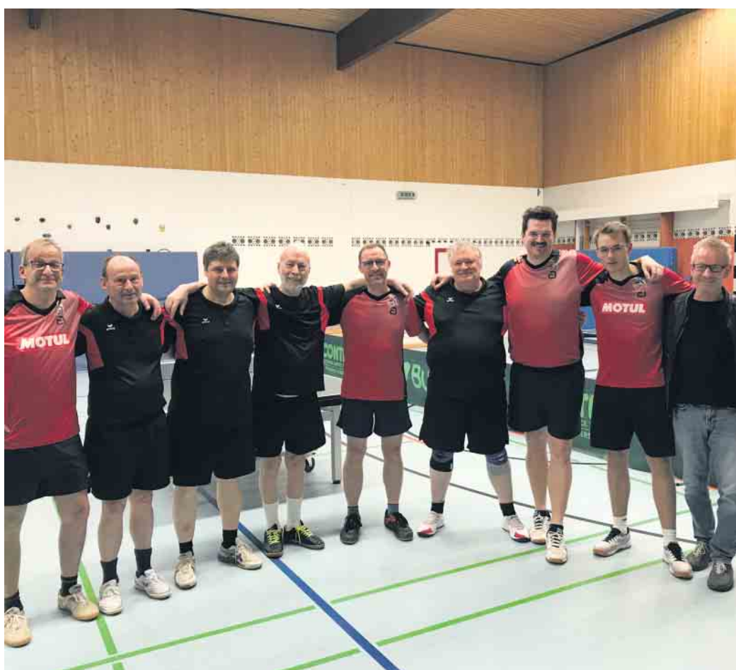
Gute Stimmung herrschte nach dem Topspiel auf beiden Seiten.

Unterdessen beendete die Erste die Saison mit einem 5:8 bei Lövenich III. Drei Tage vor dem Spiel