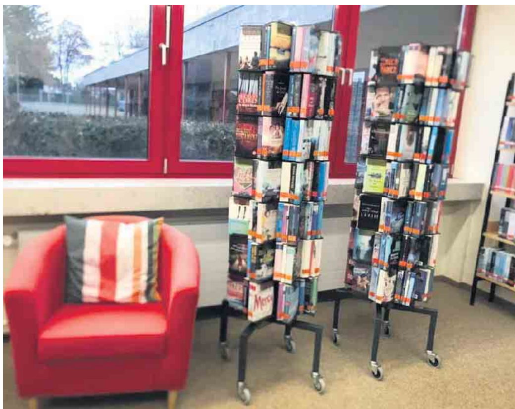
Die Stadtbibliothek freut sich über Besuch

Die Kolleginnen aus der Stadtbibliothek Elsdorf freuen sich auf Ihren Besuch und stehen Ihnen wie immer mit Rat zur Seite.