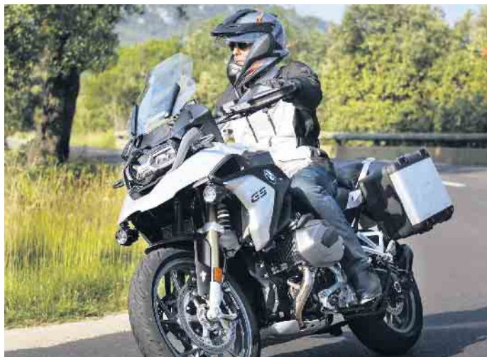
Für genug Grip sollten Biker den Reifenfülldruck alle 14 Tage überprüfen.

und Felgen sauber zu halten. Dauerhafter Kontakt zu Öl, Benzin, Lösungsmitteln und Chemikalien sollte in jedem Fall vermieden werden. Eine kurze Behandlung, zum Beispiel beim Entfernen eines Etiketts mit Bremsenreiniger, schadet dem Reifen jedoch nicht. Ebenfalls unbedenklich verwendet werden kann Shampoo - anschließend mit klarem Wasser gründlich abspülen. Wer zum Dampfstrahler greift, sollte einen Mindestabstand der Düse zu den Reifen von 15 Zentimetern einhalten, um Beschädigungen zu vermeiden. (djd)