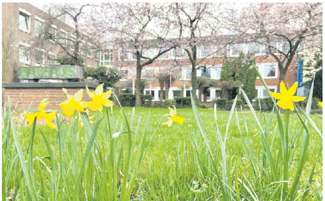
Ostern steht vor der Rathaus-Tür

Die Stadtbibliothek Elsdorf bleibt vom 11. bis 14. April 2023 geschlossen. Alle digitalen Dienste bleiben aber wie gewohnt rund um die Uhr nutzbar.