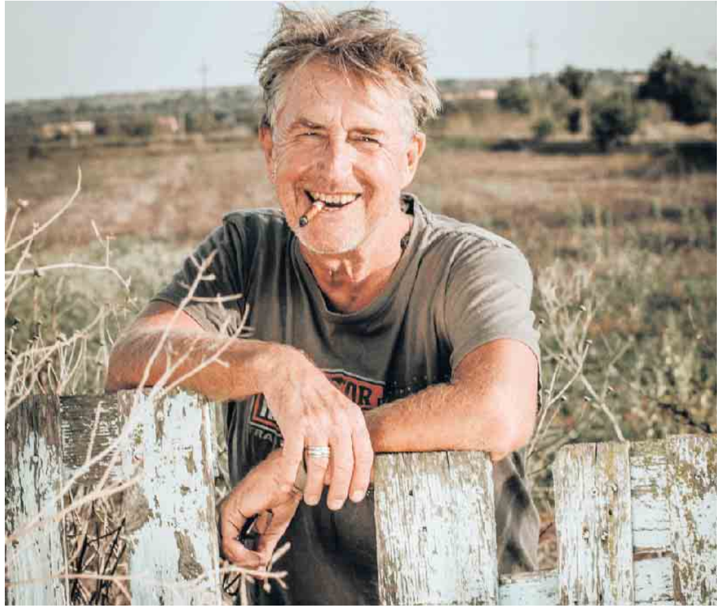
Schauspieler Martin Semmelrogge liest am 12. April in Elsdorf musikalisch untermalt aus seiner Biographie.