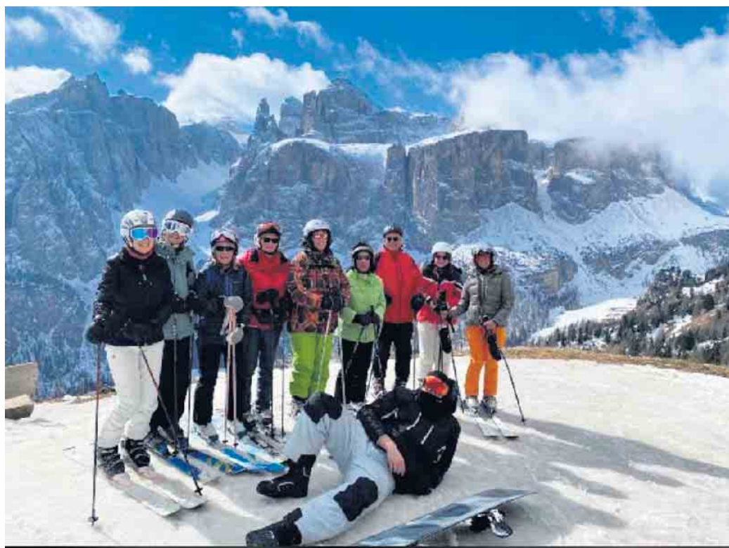
Eine der Skigruppen vor der fantastischen Kulisse der Dolomiten

Nach einem ausgiebigen Skitag trafen sich alle zum Après-Ski mit Gaudi am Bus und die Rückfahrt zum Hotel tat der Feierlaune und Freude der TeilnehmerInnen keinen Abbruch. Im Hotel blieben keine Wünsche offen. Ob im Sauna- und Wellnessbereich, wo man die beanspruchten Muskeln entspannen konnte oder beim gemeinsamen Abendessen, man konnte sich jedes Mal schon wieder auf den nächsten Tag freuen. Mit verschie-