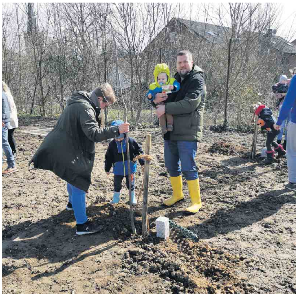
Die schöne Tradition der Storchenviesen erfreut sich in Elsdorf seit sieben Jahren großer Nachfrage.

wird der Park bald auch einen Spielbereich für Kleinkinder, weitere Spielgeräte, eine Festwiese, einen Bühnenplatz, Sitzbänke mit Picknick-Ecke, Bolzwiese, Streetballplatz und robuste Tischtennisplatten umfassen. Die Fertigstellung der gesamten Fläche ist für Herbst 2023 vorgesehen.