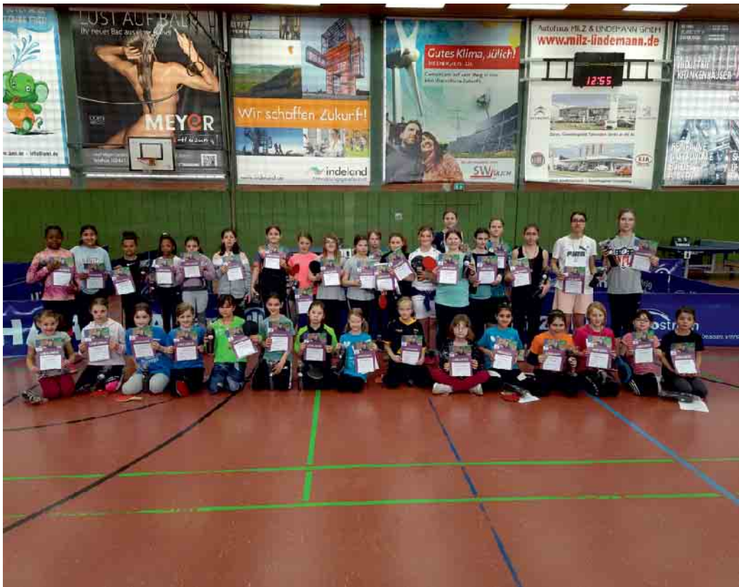
Die teilnehmenden Mädchen beim Kreiseentscheid