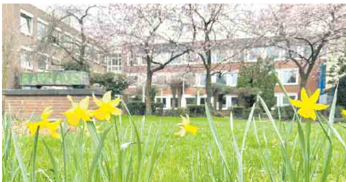
Ostern steht vor der Rathaus-Tür

von 10 bis 11 Uhr ein Notdienst eingerichtet. Die übrigen Dienststellen des Rathauses bleiben an diesem Tag geschlossen. Die Stadtbibliothek Elsdorf bleibt vom 11. bis 14. April 2023 geschlossen. Ebenfalls geschlossen hat die Stadtbibliothek am Freitagnachmittag, den 31. März 2023. Alle digitalen Dienste bleiben aber wie gewohnt rund um die Uhr nutzbar.