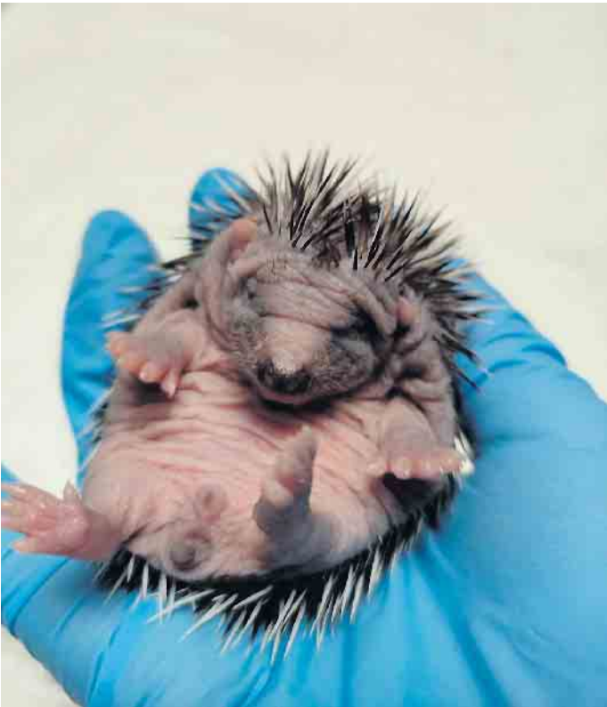
Acht Tage junger Igelsäugling.

In der Zeit bis einschließlich 5. April präsentiert Karin Oehl , Igelstation Pulheim seit 1973, mit den Tierfreunden Rhein-Erft und Pro Igel e.V. das Wildtier Igel im Foyer des Pulheimer Rathauses , Alte Kölner Str. 26, 50259 Pulheim. Während der Öffnungszeiten montags bis freitags, 8.30 bis 12 Uhr, montags bis mittwochs, 14 bis 16 Uhr und