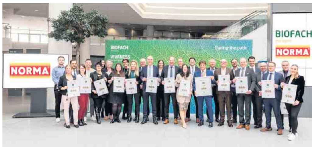
Mitarbeiterinnen und Mitarbeiter des NORMA-Einkaufs haben die Auszeichnungen des DLG zusammen mit Vorstand und Geschäftsleitung auf der BIOFACH 2024 entgegengenommen.

Kundinnen und Kunden finden bereits seit 2006 starke Bio-Produkte zu gewohnten NORMA-Tiefstpreisen in den Regalen der NORMA-Filialen. Der Nürnberger Lebensmittel-Händler beweist nicht nur mit dem langjährigen Erfolg von BIO SONNE, sondern auch mit dem immer größer werdenden Sortiment der Eigenmarke, dass die Rolle als Vorreiter im Bio-Segment wohlverdient ist.