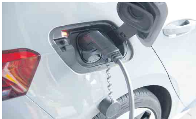
Anschluss in beide Richtungen. Beim bidirektionalen Laden dient die Batterie des E-Autos als zusätzlicher Energiespeicher für den Haushalt.

Die Batterie des E-Autos hat großes Potenzial, künftig nicht nur für den Fahrbetrieb genutzt zu werden, sondern auch das eigene Zuhause mit Strom zu versorgen. Fachleute sprechen vom sogenannten bidirektionalen Laden, also Laden in beide Richtungen: Strom fließt nicht nur in den Fahrzeugakku, sondern bei Bedarf auch wieder zurück ins Hausnetz. Was aktuell noch wie Zukunftsmusik klingt, kann E-Auto-Fahrern schon bald einen attraktiven Zusatznutzen bieten.