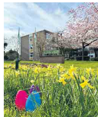
Rund um das Rathaus sind am Ostersonntag bunte Eier versteckt

gastiert mit dem orientalischen Märchen erstmals in Elsdorf. Die gefundenen Ostereier können ab dem 2. April im Bürgerbüro der Stadt Elsdorf gegen Eintrittskarten eingetauscht werden. Die Stadt Elsdorf wünscht allen Elsdorferinnen und Elsdorfern am Ostersonntag viel Freude beim Suchen!