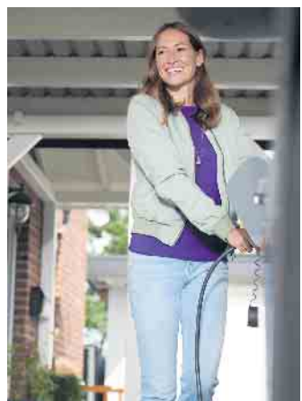
Das bidirektionale Laden befindet sich aktuell in der Testphase. Besondere Vorteile bestehen in Verbindung mit einer Photovoltaikanlage.

Insbesondere in Verbindung mit Photovoltaikanlagen (PV) weist das bidirektionale Laden zahlreiche