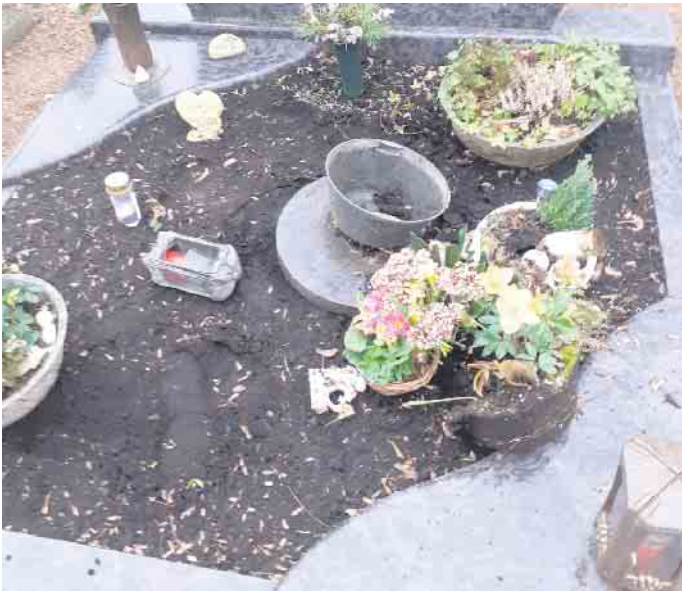
Auf drei Elsdorfer Friedhöfen waren in jüngster Vergangenheit Vandalismus und Diebstähle zu beklagen.

die Stadtverwaltung dazu auch selbst Anzeige zu erstatten. Der Kommunale Ordnungsdienst wurde sensibilisiert und kontrolliert in den Abendstunden verstärkt die Friedhöfe im Stadtgebiet. „Wir möchten ein deutliches Zeichen setzen, denn solche Taten dürfen nicht ungestraft bleiben. Sollten Sie Zeuge der Vorfälle sein, bitten wir um Hinweise. So haben wir eine Belohnung in Höhe von 500 Euro für sachdienliche Hinweise ausgesetzt, die zur Feststellung des/der Täter(s) führen“, so Bürgermeister Heller. Mögliche Zeugen oder Beobachter können sich an das städtische Bürgerbüro (buergerbuero@elsdorf.de oder 02274 709 100) wenden.