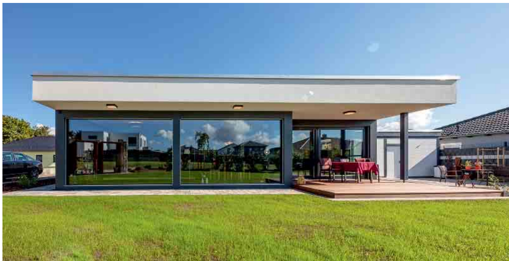
Bauherren schätzen den Komfort eines Bungalows in Holz-Fertigbauweise.

Nach der jungen Familie sind Menschen über 50 die zweitwichtigste Zielgruppe für Hausbauunternehmen. Laut Statistik des Bundesverbandes Deutscher Fertigbau (BDF) zählt fast jeder vierte Bauherr zu dieser Altersgruppe. Viele von ihnen möchten aus einer Stadtwohnung oder einem zu groß gewordenen Haus lieber in einen altersgerechten Wohnsitz umziehen. Sie wünschen sich ein kleines Haus mit Garten, das modern, komfortabel und pflegeleicht ist und das viele Lieblingsplätze bereithält, die sich spätestens nach Ende des Berufslebens so richtig genießen lassen. Meist ist ihr Traumhaus für die zweite Lebenshälfte ein Bungalow.