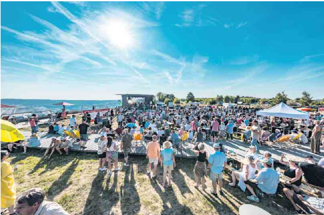
Karten für die Sommer-Konzertreihe „Musik mit Aussicht“ (im Bild) und „We love the 90’s“ sind ab sofort erhältlich.

Karten zu den Veranstaltungen gibt es im Rathaus, bei Foto Servos