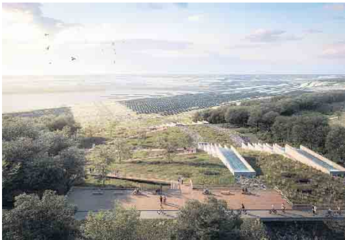
Wo aktuell noch der Speedway auf die Tagebauböschung trifft, wird zukünftig das Einleitbauwerk entstehen.