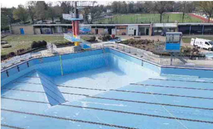
Das Kombibecken wird mit Folie ausgekleidet

Nachdem seitens der Verwaltung dem Ausschuss für Schule, Sport und Soziales am 15. Februar die überarbeitete Planung zur Sanierung des Elsdorfer Freibades vorgestellt wurde, beschlossen die Ausschussmitglieder in einer Sondersitzung am 27. Februar ihre Empfehlung an den Rat. Die eingehende Begutachtung des Freibad-Zustandes durch die beauftragten Planer des Fachbüro „Krieger Architekten Ingenieure GmbH“ hat den tatsächlich notwendigen Sanierungsaufwand offengelegt und die Einholung aktueller Preise für die entsprechenden Gewerke möglich gemacht. Somit musste die Planung gegenüber der ersten Einschätzung eines anderen Büros aus November 2022 komplett angepasst werden. Zwei Varianten wurden vorgestellt. Die Verwaltung sprach sich klar für die Variante „Basis+“ aus, die den Erhalt des Nichtschwimmerbeckens und der vorhandenen Wasserrutsche vorsieht. Der Ausschuss folgte diesem Vorschlag und beschloss einstimmig bei einer Enthaltung, diesen dem Rat zu empfehlen. Vorgesehen ist unter anderem die Instandsetzung und Neuauskleidung des 50-Meter-Beckens mit Folie, die Erneuerung des gesamten Beckenkopfes zur Gewährleistung der Wasserhydraulik und ein