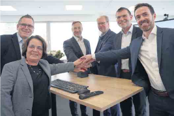
Am 29.2.2024 wurde der Gesellschaftsvertrag der PSO-Erft von den beteiligten Partnern unterzeichnet.

Stadtwerke Erft GmbH und Westenergie AG gründen Beteiligungsgesellschaft mit dem Ziel der gemeinsamen intelligenten Energieinfrastrukturplanung