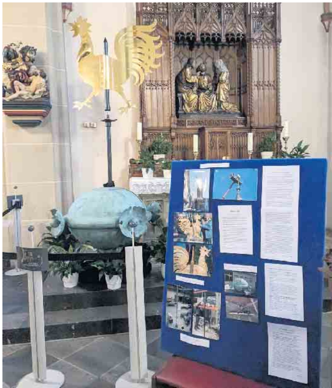
Präsentierte sich frisch poliert und goldglänzend: der restaurierte Wetterhahn der St. Martinuskirche in Niederembt

Zusammen mit Kugel und Kreuz am 5. März wieder auf dem Kirchturm installiert