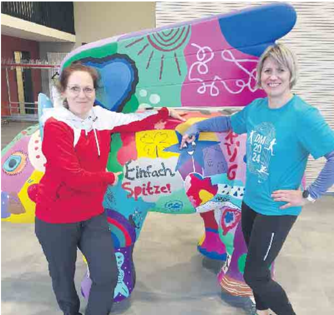
Ein starkes Duo

Elsdorfer Leichtathletin kehrt mit Gold und Bronze heim