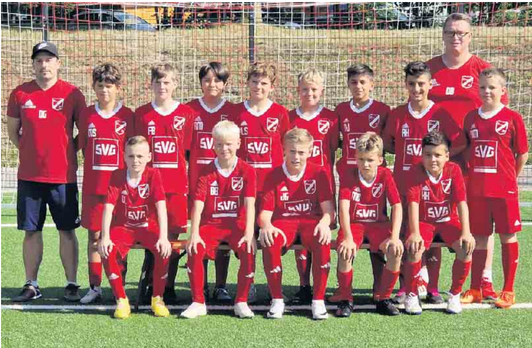
Die erfolgreiche D-Jugend des FC Rot-Weiß Berrendorf