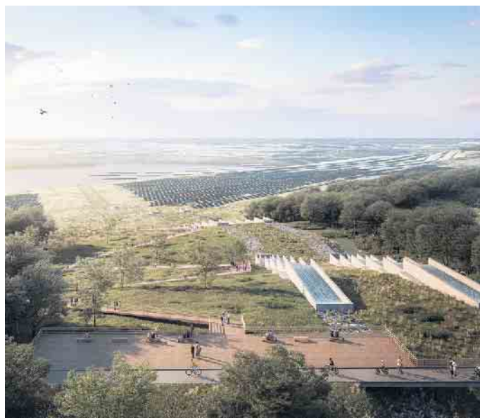
An der porta sophia wird zukünftig das Einlaufbauwerk zur Seebefüllung entstehen.

Um vormals gekappte Verbindungen wiederherzustellen, sollen neue Mobilitätssysteme rund um die Sophienhöhe und den Tagebausee, die durch den Bergbau realisierten Ersatzstraßen ergänzen. Der Schwerpunkt soll vom motorisierten Individualverkehr auf umweltfreundliche Mobilitätsformen verlagert werden. Der Hambach Loop soll als Rad- und Wanderweg zusammen mit Reitwegen rings um den See und die Sophienhöhe führen. Ebenfalls sollen erweiterte Bahnverbindungen sowie eventuell eine Seilbahn den Raum neu erschließen und konsequent durch Mobilstationen verknüpft werden.