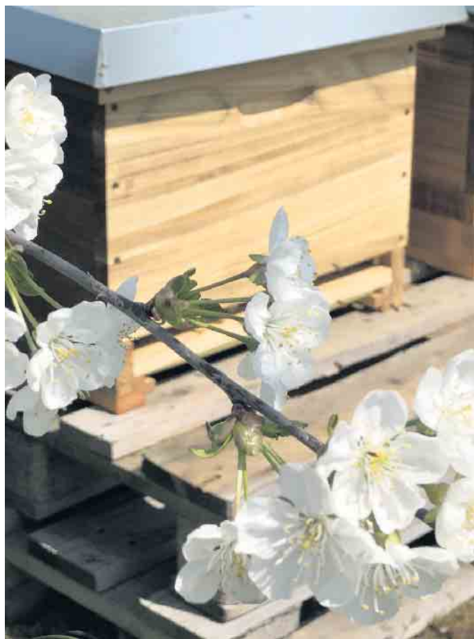
Obst- und Gemüseanbau im eigenen Garten wird immer beliebter - und hat auch Bienen etwas zu bieten.

Bei weniger bienenfreundlichen Gemüsesorten ist es ein guter Tipp, die Beete mit Thymian oder Lavendel einzufassen. Diese Kräuter sind nicht nur als geschmacksintensive Gewürze in der Küche verwendbar, sondern haben sich auch als Heilpflanzen bewährt. So wird Thymiantee gegen Erkältungen und Husten eingesetzt, Lavendel hilft als Kräuterkissen oder Badezusatz zur Entspannung und Beruhigung. Leckere und gleichzeitig bienenfreundliche Kräuter für den Eigenanbau sind weiterhin Schnittlauch, Salbei, Ysop und Zitronenmelisse. Malve lässt sich gut als Tee genießen, und bei der Kapuzinerkresse sind sogar die ganzen Blüten essbar und als würzig-bunte Deko eine Zierde für jeden Salat. (djd)