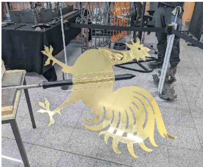
Frisch vergoldet liegt der Wetterhahn in der Werkstatt des Kunstschlossers bereit.

„Da die Sturmversicherung nicht alle Restaurierungsarbeiten erstatten wird (der Hahn war immerhin 60 Jahre auf dem Turm) bleibt noch ein offener Betrag für die Kirchengemeinde, der durch Spenden aufgebracht werden soll“, so der Kirchenvorstand. Zu den Besichtigungszeiten wird Ge-