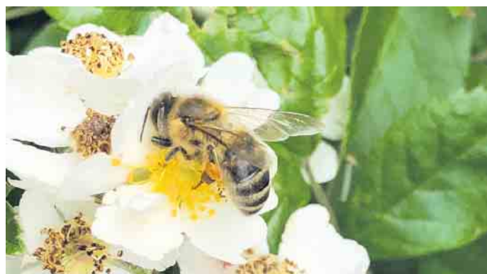
Die Blüten von Obstbäumen und Beerensträuchern liefern Honigbienen Nahrung. Zum Dank sorgen die fleißigen Bestäuberinnen für reiche Ernte.