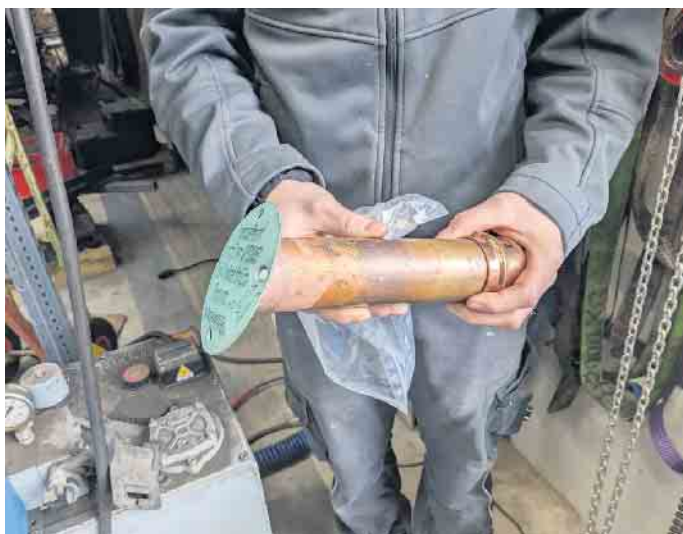
In diese Hülse sollen Dokumente eingefüllt werden, ehe sie in der Kugel unter dem Wetterhahn platziert wird.

Am Montagvormittag erhalten Kindergartenkinder eine Führung und alle anderen Kinder sind gegen 16.30 Uhr eingeladen, noch ein letztes Mal einen ganz nahen Blick auf den Hahn zu werfen, ehe er in luftige Höhe gehievt wird. (mos)