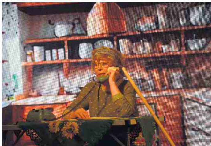
Zwei Blaue Funken, Feinripp