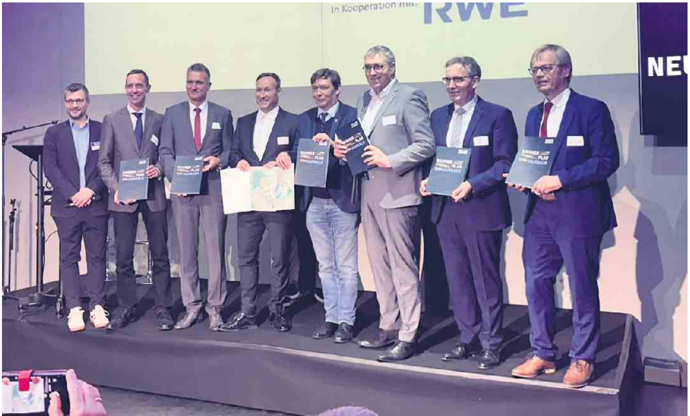
Der Rahmenplan Hambach wurde am 22.02. offiziell präsentiert.