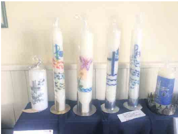
Individuell gestaltete Kerzen für jeden Anlass gibt es im Kirchenladen Regenbogen