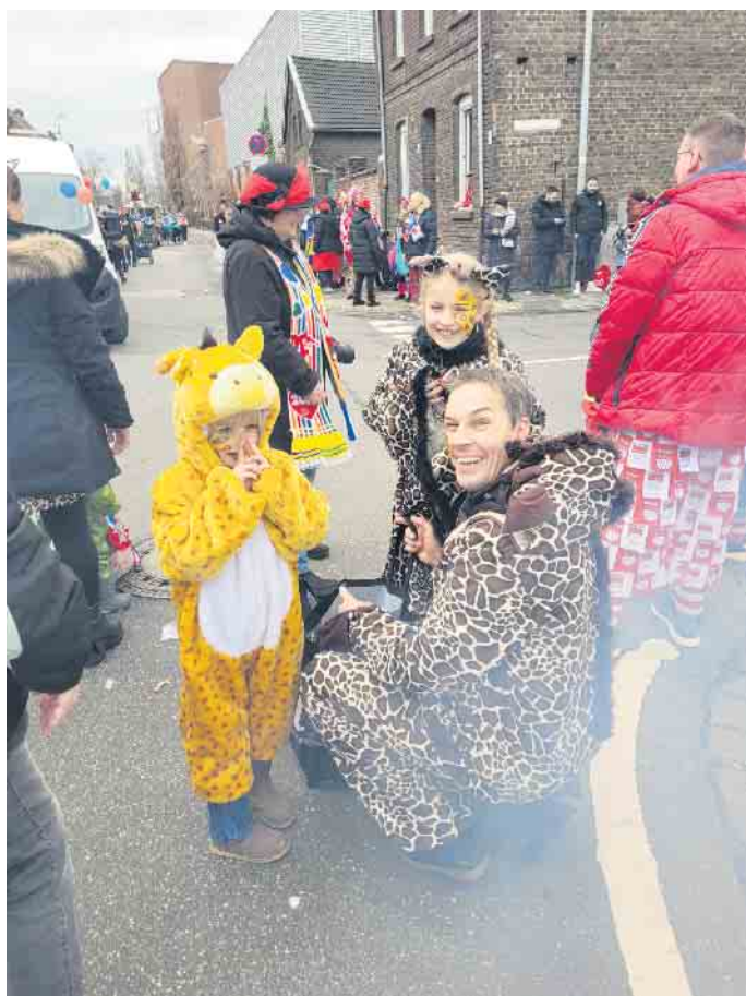
Die Giraffenfamilie wartet auf den Elsdorfer Karnevalszug