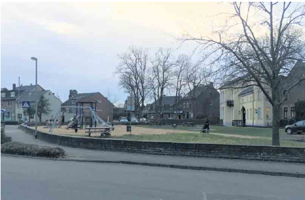
Das Areal am Prompershof soll gemeinsam mit vielen Bürger/innen geplant und gestaltet werden.

Die Stadt Elsdorf lädt alle interessierten Bürgerinnen und Bürger ein, ihre Meinung zur Neugestaltung am Prompershof mitzubringen. Die Bürgerbeteiligung findet am Mittwoch, den 6. März 2024, von 18 - 20 Uhr in der Mensa der Gesamtschule an der Gladbacher Straße 139 statt. Anmelden kann sich jede/r per E-Mail an ISEK@elsdorf.de oder telefonisch bei Frau Gümüs unter 02274 - 709 263. Eine spontane Teilnahme ist jedoch auch möglich. Gemeinsam mit vielen interessierten Elsdorferinnen und Elsdorfern möchte die Stadtverwaltung erörtern, wie der historische Ortskern um den Prompershof herum einmal aussehen könnte. Dabei stehen in einem ersten Schritt übergeordnet die Themen Straßenraum, Fuß- und Fahrradwege sowie Grün-, Freiraum- und Verweilflächen im Fokus. Kurzum: Wie kann die Aufenthaltsqualität verbessert werden, damit sich alle Generationen im historischen Ortskern wohlfühlen? Es werden Thementische angeboten, an denen die Teilnehmer/innen ihre Ideen und Gestaltungswünsche einbringen können. Wer das Areal am Prompershof kennt,