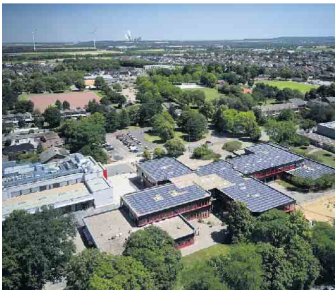
Die Elsdorfer Gesamtschule und auch viele weitere städtische Gebäude sind seit Jahren bereits mit Photovoltaik-Anlagen ausgestattet.

fer Rathaus. Die Stadt hat daher zum Thema „Kommunale Wärmeplanung“ unter anderem eine eigene Website mit Informationen rund um das Projekt erstellt. Sie kann unter www.elsdorf.de/waermeplanung aufgerufen werden. Die Seite wird fortlaufend aktualisiert. „Mit dem kommunalen Wärmeplan erstellen wir eine ganzheitliche Strategie für die Wärmewende in Elsdorf - und damit einen wichtigen Baustein hin zur geplanten Klimaneutralität 2045“, bringt es Bürgermeister Andreas Heller auf den Punkt. „Ziel ist, langfristig verlässliche Planungssicherheit für alle Akteure im Wärmesektor für die anstehenden Investitionen in die Transformation der Wärmeversorgung zu gewährleisten“, so Heller weiter.