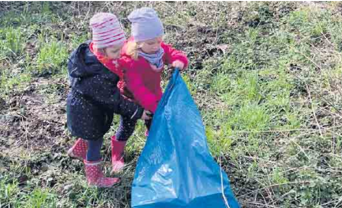
Klein und Groß sind traditionell im Frühjahr in Niederrembt auf den Beinen um Müll aufzusammeln.

Maigesellschaft Holdes Grün e.V. Etzweiler