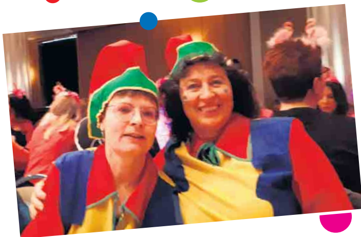
Karnevalsfoto Elsdorf.