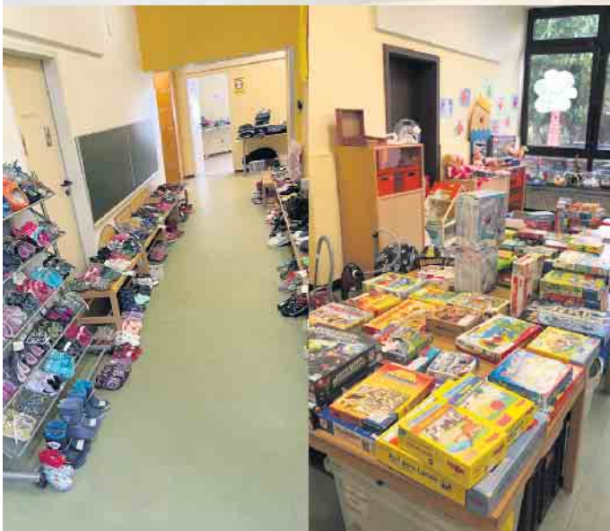
Das Familienzentrum „Haus der kleinen und großen Leute“ lädt am 19. März zum Kindersachen-Trödel ein.