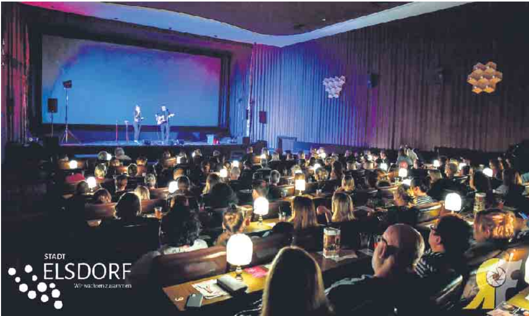
Am 25. März läuft der Kultfilm „Pretty Woman“ im Elsdorfer Kino.

Karten sind ab sofort für 10 Euro im Rathaus Elsdorf, bei Foto Servos