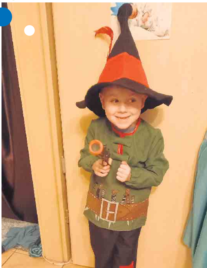
Räuber Hotzenplotz Milan, der Karnevals Samstag (10.2.18) geboren wurde ist ein richtiger Karnevalsjeck.