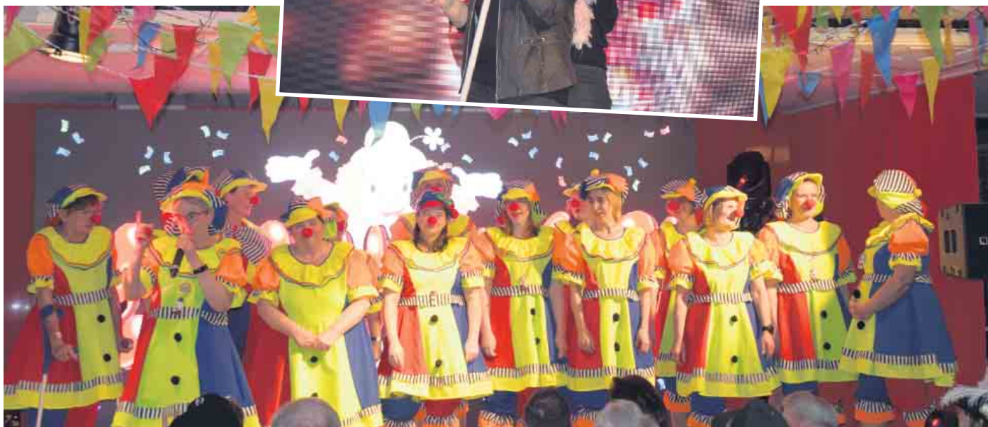
Stoppelhopper in Aktion bei ihrer Hitparade.

Nach zwei Jahren Zwangspause hat der Karnevalsverein Jecke Wiever 76 e.V. aus Elsdorf Esch wieder drei Sitzungen in der Erich-Kästner-Grundschule auf die Beine gestellt.