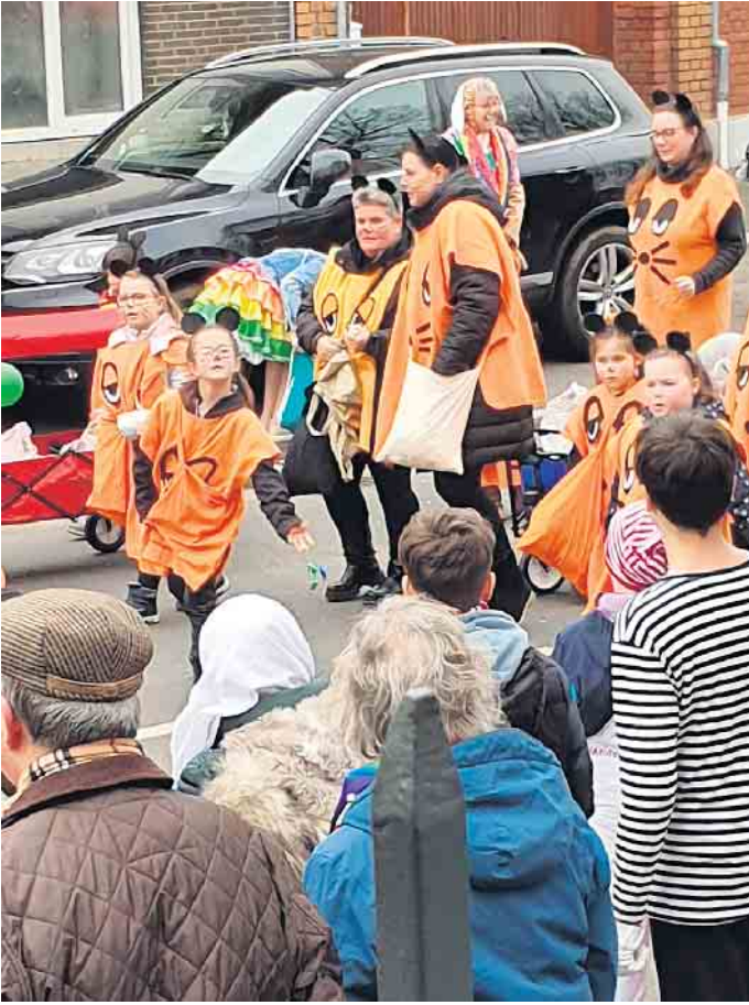
Die „Maus“ versüßte die Zuschauer

Nach Corona-Pause startete am Veilchendienstag wieder der Karnevalszug der Dorfgemeinschaft Esch mit über 400 Jecken. Unter blauem Himmel startete der Zug um 13:11 Uhr an der Grundschule Esch. Bereits einige Zeit vorher