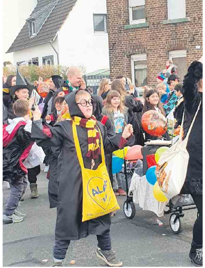
Harry Potter zauberte mit Kamelle

hatten sich zahlreiche Besucher an markanten Zuschauerpunkten eingefunden. Von den Fußgruppen und Motivwagen wurden die kleinen und großen Zuschauer reichlich mit Wurfmaterial in Form von Süßigkeiten beschenkt.