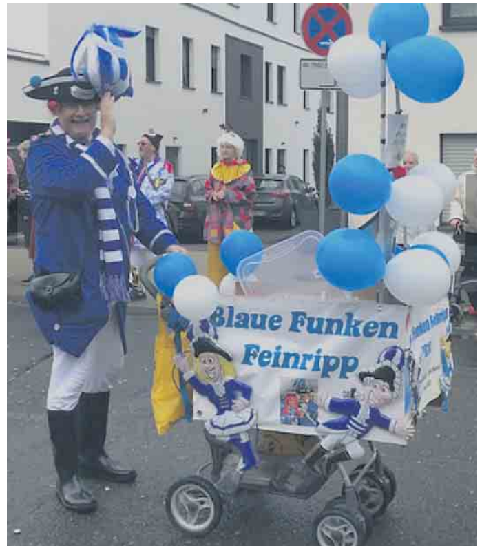
Zuckerwürfelzug in Elsdorf