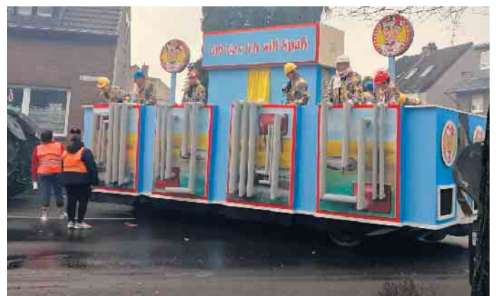
Gruppe Fleischlose. Motto: Gib Gas ich will Spaß.