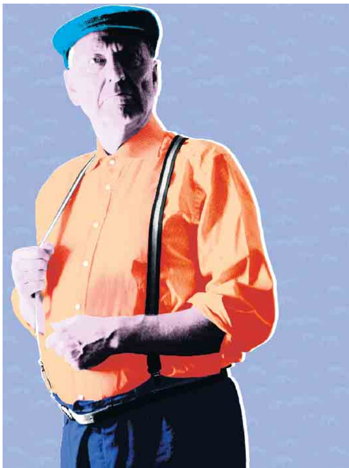
Gerd Dudenhöffer, bekannt aus der TV-Serie „Familie Heinz Becker“ spielt am 10. März sein neues Programm in Elsdorf.

Gerade aus dem Blickwinkel des engstirnigen Spießbürgers, den das Publikum so gerne belächelt, liefert der Kabarettist bittersüße An- und Einsichten, die beweisen, dass nicht alles Gold ist, was glänzt - und umgekehrt. Nicht umsonst erfreuen sich