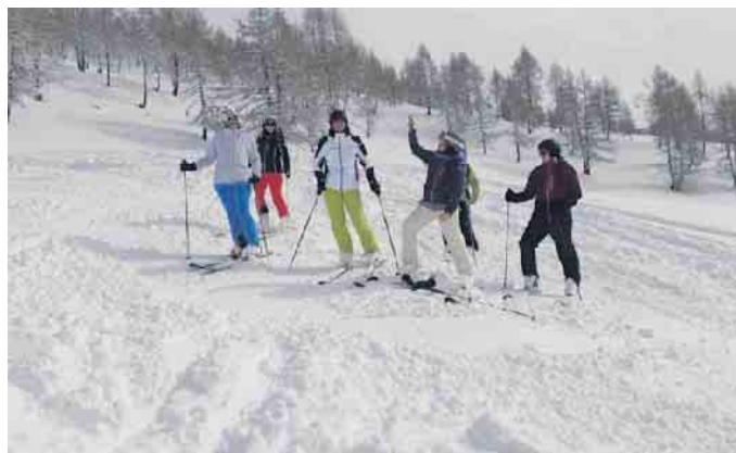
Traumhafte Bedingungen für Wanderer und Skiläufer

Vom 4. März bis 11. März findet unsere Ski- und Wandersafari statt. Jeden Tag in ein anderes Skigebiet - wer Abwechslung und Spaß an der Geselligkeit liebt, ist hier goldrichtig. Du entscheidest selber, ob du skiläufst oder lieber beim Wandern die Natur bewunderst. Tolles 4*Hotel in Schabs-Natz, du lernst jeden Tag ein anderes Skigebiet kennen, zwei regionale Guides stehen uns zur Verfügung, Après-Ski mit Gaudi am und im Bus, einfach Spitze. Unser langjährig vertrauter Busfahrer steht uns die ganze Woche zur Verfügung. Du musst nicht