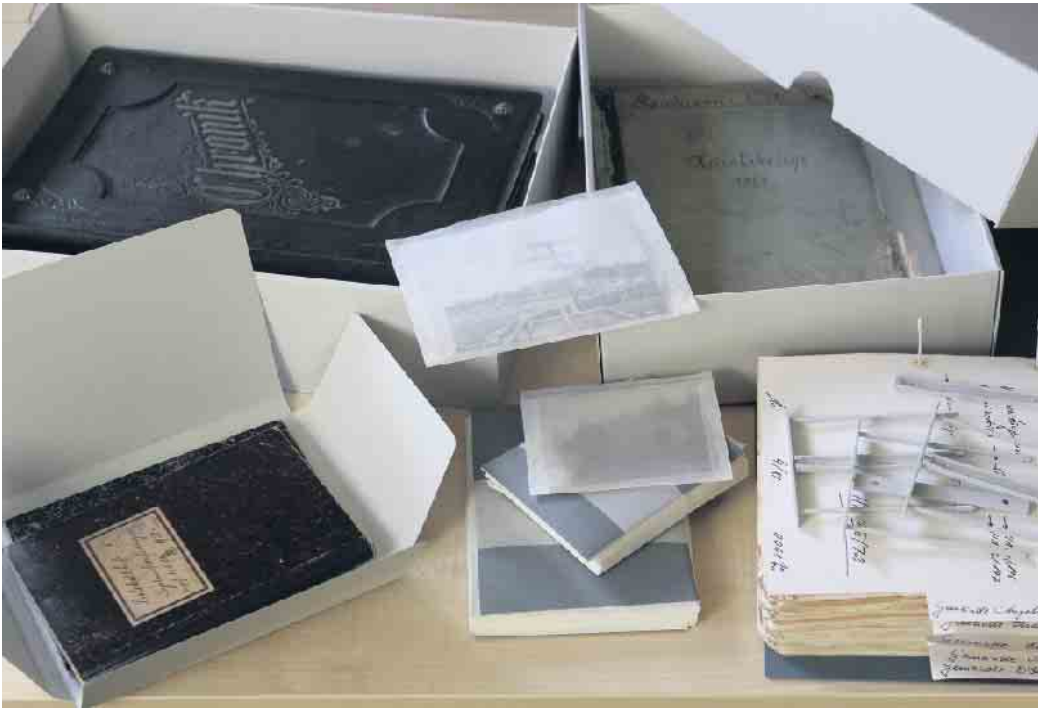
Fundstücke aus dem Archiv der Stadt Elsdorf