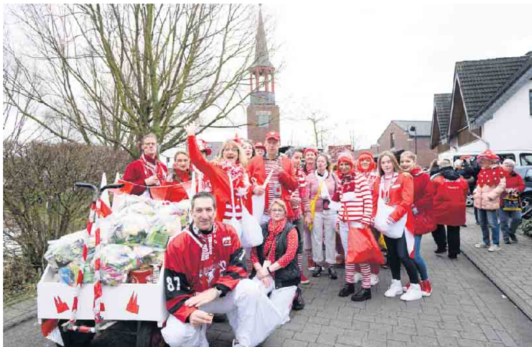
Endlich wieder Karneval in Neu-Etzweiler!

endlich wieder heißen bei einem traditionellen Rosenmontagszug durch Etzweiler. „Jeder, der Spaß am Fastelovend hat und mit uns feiern möchte, ist herzlich eingeladen, am Zug teilzunehmen. Ob bunte Fußgruppen oder kreative Wagenbauer – jeder ist herzlich willkommen, unseren Rosenmontagszug mit zu gestalten“, laden die Etzwei-