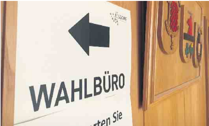
Die Stadt Elsdorf sucht zur Europawahl am 9. Juni Wahlhelfer.

Am 9. Juni wird ein neues EU-Parlament gewählt. Schon jetzt sucht die Stadt Elsdorf Wahlhelfer/innen. Interessierte müssen am Wahltag mindestens 16 Jahre alt sein und die deutsche Staatsangehörigkeit oder die eines EU-Mitgliedsstaates besitzen. Die Aufgaben umfassen die Durchführung der Wahlen in den Wahllokalen sowie die Auszählung der Stimmen. Die Mitglieder der Wahlvorstände treffen sich um 7:30 Uhr in den Wahllokalen; bei der Briefwahl um 15 Uhr. Das Ergebnis wird ab 18 Uhr ausgezählt, so dass die Tätigkeit in den frühen Abendstunden beendet sein wird. Es können Schichten vereinbart werden, so dass niemand über den gesamten Tag anwesend sein muss. Für die Tätigkeit wird - je nach Position im Wahlvorstand - ein Erfrischungsgeld i.H. von 30 - 50 Euro gezahlt. Interessierte Wahlhelfer/innen können sich im Wahlbüro der Stadt Elsdorf unter wahlbuero@elsdorf.de oder 02274 - 709 344 melden.