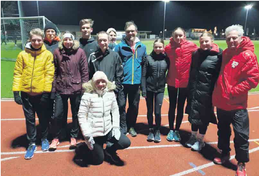
ASG Elsdorf und DJK Novesia Neuss beim ersten gemeinsamen Training.

Die Leichtathletikabteilungen der DJK Novesia Neuss und der ASG Elsdorf schlagen ein neues Kapitel der Zusammenarbeit auf. Beide Vereine haben erkannt, dass eine gemeinsame Anstrengung zu einer bereichernden Erfahrung für ihre Athleten führen kann. Die zukünftige Kooperation konzentriert sich auf verschiedene Aspekte. Gegenseitige Trainingsmaßnahmen und Disziplinvielfalt Einer der Schlüsselpunkte der Zusammenarbeit ist der Austausch von Trainingsmethoden und die Möglichkeit, Disziplinen zu trainieren, die in einem der Vereine nicht angeboten werden oder angeboten werden können. Athleten können somit von der Expertise der Trainer des jeweils anderen Vereins profitieren und ihre Fähigkeiten in neuen Bereichen verbessern.