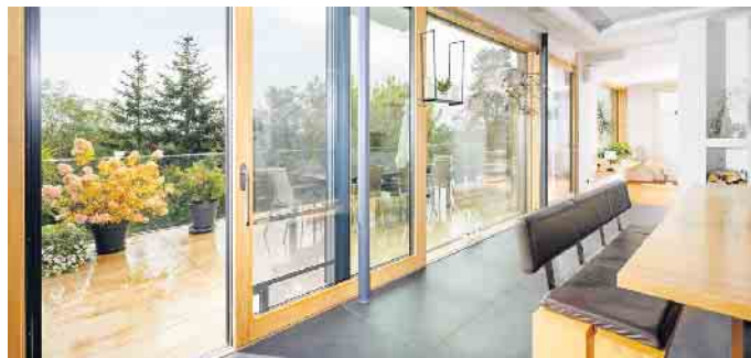
Holzfenster: der nachhaltige Klassiker.

„Mehr und mehr Bauherren mixen die Vorteile der verschiedenen Materialien“, so der Fensterexperte. „Holz-Metall-Fenster beispielsweise bieten auf der Innenseite die warme Ästhetik des Naturmaterials, während außen die Metalloberfläche widrigsten Wetterbedingungen trotzt.“ Auch Kunststofffenster können mit Aluminium kombiniert werden, das auf die äußeren Fensterrahmen aufgesetzt wird. Außerdem besteht die Möglichkeit, die Aluminiumaußenseiten farbig pulverzubeschichten. „Auf diese Weise gewinnt man außen die Optik und Witterungs-