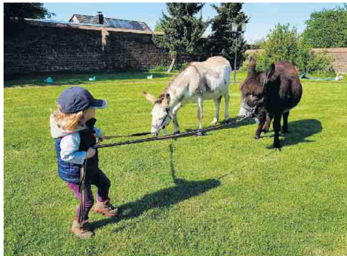
Wer führt wen?

Du interessierst Dich für Esel und möchtest an einem Esel-Express teilnehmen? Deine Eltern haben aber nicht genug Geld und Dein Taschengeld ist viel zu knapp? Bist Du vielleicht ein Flüchtlingskind? - Kein Problem. Die Tierfreunde Rhein-Erft halten Gutscheine für Kids wie Dich bereit. Bitte Deine Eltern, Dich bei den Tierfreunden Rhein-Erft anzumelden.