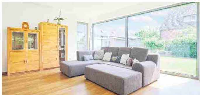
Aluminiumfenster sind bei großformatigen Panoramafenstern besonders beliebt.

Wer baut oder modernisiert, muss viele Entscheidungen treffen. Gerade bei Fenstern sollte die Wahl gut überlegt sein, geben diese doch einem Haus erst sein Gesicht. Der Verband Fenster + Fassade (VFF) stellt die Klassiker vor und verrät wichtige Trends.