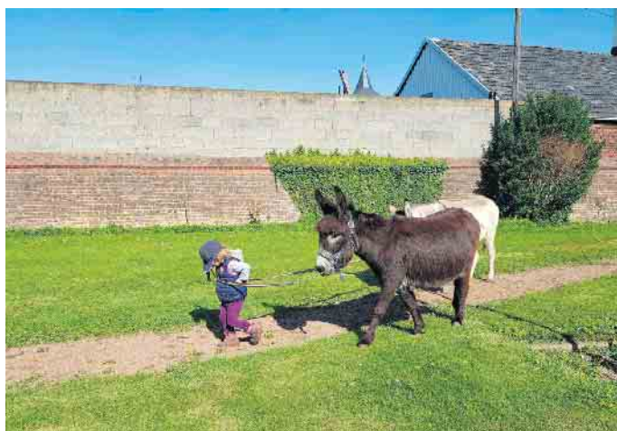
Geht doch...