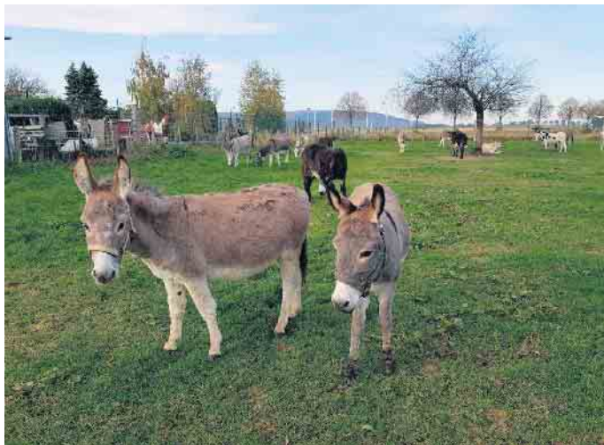
Esel auf der Weide

Kids aus Elsdorf und Umgebung aufgepasst