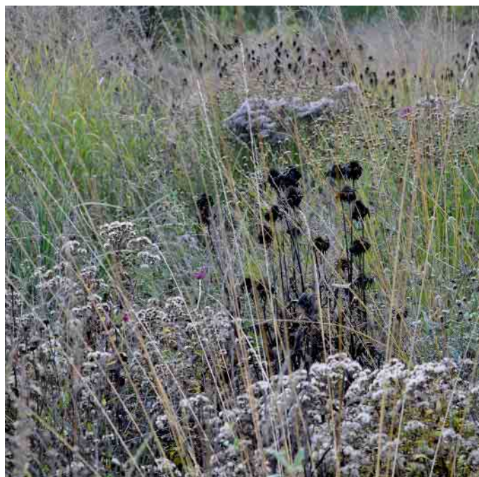
Spätsommer- und Herbstblüher für Nützlinge und Vögel stehen lassen.

Grasflächen benötigen vor dem Wintereinbruch eine letzte Mahd. Besonders in schneereichen Gebieten kann es sonst zu Pilzkrankheiten wie Schneeschimmel kommen. Auch im Winter kann es inzwischen notwendig werden, den Rasenmäher aus dem Schuppen zu holen. Faustformel: Ist das Gras in der kalten Jahreszeit über