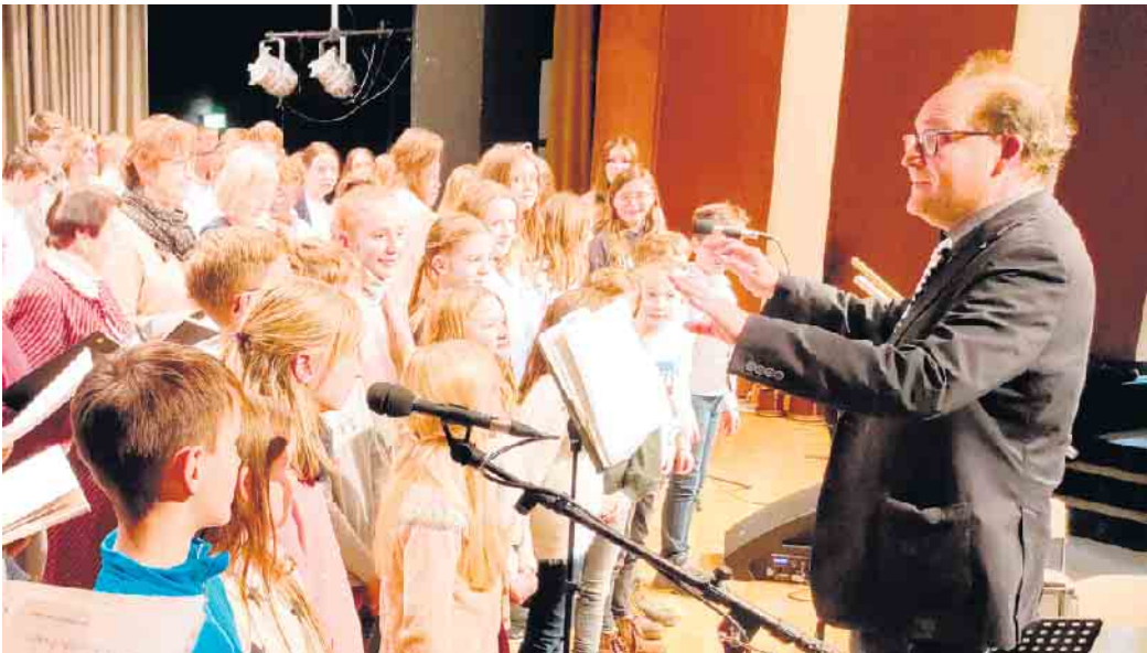
Schulchor und Chorkurs der Stufe 5

Endlich findet in diesem Jahr am Dienstag, 19. Dezember (19 Uhr) wieder unser traditionelles Weihnachtskonzert statt. Der Eintritt ist frei; wir freuen uns sehr auf Ihr Kommen - und Mitsingen! Viele Mitwirkende präsentieren gemeinsam ein festliches und abwechslungsreiches Programm: Der Q1-Vokalpraxiskurs, der extra zu diesem Anlass gegründete BGH-Projektchor, Solistinnen und Solisten sowie die beiden neuen Orchester-AGs: Das Streichorchester und das Kammerorchester Last but not least nimmt natürlich auch das BGH-Weihnachtsorchester teil. Wir freuen uns auf Ihr Kommen und grüßen herzlich!