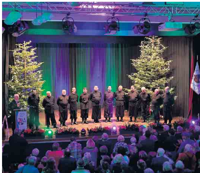
Weltstars in Eitorf - die Don Kosaken gaben sich die Ehre und sangen im Theater am Park.