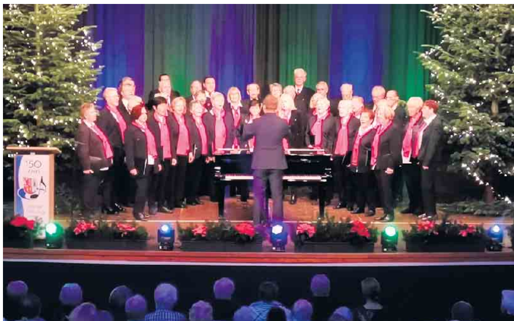
Der Eitorfer Gesangverein von 1873 e. V. sang vor ausverkauftem Haus.