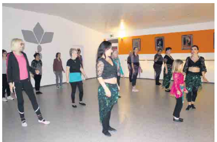
Winterfest im Tanzstudio „TanzFit“ Eitorf

kurz. So genossen alle Beteiligten bei Tee und Gebäck das gemütliche und entspannte Beisammensein. Ab Mitte Januar geht es mit den Tanzkursen im Orientalischen Tanz (alle Stufen) und Tanzfitness-Kursen weiter und wir freuen uns auf (hoffentlich viele!) neue Mittänzerinnen. Mehr Information dazu unter 02243/9173925 oder auf www.tanz-fit-eitorf.de