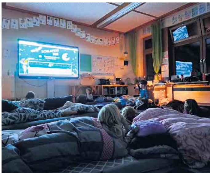
Radionacht in Harmonie

Und alle sind sich einig: nächstes Jahr soll es wieder heißen: Schlafen? Nö!