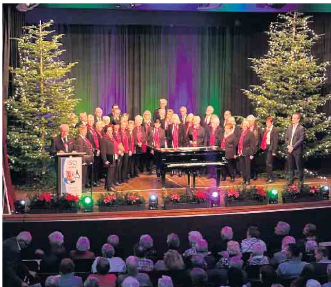
Der Eitorfer Gesangverein von 1873 e. V. eröffnete das festliche Adventskonzert mit dem Lied „Advent ist ein leuchten“