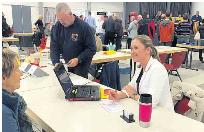
Eindruck von den Eitorfer Herzwochen.

Sollten sich einzelne Personen oder Organisationen in dieser Danksagung nicht wiederfinden,