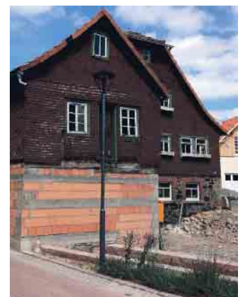
Bevor die Maler kamen, war die Mühle in einem traurigen Zustand.

Die Nachwuchsförderung und damit die Zukunft der „Next Generation“ im Maler- und Lackiererhandwerk ist wesentlicher Bestandteil der Caparol-Firmenphilosophie. Mit der Initiative „Mal Dir Deine Zukunft aus!“ werden Berufseinsteiger oder frischgebackene Selbstständige - mit einem breiten Förderangebot unterstützt. Mehr unter www.caparol.de/nachwuchsfoerderung (akz-o)