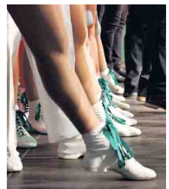
Die 121 Tänzer*innen der KG Turm-Garde sind bereit!