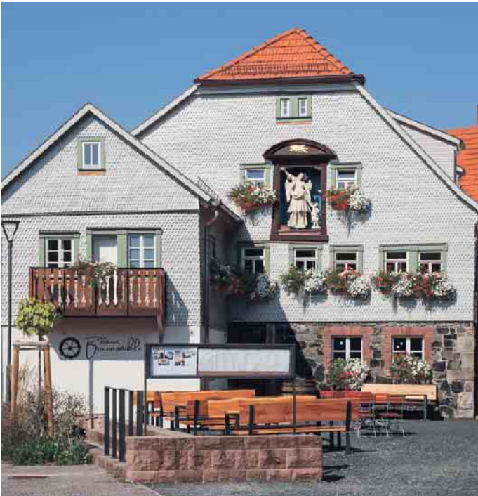
Wer die alte Mühle kannte, kommt aus dem Staunen nicht heraus.