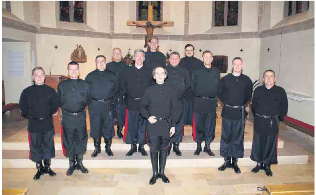
Die Original Don Kosaken aus der Ukraine gastieren am 2. Dezember in Eitorf.

Dieser grandiose und aus unzähligen Fernsehsendungen und CD-Einspielungen bekannte Chor wird am 2. Dezember, 19 Uhr , getragen von der Begeisterung seines Publikums, stimmungsgewaltig mit einem bravourösen neuen Konzert-Programm in Eitorf gastieren. Die Don Kosaken freuen sich ganz besonders, dass dieses festliche Konzert anlässlich des 150-jährigen Jubiläums des Eitorfer Gesangvereins stattfinden wird. Es ist ein großer Anlass, den die Sänger ganz besonders festlich begehen möchten. Ein musikalisches Fest großer Stimmen und inniger Gesänge erwartet die Zuhörer. Ermöglicht wurde dieses Konzert durch eine enge und überaus vertrauensvolle Zusammenarbeit mit dem Eitorfer Gesangverein, vertreten durch den 1. Vorsitzenden, Herrn Günter Marx.