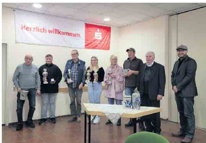
Erfolgreiche Züchterinnen und Züchter

Nach zwei Jahren Pandemie bedingtem Ausfall fand in diesem Jahr wieder die Kaninchenschau des „R 83“ im Bürgerzentrum statt. Unter Schirmherrschaft des Bürgermeisters wurden dort vergangenen Samstag und Sonntag die ausgezeichneten Tiere ausgestellt.