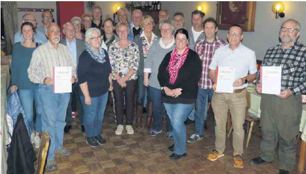
Die Gruppe verdienter Blutspenderinnen und Blutspender