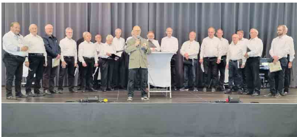
Chor MGV Alzenbach