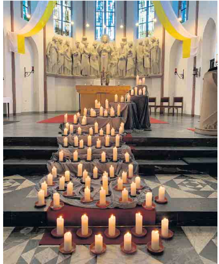
Evensong zu Allerheiligen