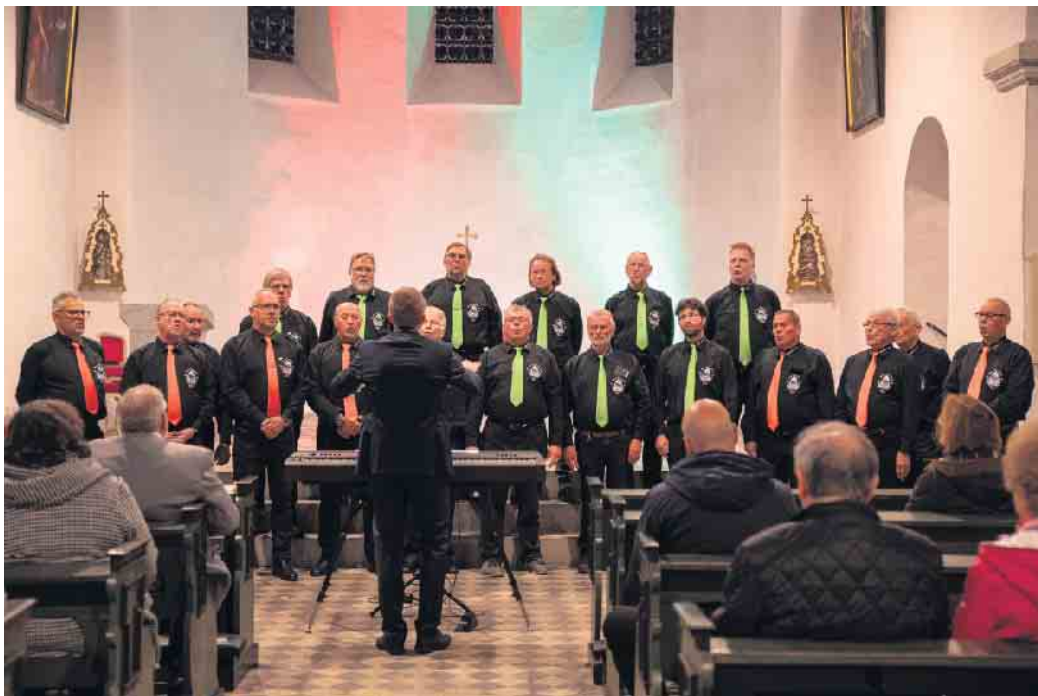
Der Chor beim Herbstkonzert im letzten Jahr.