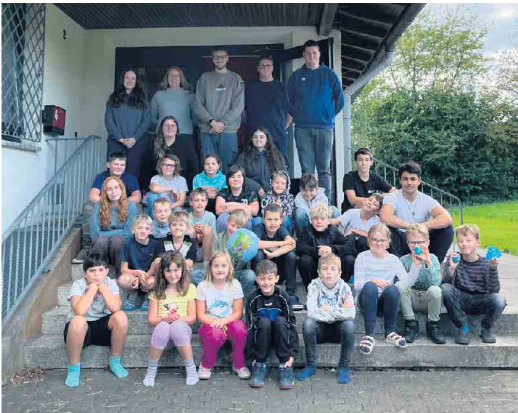
Die Kinder, Betreuer*innen, Teamer*innen und das Logistikteam aus Eitorf

Darüber hinaus startete am Samstag eine große Kochaktion, bei der die Kinder gemeinsam mit