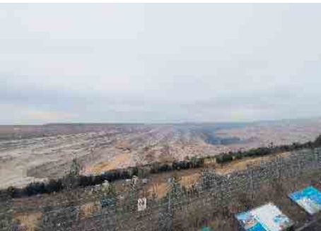
Abbildung 1: Abbruchkante des Tagebaus in Hambach.