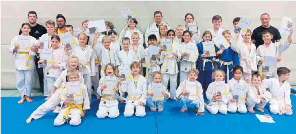
TN und Prüfer der Gürtelprüfung vom 10. Oktober

Zum zweiten Mal in diesem Jahr fanden am 10. Oktober beim Eitorfer Judo Club Gürtelprüfungen statt. Hierbei mussten, je nach Schwierigkeitsgrad, neben den wichtigen Fallübungen, verschiedene Wurftechniken sowie Techniken des Bodenkampfs gezeigt werden. Die mehrere Wochen dauernde Vorbereitung zeigte Erfolg. 35 Judoka beiderlei Geschlechts und diverser Altersgruppen legten eine erfolgreiche Prüfung ab. Sicherlich auch ein Verdienst des engagierten Trainerteams. Mit Abstand waren die Kinder die größte Gruppe, bei denen der Eitorfer Judo Club im vergangenen Jahr einen erfreulich starken Zulauf verbuchen konnte.