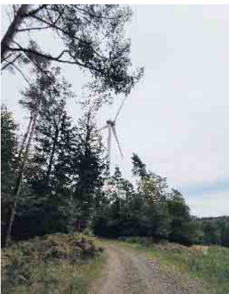
Abbildung 3: Umgebung des Windparks Hürtgendwald-Peterberg 5 Jahre nach der Inbetriebnahme. Die Zuwege zum Windrad gab es teilweise bereits vor dem Bau.

bedarfs bis zum Jahr 2045 decken. Klarheit darüber, ob und wie viele Windräder in Eitorf entstünden, würde es erst in den kommenden Jahren geben und hänge in erster Linie von der Investitionsentscheidung von Flächeneigentümern ab. Eine erste Orientierung gebe der Sachliche Teilplan Erneuerbare Energien für den Regierungsbezirk Köln, der im Herbst diesen Jahres erarbeitet werden soll. Es war ein eindrucksvoller Tag mit spannenden Einsichten und Diskussionen. Die Gemeinde Eitorf bedankt sich bei der Bürgerenergie Rhein-Sieg für die gute Organisation und bei allen Teilnehmenden.