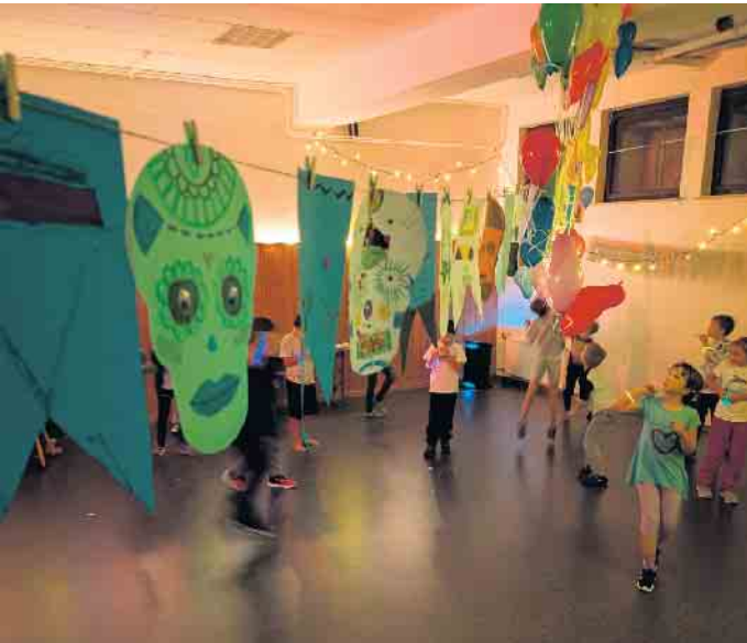
Am Samstagabend gab es eine Kinderdisco inklusive eines Tanzwettbewerbes

Als dann das Kochteam erschöpft und das Essen verputzt war, ging es für die Kinder in die Kinderdisco. Hier hat die Freizeit dann mit Kinderschminke, Stopptanz und