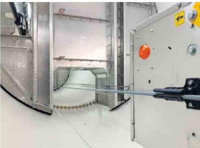
Abbildung 2: Einblick in das Innere eines Windrads. Ein winziger Aufzugsschacht führt für Wartungsarbeiten in luftige Höhen.

Natur und die von der Anlage mit 5,6 MW Leistung und 125 m Masthöhe verursachten Geräusche. Ein vor Ort anwesender Techniker ermöglichte spontan sogar einen Einblick in das Innere des Windrads für alle Interessierten. Das anschließend besichtigte Windrad im Windpark Hürtgenwald-Peterberg wurde 2019 in Betrieb genommen und verschaffte den Anwesenden einen Einblick, wie die umliegende Natur eines Windrads 5 Jahre nach der Inbetriebnahme aussieht. Auf der Rückfahrt wurden im Bus Fragen zur Perspektive zum Bau von Windrädern in Eitorf beantwortet, darunter auch kritische Fragen von betroffenen Anwohnern. Natur- und Klimaschutz müssten Hand in Hand gehen, betonte Bürgermeister Rainer Viehof. Weiterhin erläuterte er durch das Bürgerbeteiligungsgesetz entstehende wirtschaftliche Chancen für Eitorf. Die Klimaschutzbeauftragten der Gemeinde ergänzten die Bedeutung von Windenergie für den Klimaschutz. 10 Windräder könnten somit annähernd über das Jahr gemittelt zwei Drittel des stark ansteigenden Strom-