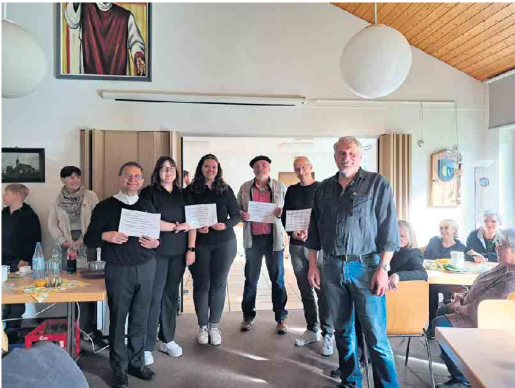
Glückliche Spendenempfänger im Alzenbacher Pfarrheim!

Einer sehr schönen Erntedankmesse, musikalisch stimmig gestaltet vom Pfarrsingkreis, folgte am Sonntag, 13. Oktober, ein gemütlicher Frühschoppen mit Kürbissuppe und anderen Leckereien im herbstlich geschmückten Alzenbacher Pfarrheim. Ein schönes Highlight war auch die Spendenübergabe unseres