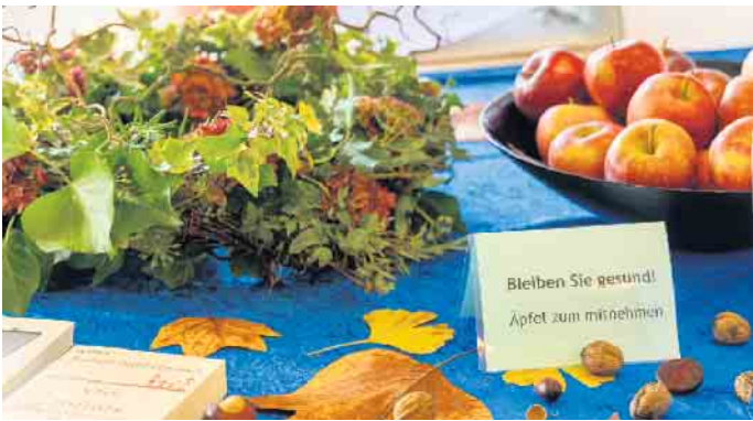
Gesunde Lebensweise.

Verantwortung durchführen kann. Es liegt an jedem Einzelnen, dies umzusetzen. Viele Informationen hierzu können Sie bei uns am 16. November erhalten. Darüber hinaus bieten wir Informationen zu wichtigen Impfungen, die vor vielen unangenehmen und gefährlichen Krankheiten schützen können. Wir laden alle interessierten Bürgerinnen und Bürger aus Eitorf und Umgebung ein, sich über den aktuellen Stand von Prävention, Diagnostik und Therapie der Herzschwäche und von Lungenerkrankungen bei uns zu informieren. Jugendliche und jüngere Erwachsene sind besonders willkommen. Sie haben noch die größten Chancen, einer Herzinsuffizienz zu entgehen. Besuchen Sie uns gerne auch auf Facebook. Unsere Seite heißt „Ei-