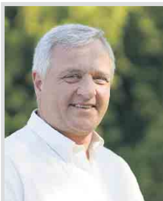
Bürgermeister Rainer Viehof