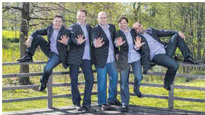
Die a-capella-Gruppe „die Kellner“