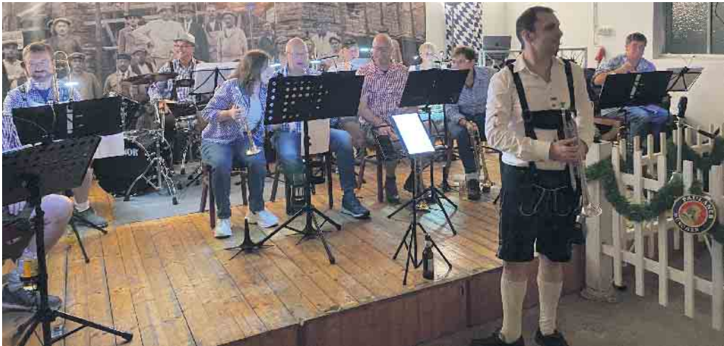
Oikumena Brass auf Oktoberfest in Frankenhalle