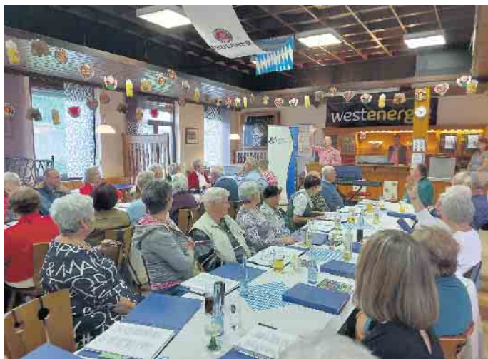
Ausgelassene und fröhliche Stimmung beim Mitsingabend des Eitorfer Gesangverein.