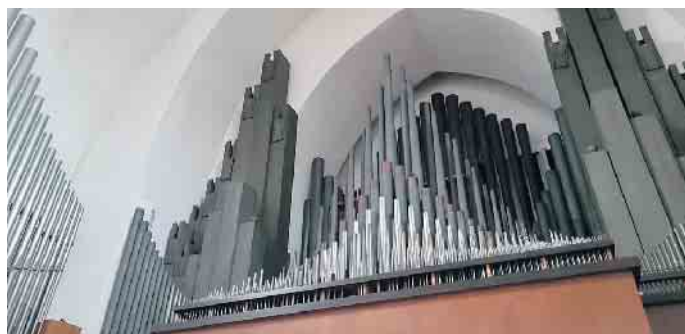
Orgel St. Patricius