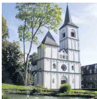
St. Agnes Kirche in Merten

gen 18.30 Uhr, besteht die Möglichkeit zum Small-Talk mit Umtrunk im Dorfgemeinschaftshaus. Rüdiger Gräf Schriftführer/Pressewart www.mgv-merten-sieg.de