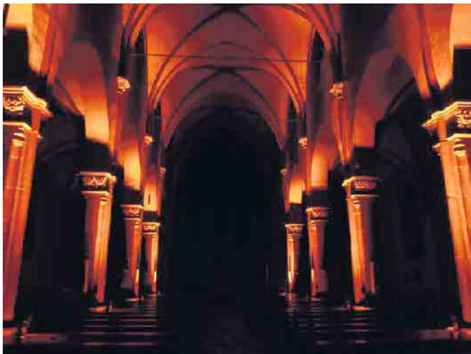
St. Patricius Evensong

In diesem Rahmen eingebettet findet sich eine Abfolge von Psalmen, Bibellesung, Gesängen des Chores und der Gemeinde, Gebeten und Phasen der Stille. Das Vaterunser ist ebenso fester Bestandteil unserer Evensongs wie Fürbitten und die beiden großen biblischen Hymnen, das Lied der Maria „Magnificat“ und das Lied