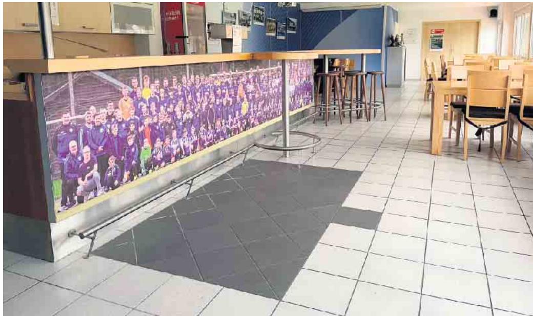
Alle Bürgerinnen und Bürger sowie Vereinsmitglieder sind herzlich eingeladen

Es war toll zu sehen mit wieviel Freude die Menschen Ihre Eitor-