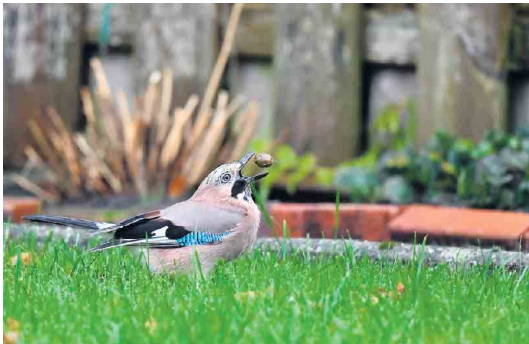
Eichelhäher vergraben Eicheln als Wintervorrat.

Beginn: Samstag, 15. Oktober um 14.30 Uhr. Genauer Treffpunkt in Eitorf wird nach Anmeldung bekannt gegeben. Bei Regenwetter