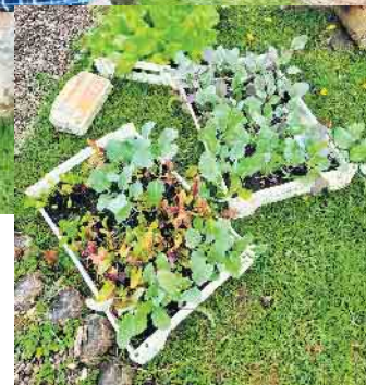
Roboter programmieren an der Fachhochschule Bonn-Rheinsieg