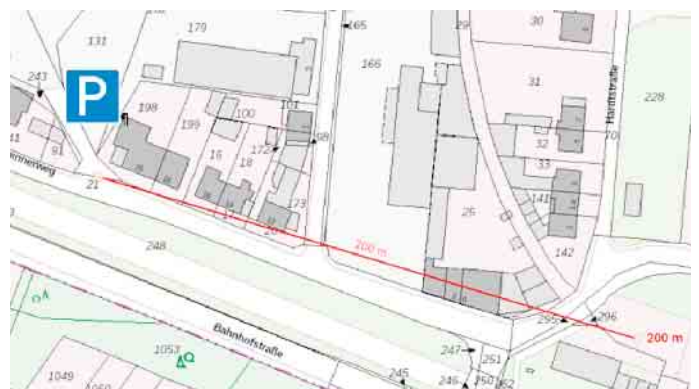
Zusätzliche Parkplätze zur Eitorfer Kirmes

Bei Rückfragen ist das Marktamt unter 02243-89186 zu erreichen.