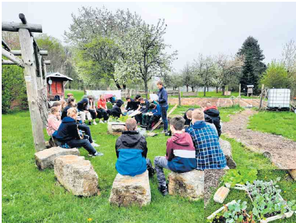
Pflanztag in der Ackerdemie.

So steht es im offiziellen Presse-text des Vereins MINT Zukunft e.V., wobei die vier Buchstaben für die Begriffe Mathematik, Informatik, Naturwissenschaften und Technik stehen. Der Vorstand