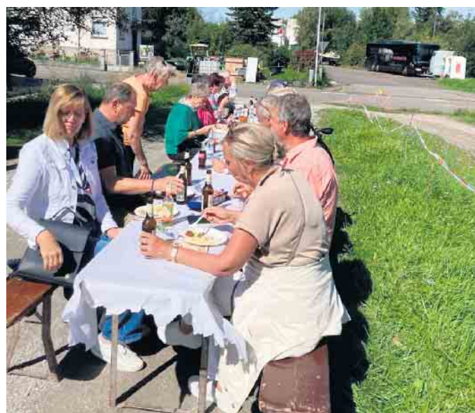
Stärkung vor der Draisinenfahrt