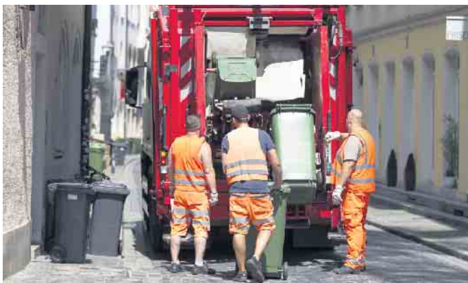
Jobrisiko Sonne: Beschäftigte in Außenberufen sind besonders gefährdet für hellen Hautkrebs.