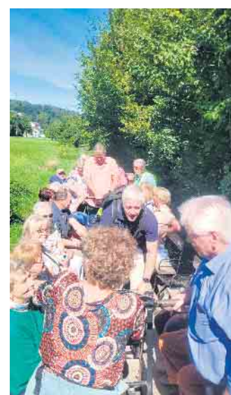
Draisinenfahrt im Aartal

Hier erwartete uns die nächste Überraschung: Die „Kirche“ entpuppte sich als das Restaurant „Pastorale“ in Limburg, in dessen gemütlichem Garten wir unser Abendessen genießen konnten. Auf der Rückfahrt, für die jeder noch eine kleine (flüssige) Wegzehrung spendiert bekam, waren sich alle einig: Das war ein gelungener Auftakt zu hoffentlich wieder regelmäßig stattfindenden weiteren Ausflügen.