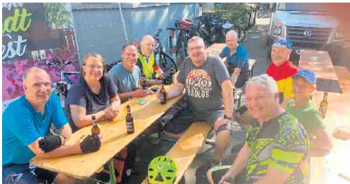
Verdiente Pause beim Hennefer Stadtfest

Einige weitere Problemstellen gibt es auf Eitorfer Gebiet. Der ADFC-Vorschlag, der übrigens auch im Eitorfer Radverkehrskonzept steht, ist der Bereich L333 Ortseingang Eitorf bis Harmonie. Hier sollte die Vorzugsroute am Klärwerk vorbei führen und in Harmonie statt zurück auf die L333 unter der Bahnlinie herlaufen, um dann nördlich der Bahnlinie bis in die Ortsmitte zu führen. Wenn der Bahnübergang Siegstraße geschlossen wird, sollte der kleine Bahntunnel am Park so ausgebaut werden, dass er für Radfahrende und Fußgänger bequem zu passieren ist. Weiter geht es dann südlich der Bahn bis zu der Straße „Am Fuhrweg“ und weiter Richtung Windeck entweder über eine separate Fußgänger-/Radbrücke neben der bestehenden Alzenbacher Brücke oder eine an die Eisenbahnbrücke von Alzenbach nach Stromberg anzuhängende Radbrücke. Natürlich sind das kühn anmutende Pläne, die sicher nicht in den näch-