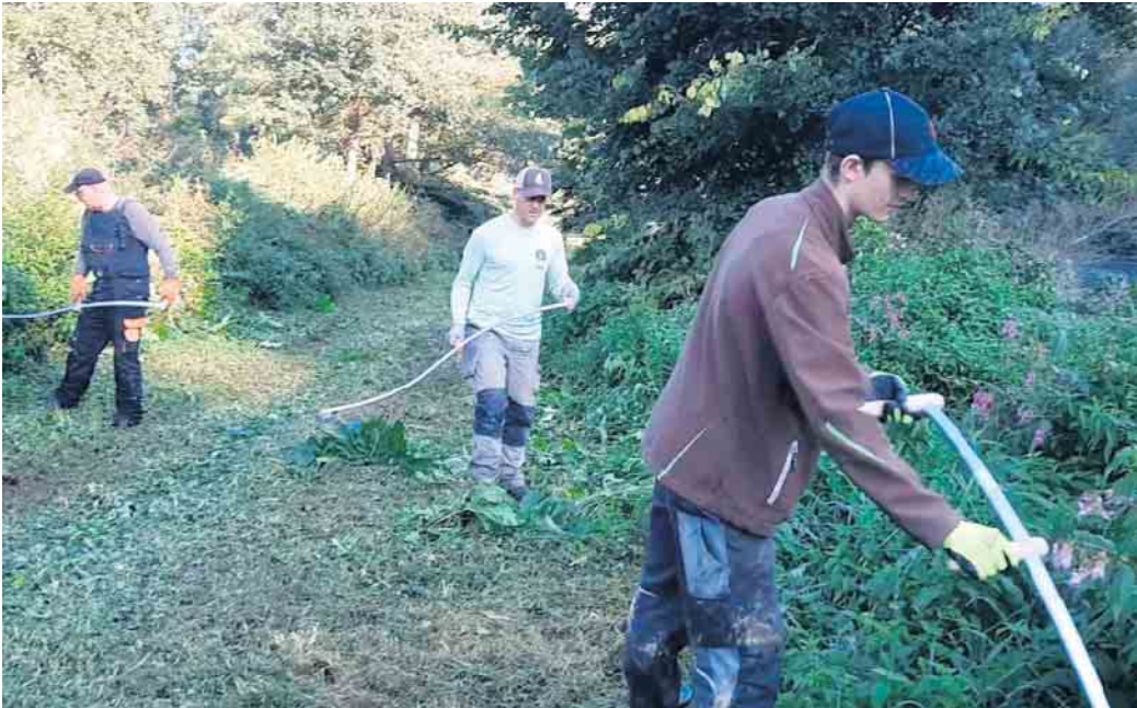
Helfer bei der Arbeit