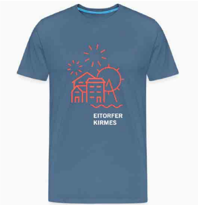
T-Shirt Eitorfer Kirmes

ser limitierten Auflage sind nur noch wenige Exemplare verfügbar, also höchste Zeit zuzugreifen und eins der Shirts zu ergattern. Denn ob ein Kirmes T-Shirt nochmal aufgelegt wird, steht in