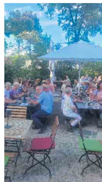
Abendessen in der „Pastorale“