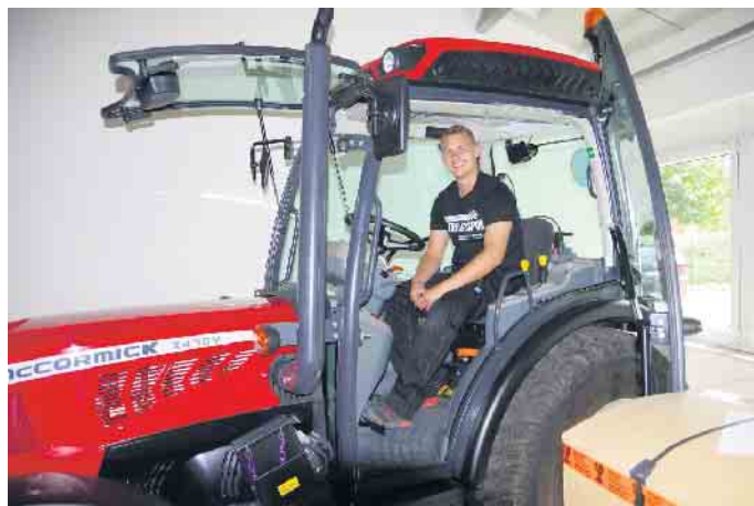
Schweres Gerät sicher beherrschen: Die Leidenschaft für Technik ist eine gute Voraussetzung für eine Ausbildung im Motorgeräte-Fachhandel.