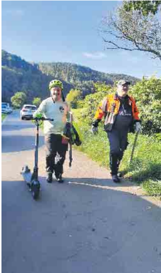
Feierabend auch für den Bürgermeister und Helfer