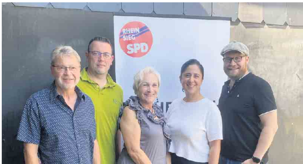
Die Eitorfer Delegierten