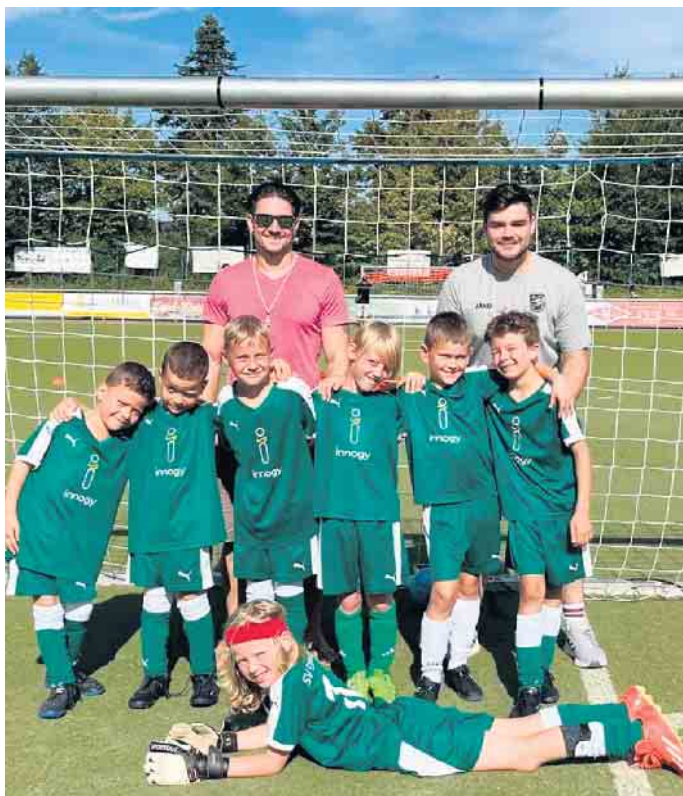
F-Jugend beim Kinderfestival des SV Niederkassel