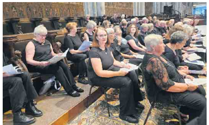
Singen im Kölner Dom