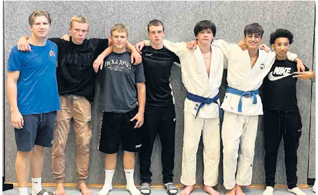
Die männlichen TN mit Trainer

Der Judo Club Hennef und der Eitorfer Judo Club wurde durch folgende Wettkämpferinnen und Wettkämpfer vertreten: