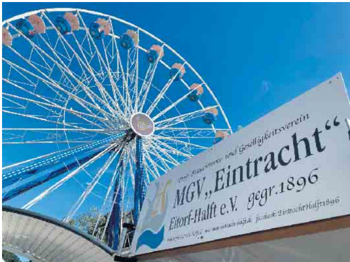
MGV „Eintracht“ Eitorf Halft e.V. auf der Eitorfer Kirmes 2024

Wir freuen uns auf euren Besuch und auf ein gemeinsames, fröhliches Feiern.