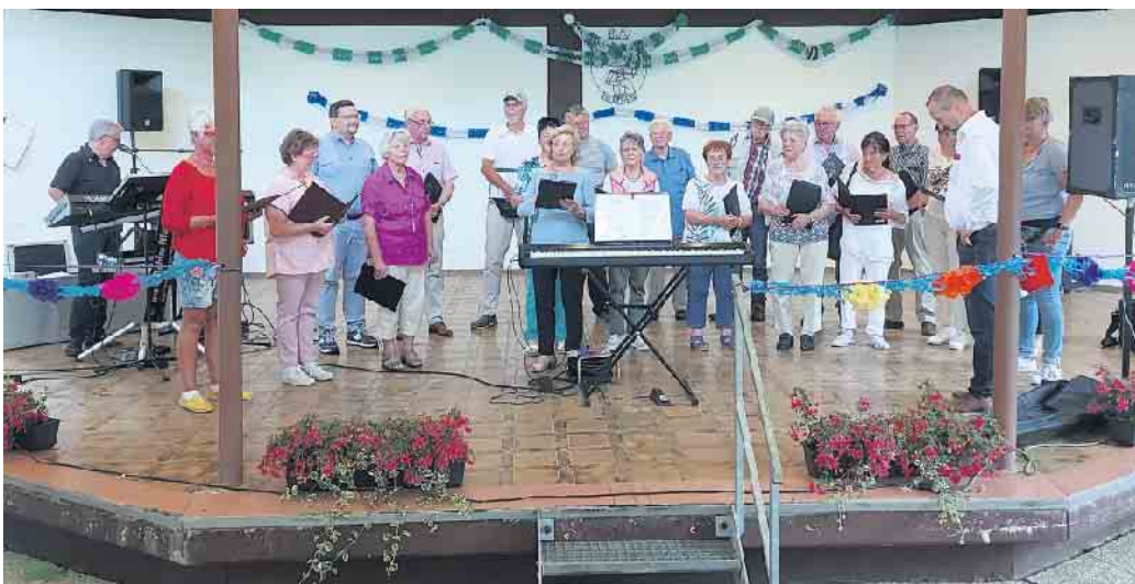
Der EGV (hier mit einer Abordnung beim Auftritt des Wandervereins Herchen) freut sich auf den Mitsingabend beim Heimatverein.

Euer Eitorfer Gesangverein Weitere Informationen unter 02243-912133, www.eitorfer-gesangverein.de , auf Facebook und Instagram.