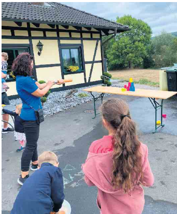
Mit Wasserpistole Dosen treffen