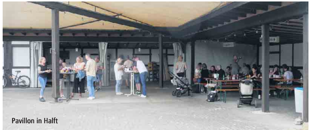
Pavillon in Halft

liches Sommerfest bis in die späten Stunden stattfand. Im Anschluss an die Schnitzeljagd wurde jedem Teilnehmer eine Spar-