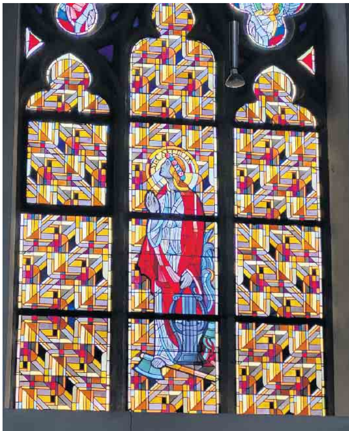
Fenster St. Patricius