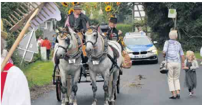
Ernteverein Ottersbachertal 1952 e.V.

Weitere Informationen finden Sie unter www.ernteverein-ottersbachertal.de