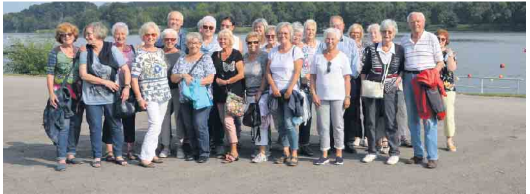
Tagesausflug nach Essen

Am 18. August startete der fast voll besetzte Bus bei diesigem Wetter in Richtung Essen. Mit ei-