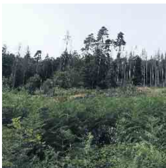
Wald und Holz.NRW

Die Länge der Wanderung beträgt ca. 5 km (bzw. 3,8 km für diejeni- gen, die etwas abkürzen möch- ten) mit leichten bis mittleren Stei- gungen. Festes Schuhwerk ist ge- boten. Dauer: etwa 2 Stunden; Veranstalter: Wald und Holz NRW, Regionalforstamt Rhein-Sieg-Erft. Die Tourist Information der Ge- meinde Eitorf wünscht allen Teil- nehmenden viel Freude bei die- sem informativen Rundgang!