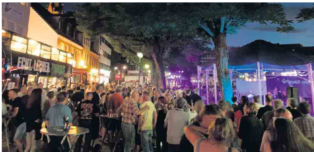
Grandma's Finest spielten am Markt-Pavillon.

Die geballte Ladung handgemachter Live-Musik begeisterte das sehr zahlreiche Publikum, das sich rund um den Pavillon, auf den Markterrassen sowie in den Gaststätten eingefunden hatte.