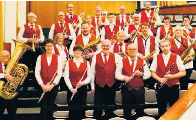
Die Windecker-Musik-Vereinigung.

„Ja ist der Sommer denn schon vorbei?“, mögen sich manche fragen, die nach Ferien und Urlaub wieder in den Alltag gestartet