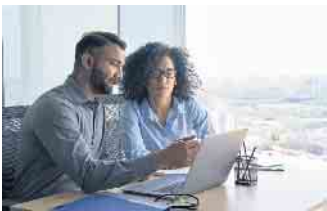
Mit praxisorientiertem Wissen bereiten die Kurse auf die Anforderungen der IT-Welt vor.

etwa gibt es ausführliche Informationen, eine Übersicht aller Kurse und eine Kontaktmöglichkeit. Abgerundet werden die Qualifizierungsangebote durch das sogenannte Hiring-Netzwerk: Über 600 Unternehmenspartner bieten offene Stellen im Kreis der Kursabsolventen an und können somit Vakanzen schneller besetzen. Die Vermittlungsrate liegt bei über 80 Prozent. (DJD)