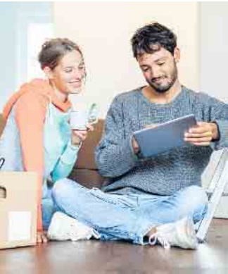
Der Traum vom Eigenheim gehört für viele Paare zur Eheschließung und zur Familienplanung.