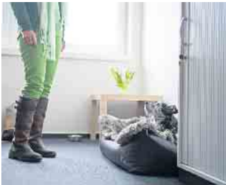
Kollege auf vier Pfoten: Hunde im Büro werden von vielen Unternehmen akzeptiert. Wichtig sind jedoch klare Regeln.

Für das gute Miteinander sollte besonders auf Menschen Rücksicht genommen werden, die Angst vor Hunden haben, Allergien aufweisen oder keine Erfahrung im Umgang mit den Tieren haben. Hunde, bei denen bestimmte Verhaltensmuster stark ausgeprägt sind, wie zum Beispiel Herdenschutzhunde, sind mitunter für den Büroalltag nicht geeignet. Noch ein wichtiger Tipp: Läufige Hündinnen sollten in ihrer heißen Phase zu Hause bleiben, um den Bürofrieden mit anderen Hunden nicht zu beeinträchtigen. In den Büros von „Das Futterhaus“ ist man glücklich über die Bürohunde und die Unterstützung durch den Tiertrainer. 19 Vierbeiner haben aktuell die Prüfung erfolgreich absolviert. „Uns war es wichtig, auch die Bedürfnisse von Mitarbeitenden ohne