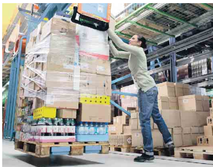
Erkrankungen des Muskel-Skelett-Systems machen den größten Anteil an den Arbeitsunfähigkeits-Tagen aus.

Die Möglichkeiten der Prävention von Muskel-Skelett-Erkrankungen sind vielfältig. Beratung und Schulungen gehören hier genauso dazu wie arbeitsplatzbezogene Maßnahmen. Dabei sollte deren Umsetzung nicht „von oben“ bestimmt werden. Eine Maßnahme wird in aller Regel von den Beschäftigten besser akzeptiert, wenn diese an der Verbesserung beteiligt werden und mitgestalten können. In vielen Fällen liegt eine Problemlösung auch bereits als Idee in den Köpfen der Beschäftigten vor. (akz-o)