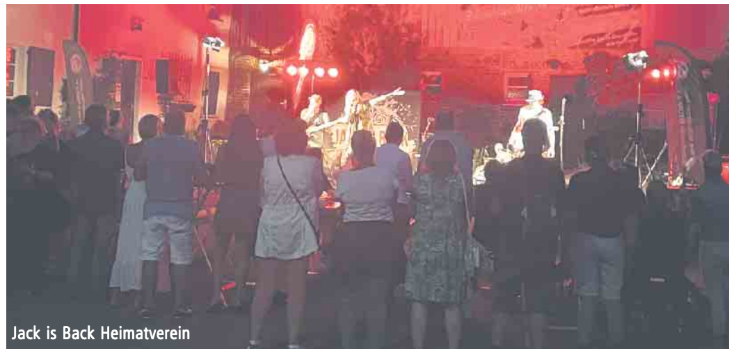
Jack is Back Heimatverein

Ein herzliches Dankeschön an unsere Hauptsponsoren die Kreissparkasse Köln und die Volksbank Köln-Bonn, die uns auch in diesem Jahr wieder mit einer großzügigen Spende bedacht haben. Danke auch der Gemeinde Eitorf für die Unterstützung, allen Helfer, Team Jägerheim, Broiler-Room-Foodtruck und dem Aktivkreis. Und selbstverständlich Ihnen / Euch unserem Publikum! Aber damit ist ja noch nicht Schluss für dieses Jahr! Am 5. August geht es weiter mit unseren Feierabendmärkten, jeden 1. u. 3. Freitag im